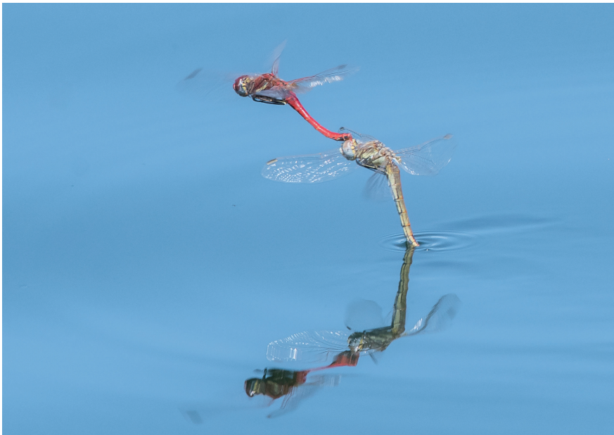
Abbildung 4: Eiablage der Zuwanderungsgeneration von Sympetrum fonscolombii. Tandems fliegen über offenes Wasser, oft weit von der Uferzone entfernt; See 3 km nordöstlich von Schortens, Niedersachsen, 18.06.2019. – Figure 4. Oviposition of immigrant S. fonscolombii. Tandems fly over the open water, often distant from the lakeshore; lake 3 km northeastern of Schortens, Lower Saxony, 18-vi-2019.