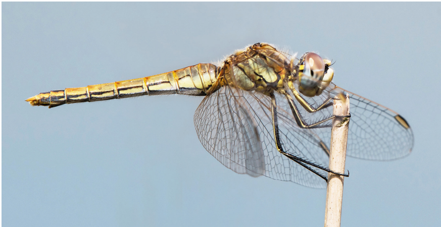
Abbildung 2: Weibchen der Immigrationsgeneration von Sympetrum fonscolombii. Sie kommen nur zur Paarung und Eiablage ans Gewässer und werden daher viel seltener gesehen als Männchen; See 3 km nordöstlich von Schortens, Niedersachsen, 18.06.2019. – Figure 2. Female of the immigration generation of S. fonscolombii. Females visit the water site for mating and ovipositing only and hence are seen much less than males; lake 3 km northeastern of Schortens, Lower Saxony, 18-vi-2019.

Die meisten Daten lieferten keinen Hinweis auf längere Verweilzeiten an den Nachweisgewässern. Im Jahr 2019 ergab sich jedoch eine mindestens 68-tägige Anwesenheitsdauer an einem aufgelassenen Baggersee im Landkreis Friesland, knapp 10 km entfernt vom Jadebusen und 14 km von der Nordseeküste. Am 7. Juni wurden dort erstmals zwei Männchen gesehen, am 18. Juni dann 30 Tiere und am 29. Juni 60 Tiere. Danach gingen die Zahlen zurück; die letzten zehn maturen Tiere wurden am 14. August (Abb. 2–5) angetroffen. Paarungen und Eiablagen wurden vom 16. Juni bis zum 20. Juli registriert. Für eine hohe Ortstreuung der kontrollierten Population sprachen sowohl die fortschreitende Ausfärbung der beobachteten Individuen als auch die konstant hohen Abundanzen im Juli.