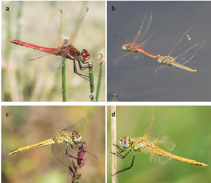
Abbildung 1: Einflug und Reproduktion von Sympetrum fonscolombii im Jahr 2019 an einem Kleingewässer 5 km nordöstlich von Aurich, Niedersachsen. (a) Die ersten Individuen wurden am 17. Juni gesehen; sie waren alle ausgefärbt. (b) Am selben Tag fand auch Eiablage statt. (c) Bei einer Kontrolle am 9. September wurden mehrere frischgeschlüpfte Jungtiere festgestellt, sowohl Weibchen als auch (d) Männchen. – Figure 1. Influx and reproduction of S. fonscolombii in 2019 at a pond 5 km northeastern of Aurich, Lower Saxony. (a) The first individuals were seen on 17 June. They all showed the typical coloration of the mature stage. (b) On that day oviposition also took place. (c) During a check on 9 September several tenerals were seen, females as well as (d) males.

Bereits früh im Jahr tauchten Individuen von S. fonscolombii auf, die völlig oder doch weitgehend ausgefärbt waren. Ein großer Teil der Meldungen bezog sich auf meist männliche Einzeltiere. Nur in den Jahren 2004, 2007, 2008, 2015, 2017 und 2019 wurden auch Zahlen zwischen zehn und 60 maturaer Individuen gemeldet. Die jahreszeitlich früheste Meldung dokumentiert ein einzelnes Männchen, das am 1. Mai 1999 die Leine entlang flussabwärts wanderte. In sieben weiteren Jahren erfolgten die frühesten Nachweise maturaer Tiere ebenfalls im Mai, während