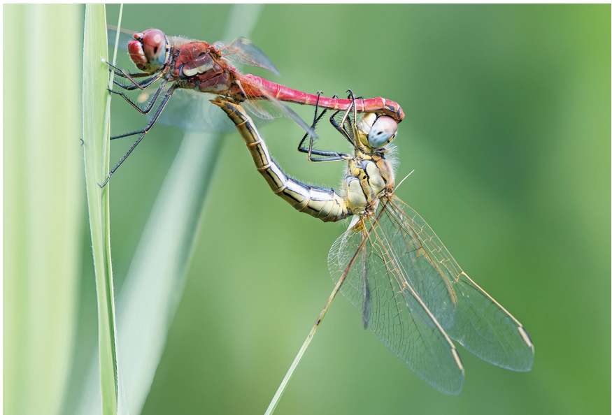
Abbildung 3: Paarungsrade eingewanderter Sympetrum fonscolombii. Weibchen und Männchen finden sich am Wasser und paaren sich dann an niedriger Vegetation in Ufernähe; See 3 km nordöstlich von Schortens, Niedersachsen, 18.06.2019. – Figure 3. Pairing wheel of immigrant S. fonscolombii. Females and males meet at the water site and copulate at low ground vegetation near the lakeshore; lake 3 km northeastern of Schortens, Lower Saxony, 18-vi-2019.

Exuvienfunde, Schlupfbeobachtungen und frisch geschlüpfte Individuen wurden aus einem langen Jahresabschnitt gemeldet (Beispiele für Emergenz im September: Abb. 1c, d). Die Extremwerte waren der 18. Mai 2008 und der 8. November 2019. Aus der ersten Jahreshälfte lag nur eine Handvoll Schlupfmeldungen vor (Tab. 1). Die meisten Emergenzdaten fielen in die Monate August und vor allem September und flauten dann kontinuierlich bis zum Oktober ab. Vom November wurde nur ein Schlupfnachweis gemeldet. Die Schlupfabundanzen bewegten sich meistens auf mäßigem Niveau, aber es gab auch eine Meldung von mehr als 100 geschlüpften Individuen (31.08.2019). Im Jahr 2019 wurde die Emergenz an einem Artenschutzteich bei Wilhelmshaven an jedem zweiten Tag kontrolliert. Hier schlüpfen innerhalb von 21 Tagen (19. August – 8. September) mindestens 170 Individuen. Dabei wurde beobachtet, wie die frisch geschlüpften Jungtiere direkt abwanderten. Bei heftigem SSO/SO-Wind entfernten sie sich in niedriger Flughöhe von geschätzt 30 cm bis 100 cm zielstrebig gegen den Wind. Der Abflug erfolgte selbst noch bei einer Lufttemperatur von nur 13°C ohne Sonnenschein und ohne