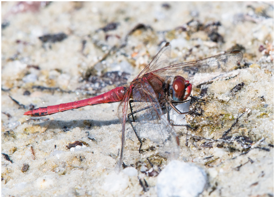
Abbildung 5: Mindestens 68-tägige Anwesenheitsdauer eingewanderter Sympetrum fonscolombii im Jahr 2019 an einem See 3 km nordöstlich von Schortens, Niedersachsen. Nachdem die ersten Männchen bereits am 07.06.2019 gesehen worden waren, hielt sich der Bestand bis zum August; altes Männchen mit verschlissenen Flügeln, 14.08.2019. – Figure 5. Long site fidelity of immigrant S. fonscolombii with a minimum of 68 days in 2019 at a lake 3 km northeastern of Schortens, Lower Saxony. Having seen the first males on 07-vi-2019, the species was continuously present until August; old male with worn wings, 14-viii-2019.

Sympetrum fonscolombii bewohnt ein trocken-heißes Areal, das sich über große Teile Afrikas, den Mittelmeerraum, die Arabische Halbinsel und den Mittleren Os-