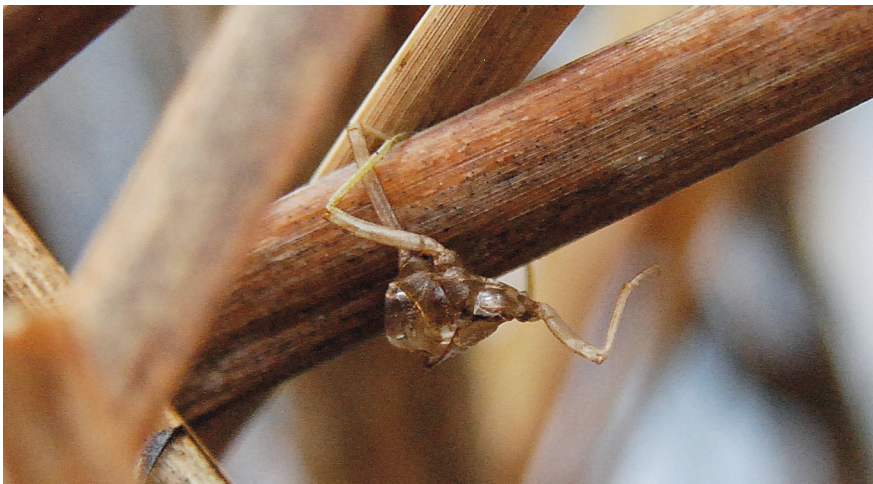
Abbildung 3: Der letzte Nachweis von Aeshna mixta am Griebchensee 2021 gelang anhand dieses Exuvienfragmentes am 15. Dezember. – Figure 3. The last record of Aeshna mixta at the Lake Griebchensee in the year 2021: a fragment of an exuvia found on December 15.

Die Ergebnisse zeigen, dass die Beobachtungen von ROLAND (2010), die an anderen Aeshniden erfolgten, eine Ausnahme darstellten: Die von ihm dokumentierten Exuvien von Anax imperator und A. parthenope wurden in nicht geringer Zahl noch über den Winter hinaus und in Einzelfällen sogar bis in die Schlupf-