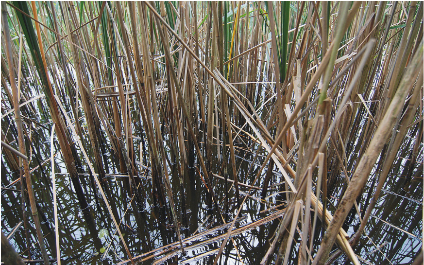
Abbildung 1: Probefläche am Griebchensee: Schilf-Schmalblattröhrcolben-Röhrriecht als Larvalhabitat und Emergenzort, 20. August 2021. – Figure 1. Study site at the lake Griebchensee: larval habitat and emergence site of Aeshna mixta in a reed consisting of Phragmites australis and Typha angustifolia , 20-viii-2021.

Bei der ein- bzw. zweimaligen Aufsammlung an den acht Abschnitten wurden 2021 insgesamt 1.173 Exuvien von A. mixta zusammengetragen. Die Abundanz lag zwischen sechs und 15,5 Exuvien je Meter Uferlänge bei einmaliger sowie bei 6,7 und 14,3 Exuvien bei zweimaliger Aufsammlung.