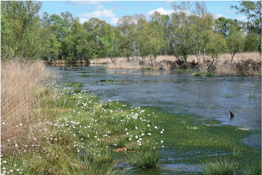
Abbildung 4: Von flutenden Torfmoosen geprägtes Torfstichgewässer im Hündfelder Moor, 30.04.2023. – Figure 4. Water-filled peat cutting with flooding Sphagnum mosses in Hündfelder Moor, 30-iv-2023.