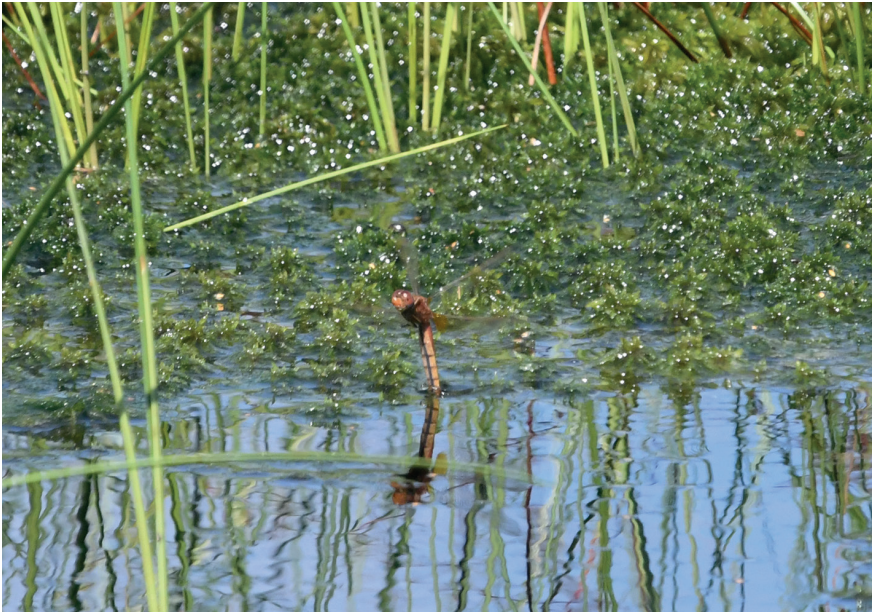
Abbildung 7: Crocothemis erythraea bei der Eiablage in flutende Torfmoose im Hündfelder Moor, 14.08.2023. – Figure 7. Crocothemis erythraea laying eggs in flooding Sphagnum mosses in Hündfelder Moor, 14-viii-2023.