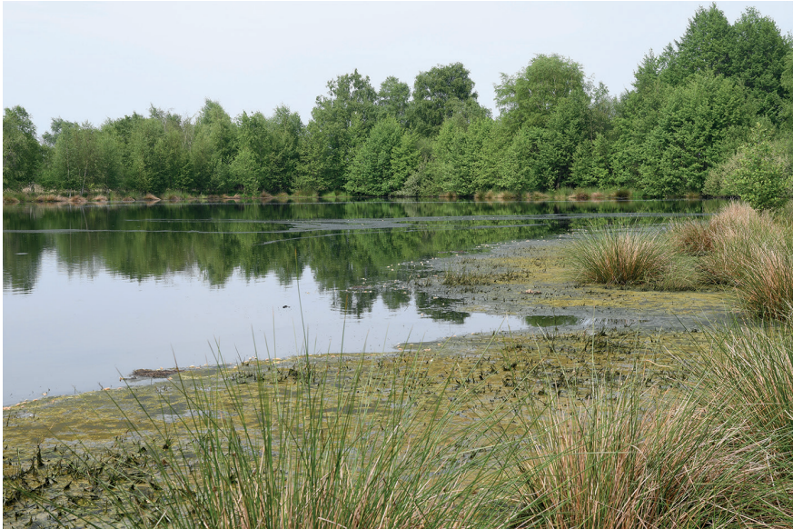
Abbildung 5: Regelmäßig als Gänseschlafplatz genutztes, eutrophiertes Torfstichgewässer im Hündfelder Moor, 21.05.2023. – Figure 5. Eutrophic peat cutting regularly used as a goose roosting site in Hündfelder Moor, 21-v-2023.

Das NSG Ammeloer Venn (70 ha) ist ein ehemaliges Hochmoor, das sich auf niederländischer Seite als Haaksbergerveen (600 ha) fortsetzt. Grenznah befinden sich im verbliebenen Hochmoorkörper einige Torfstichgewässer, an denen die Libellenfauna untersucht wurde. Ein Großteil des Naturschutzgebietes wird von Grünland- und Waldlebensräumen geprägt, die hier vorhandenen Gewässer waren nicht Gegenstand der Untersuchung.