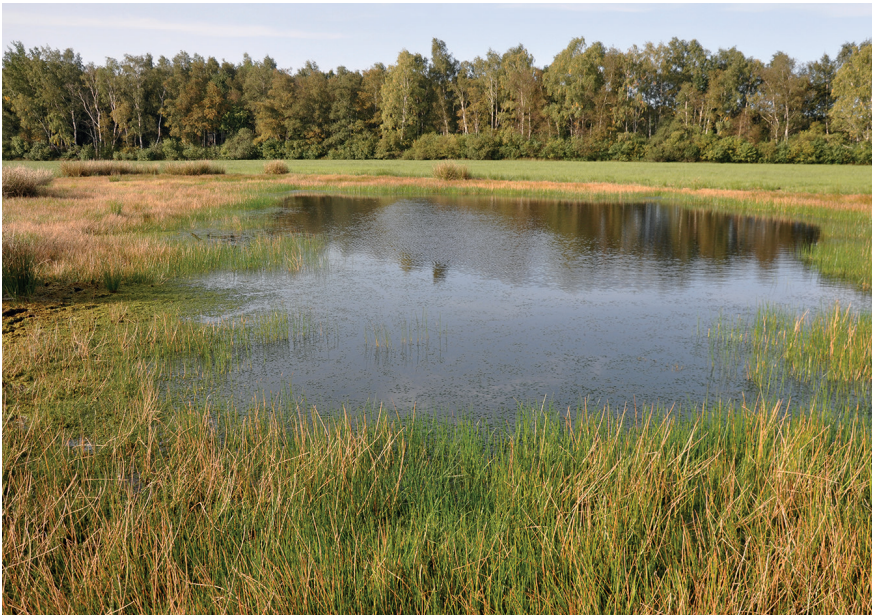
Abbildung 8: Torfmoosreiches Naturschutzgewässer im Grünlandblock des Amtsvenn: Fortpflanzungshabitat von Leucorrhinia dubia, L. rubicunda und Coenagrion lunulatum, 17.09.2020. – Figure 8. Sphagnum -rich pond in Amtsvenn: breeding habitat of Leucorrhinia dubia, L. rubicunda, and Coenagrion lunulatum, 17-ix-2020.

Darüber hinaus wird empfohlen, weitere Artenschutzgewässer anzulegen. Hierbei können von wertgebenden Arten besiedelte Gewässer als Vorbild dienen. Die bisherigen Erfahrungen haben gezeigt, dass sowohl kleinere, altbäuerliche Torfstiche (Abb. 4) als auch gezielt angelegte Artenschutzgewässer (Abb. 8) sehr gut von Moorlibellen angenommen werden. Insbesondere in den großen Moorgebieten gibt es viele vegetationskundlich wenig bedeutende Bereiche, die sich für eine (Neu-)Anlage von Gewässern anbieten. Neben den Libellen profitieren hier von weitere für die NATURA 2000-Schutzgebiete wertgebende Artengruppen wie die Avifauna (z.B. Krickente Anas crecca ) oder die Herpetofauna (z.B. Moorfrosch Rana arvalis , Kleiner Wasserfrosch Pelophylax lessonae ).