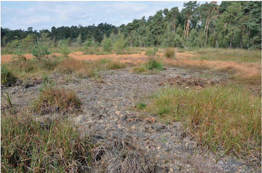
Abbildung 6: Ausgetrocknetes Heidemoor im NSG Lüntener Wald, 12.09.2020. – Figure 6. Dried out heather moor in the Lüntener Wald nature reserve, 12-ix-2020.