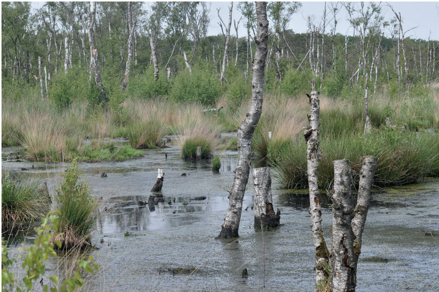
Abbildung 3: Durch Foliendamm angestauter Moorbereich im NSG Burlo-Vardingholter Venn, 02.06.2019. – Figure 3. Bog area dammed by a foil dam in the Burlo-Vardingholter Venn nature reserve, 02-vi-2019.

Das NSG Amtsveenn – Hündfelder Moor (947 ha) bildet zusammen mit dem Aamsveen (178 ha) auf niederländischer Seite einen großen, zusammenhängenden Moorkomplex. Mit einer torfbedeckten Fläche von 1.175 ha und einer Torf-