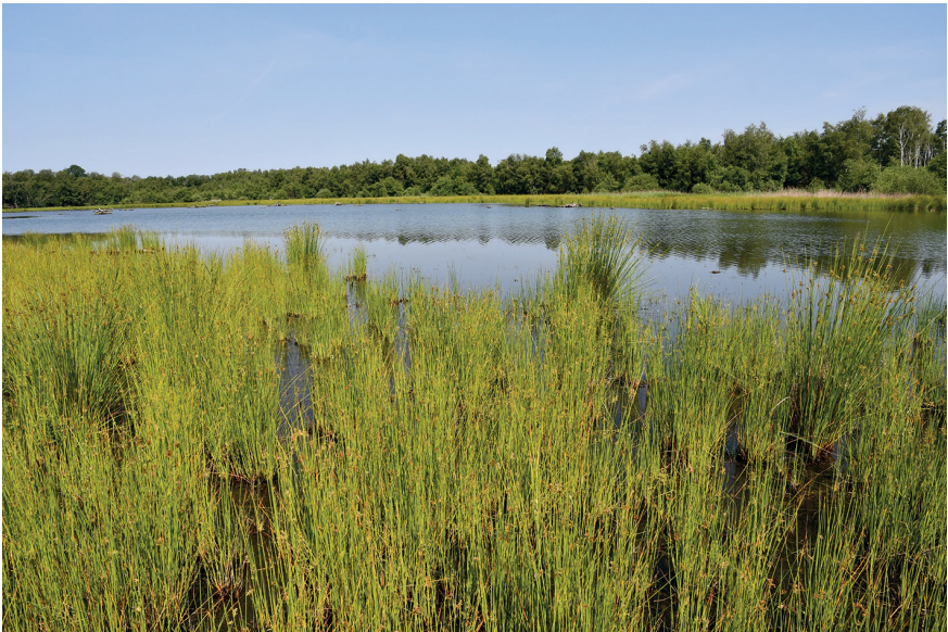
Abbildung 2: Von einem breitem Binsengürtel umgebener eutroph-dystropher Flachwassersee im NSG Zwillbrocker Venn, 15.06.2021. – Figure 2. Eutrophic-dystrophic shallow water lake surrounded by a broad belt of reeds in the Zwillbrocker Venn nature reserve, 15-vi-2021.