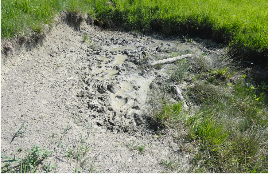
Abbildung 2: Suhltümpel auf der Scheibenwiese, 05.06.2018. – Figure 2. Boar wallow at the Scheibenwiese, 05-vi-2018.