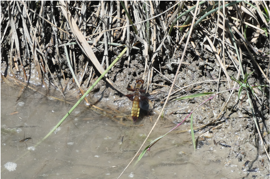
Abbildung 5: Weibchen von L. depressa bei der Eiablage in einen Suhltümpel der Scheibenwiese am 30.06.2018. – Figure 5. Female of L. depressa ovipositing in a wallow pond at Scheibenwiese, 30-vi-2018.

Die Sammlung der Exuvien von L. depressa erstreckte sich vom 25. April bis zum 30. Juni 2018. Exuvien von O. brunneum wurden im Zeitraum 15. Mai bis 20. Juli 2018 gesammelt. Der Nachweis zweier Exuvien von A. cyanea erfolgte am 23. Juni 2018; eine Exuvie von L. quadrimaculata wurde am 22. Mai und eine Exuvie von S. striolatum am 20. Juli gesammelt.