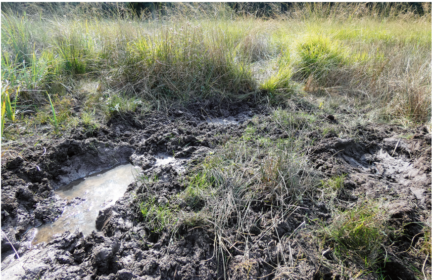
Abbildung 3: Suhltümpel auf der Aumüllerwiese, 20.09.2018. – Figure 3. Boar wallow at the Aumüllerwiese, 20-ix-2018.