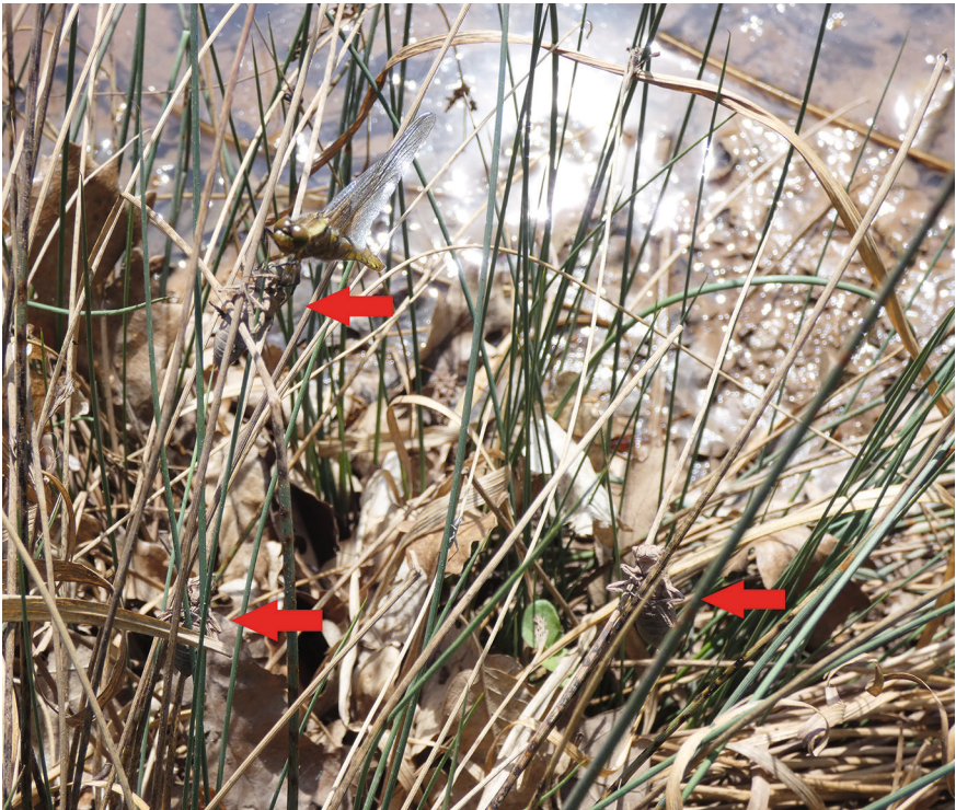
Abbildung 6: Mehrere Exuvien (siehe Pfeile) von L. depressa am 27.04.2018, Aumüllerwiese. – Figure 6. Several exuviae (red arrows) of L. depressa, Aumüllerwiese, 27-iv-2018.