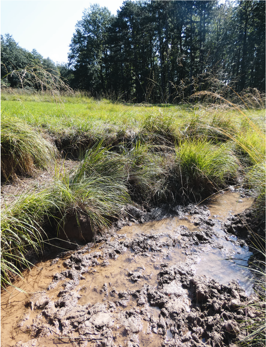
Abbildung 4: Vernässes Wühlfeld mit Suhltümpel und hoher, durch die Aktivität der Wildschweine verursachter Dynamik, Große Auhofer Stockwiese, 19.09.2018. Durch die hohe Dynamik befanden sich die vernässen Vertiefungen laufend an anderen Stellen des Wühlfeldes. – Figure 4. Wetted burrow field with boar wallow and high dynamics caused by the activity of wild boars, Große Auhofer Stockwiese, 19-ix-2018. Due to the high dynamics, the wetted depressions were continuously located in other parts of the burrow field.