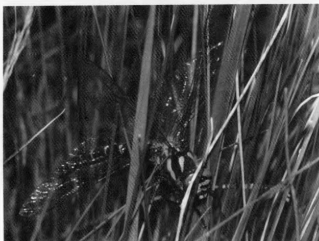
Abb. 1: Weibchen der Gestreiften Quelljungfer, in einem Horst des Kopfriets verfangen. Der linke Vorderflügel ist von einem Halm durchbohrt.

schaft der Kalksümpfe charakterisiert werden. Eine Unterschutzstellung als flächenhaftes Naturdenkmal ist beantragt.