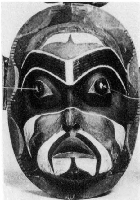
Schamanenmaske. Stamm der Kwakiutl. British-Kolumbien. Museum of the American Indian, Heye Foundation New York. Aus LOMMEL, A. Schamanen und Medizinmänner. Verlag georg D.W.Callwey, München 1965