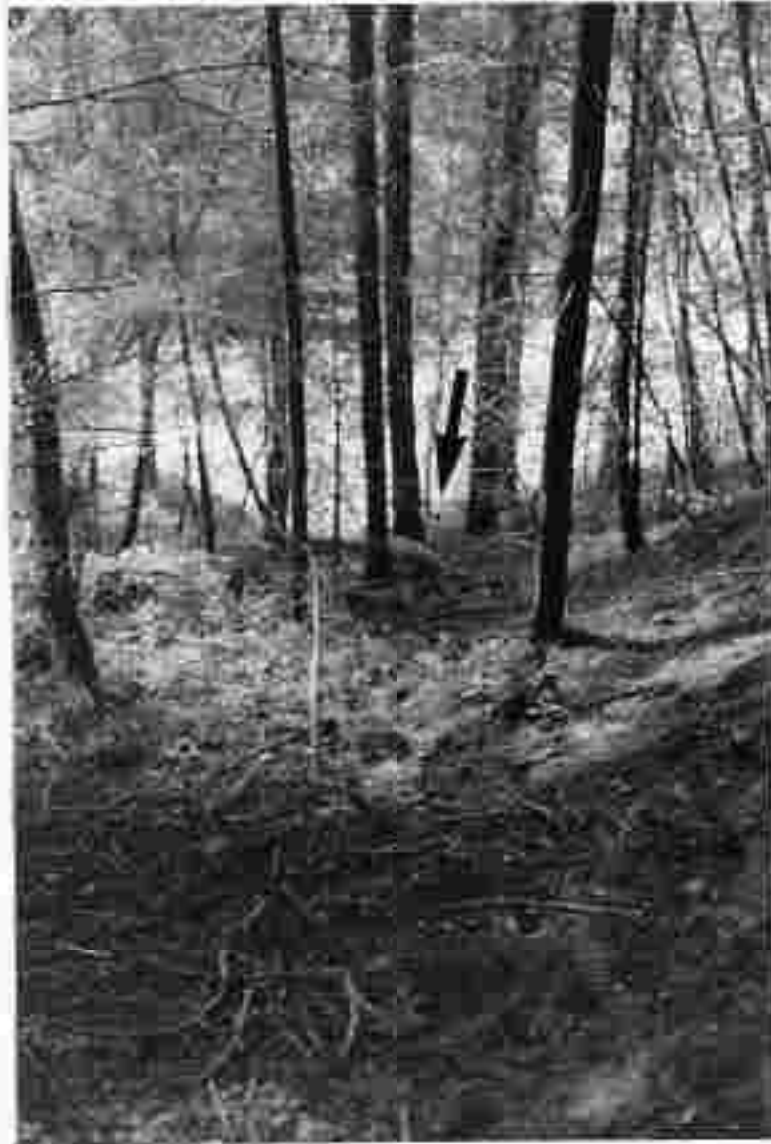
Abb. 2: Ansicht des unteren Teiles des rinnenartigen Grabens, in dem nach Angaben des Herrn Palmethofer der unfallgegenständliche Stein abgekollert ist. Etwa in Bildmitte ist ein ca. 100 kg schwerer Stein zu erkennen der nur durch einen Baum daran gehindert wurde auf die Straße zu kollern (Pfeil). Entfernung zur Landesstraße vom Standpunkt des Fotos ca. 40 m.

4. Der erwähnte Graben, durch den nach Angaben des Herrn Palmethofer der unfallgegenständliche Stein abgekollert ist, wurde in der Folge begangen. Dabei konnte festgestellt werden, daß einige Bäume in einer Höhe von etwa 30 - 40 cm über dem Boden Beschädigungen aufweisen, die offensichtlich von herabgekollerten Steinen herrühren.