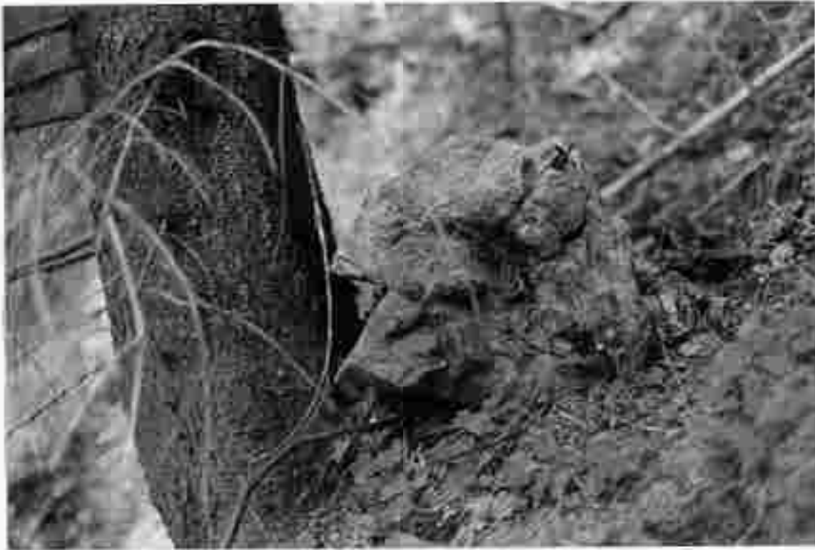
Abb. 3 Ein, an einem Baum angekletterter Stein im Bereich unmittelbar über der Ausweichung, Durchmesser des Baumstammes etwa 25 cm.