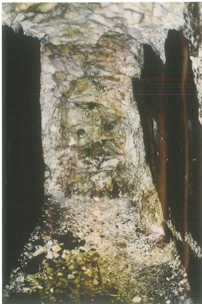
Abb.3: Gang II, West-Trum, Ortsbrust in Stollenansatz. Dunkel = Eklogit, weiß = Feldspat an den Salbändern, gelblich = Quarz.