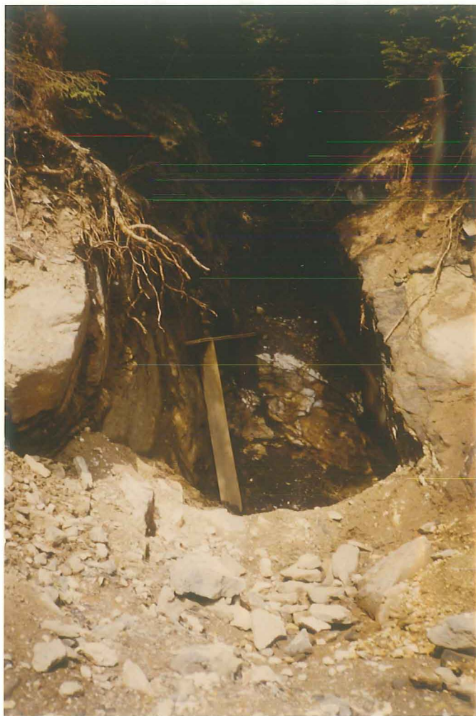
Abb.2: Gang I, etwa 6 m söhlig verhaut, die Ortsbrust steht in überwiegend trübem Quarz, an den Salbändern Feldspat.