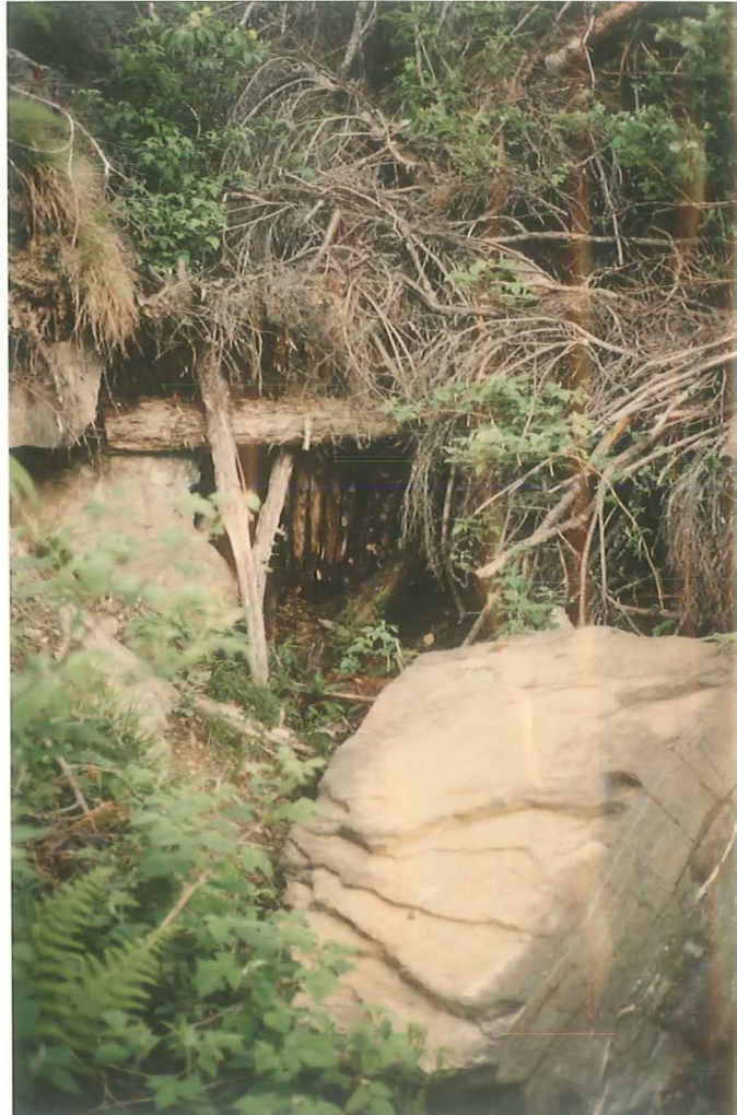
Abb. 5: Gang III, verbrochenes Stollen- mundloch.