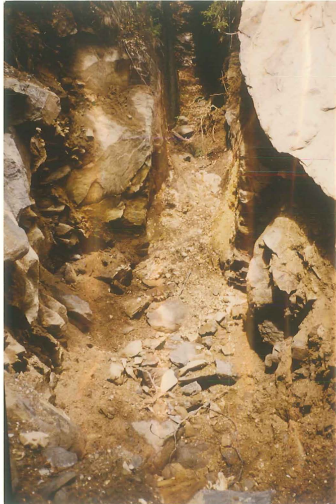
Abb. 4: Gang II, Ost-Trum, etwa 5-6 m söhlig verhaut.