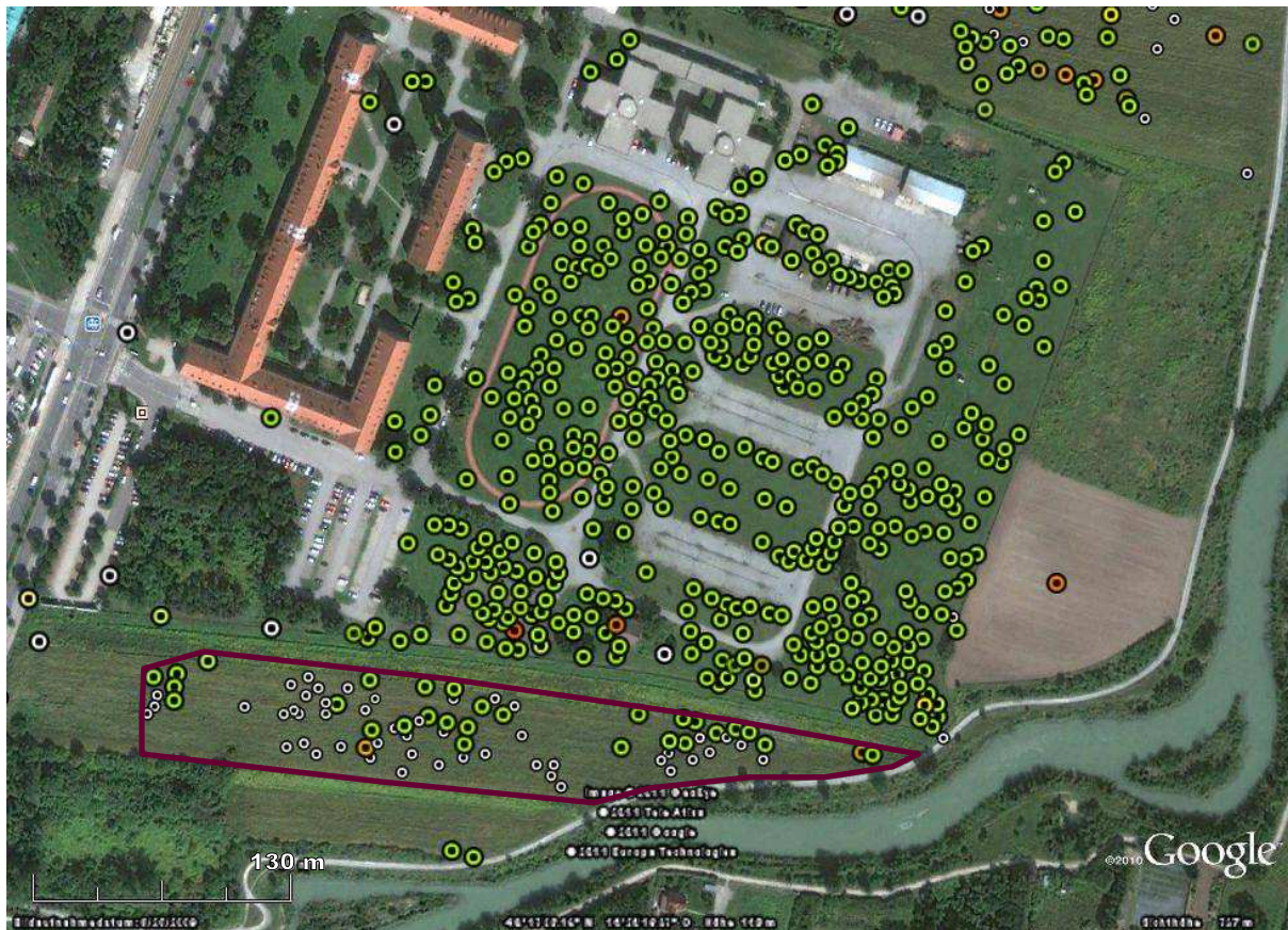
Abb. 2: Verbreitung von Zieseln und Hamstern im Untersuchungsgebiet im Gelände des Heeresspitals und seiner südöstlichen Umgebung. Symbolik siehe Abb. 1

Die Grünflächen erstrecken sich auf etwa 12 ha und beherbergen eine kopfstärke Zieselkolonie, die vermutlich seit 2006 angewachsen ist. Die durchschnittliche Populationsdichte von 37 Individuen/ha (51/ha incl. Jungtiere) ist mit Werten in den Stammersdorfer Weingärten vergleichbar (HOFFMANN et al. 2008) und ist somit als hoch, aber nicht als außergewöhnlich zu bezeichnen. Hamster sind nur vereinzelt in der Osthälfte vorhanden und hier fast ausnahmslos entlang der südlichen Grundstücksgrenze (Abb. 2). Mit dem Vorkommen beider Arten im Norden außerhalb des Heeresspital-Geländes besteht derzeit offensichtlich keine direkte Verbindung.