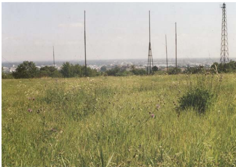
Abb. 1.2: Radiotelegrafische Station Radio Austria, NW-Bereich, Blick nach SO.

Die Radiotelegrafische Station (Abb. 1.2) ist im W und N von Einfamilienhäusern umgeben, im O und S befinden sich Weingärten. Auf 8 Transekten wurden insgesamt 12 Bauingänge erfasst (Tab. 1.1). Diese waren aber nicht gleichmäßig verteilt, sondern in der W-Hälfte gehäufte (2,3/Transekt) als in der O-Hälfte (0,8/Transekt). Auch die Individuendichte dürfte unterschiedlich sein, da im W-Teil 2, im O-Teil nur 1 Ziesel beobachtet wurde. In jedem Fall ist die Populationsdichte sehr niedrig (Tab. 1.1), entspricht aber durchaus natürlichen Verhältnissen (z.B.