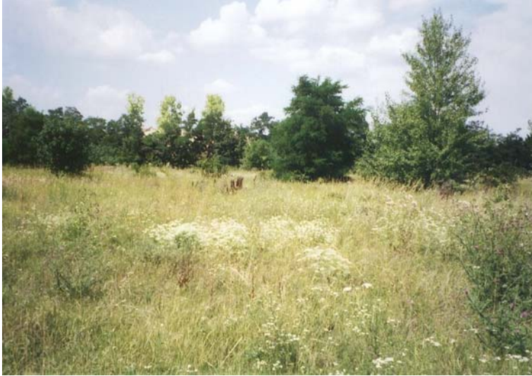
Abb. 1.4: Potenzielles Zieselhabitat Alte Schanzen (Fläche 40.05): Mäßig verbuschter Rasen mit trockenem Charakter. Es konnten Hamster nachgewiesen werden, jedoch keine Ziesel.