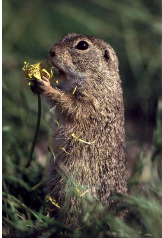
Abb. 1.1: Ausgewachsenes Ziesel in natürlichem Habitat (Perchtoldsdorfer Heide).