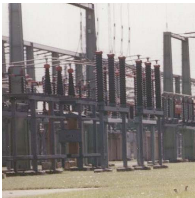
Abb. 1.3: Umspannwerk Südost/Johannesberg, NW-Bereich. Im Vordergrund rechts sind 2 Ziesel zu sehen.

Das Umspannwerk Südost (Abb. 1.3) ist im N, O, S und W von Agrarflächen umgeben, die durch Feldwege und Windgürtel strukturiert sind. Das Areal selbst ist ein typisches Beispiel für einen stark anthropogen beeinflussten Lebensraum: Solche Flächen werden nicht besiedelt, weil sie für Ziesel optimale Habitate darstellen, sondern Rückzugsgebiete (vgl. Spitzenberger und Bauer 2002), in diesem Fall vermutlich aus durch Ackerbau zerstörten Bereichen. Das Umspannwerk stellt nicht nur in dieser Hinsicht das andere Extrem zur Radiotelegrafischen Station dar (Tab. 1.1): Die Fläche an verfügbarem Habitat ist 4mal so groß, die Zahl der Baueingänge fast 10fach, die Individuendichte 17fach und der Frühlingsbestand - entsprechend der größeren Fläche und höheren Dichte - fast 30fach. Mit dieser Populationsgröße sollte ein nachhaltiger Bestand gewährleistet sein. Die geplante Südumfahrung (B301) stellt allerdings ein wesentliches Gefährdungspotenzial dar. Ihre Trasse wird durch den an den Stadtrand grenzenden Teil des Areals führen und überdies das Vorkommen von möglichen Beständen in Niederösterreich isolieren.