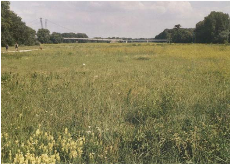
Abb. 1.5: Potenzielles Zieselhabitat Albern (Fläche 13.05): Fettwiese mit wechselfeuchtem Charakter. Es konnten weder Ziesel noch Hamster nachgewiesen werden.