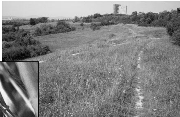
Kleine Beißschrecke Platycleis vittata am Wiener Berg, 26.8.2002