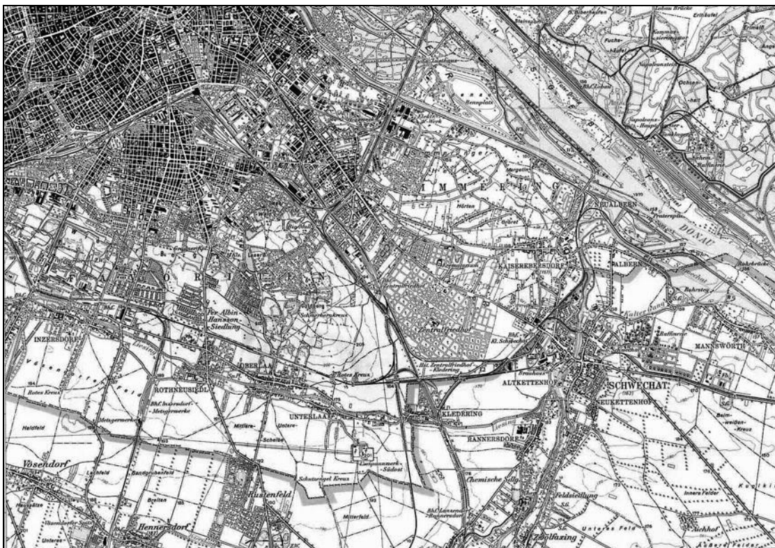
Abbildung 1: Favoriten und Simmering im Kartenbild (ÖK 1:50.000, nicht maßstabsgetreu) Stand 1961.

Ein anschauliches Bild über die massiven Veränderungen im Gebiet kann man sich mit dem Vergleich der beiden Karten vom Stand 1961 bzw. 1993 machen (Abb. 1 & 2).