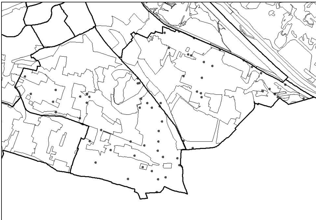
Abbildung 3: Lage der untersuchten Probeflächen in Favoriten und Simmering im Jahr 2002.

Insgesamt wurden 135 Stunden für die Freiland-Arbeit aufgewendet, was etwa zwei Stunden pro Probefläche entspricht.