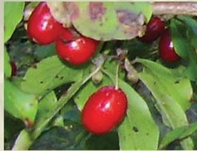
Dirndlstrauch, Kornelkirsche Cornus mas ↑ 3(-8) m, ☀ III gelb, 🍒 ☺, 🐝 ✂️