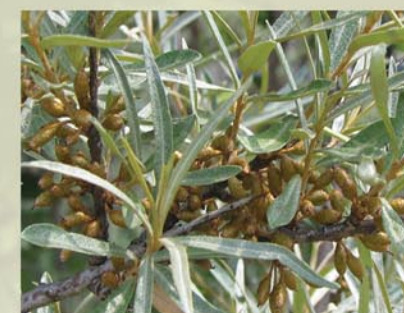
Sanddorn Hippophae rhamnoides ↑ 1-5 m, ☀ IV gelb, 🍒 ☺, 🐝 ✂️ graues Laub, orange Früchte, 2-häusig

↑ Wuchshöhe ☀ Blütezeit | - XII Monate 🍒 Früchte ☺ essbar 🐝 Bienenweide ✂️ Schnitthecke 🐝 Vogelgehölz