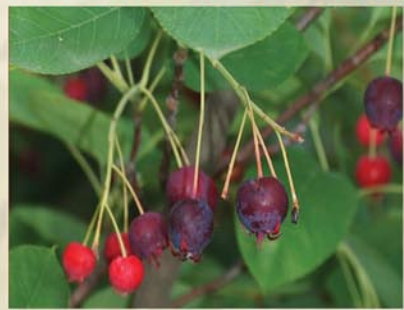
Felsenbirne Amelanchier ovalis ↑ 2-3m, ☀ IV-V weiß, 🍒 ☺, 🐝