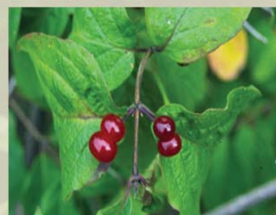
Rote Heckenkirsche Lonicera xylosteum ↑ 1 - 2,5 m, ☀ V gelb-weiß-duftend, 🍒 †, 🐝