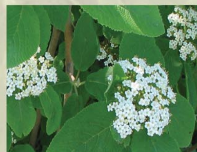
Wolliger Schneeball Viburnum lantana ↑ 2-5 m, ☀ V weiß, 🍒 leicht †, 🐝 ✂️ schöne Blüte, Herbstfärbung, rote und schwarze Früchte