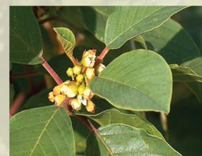
Faulbaum Frangula alnus ↑ 1,5 - 3m (-7) m, ☀ V-VIII weiß, 🍒 †, 🐝