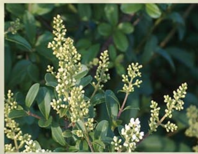
Liguster, Rainweide Ligustrum vulgare ↑ 2-5m, wintergrün, ☀ VI-VII weiß, 🍒 †