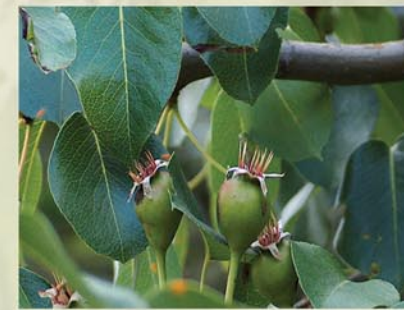
Holzbirne Pyrus pyraster ↑ 3-(15) m, ☀ IV-V weiß, 🍒 ☺, 🐝 ✂️