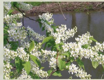
Gewöhnliche Traubkirsche Prunus padus ↑ 2-3(10)m, ☀ V weiß, 🍒 ☺, 🐝 ✂️