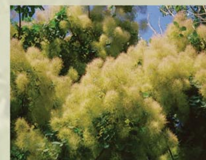
Perückenstrauch Cotinus coggygria ↑ 3-5 m, ☀ V-VI gelb, schöne Frucht, rötliche Herbstfärbung