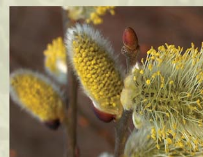
Salweide, Palmkätzchen Salix caprea ↑ 2(-10) m, ☀ III-IV gelb, 🐝 ✂️