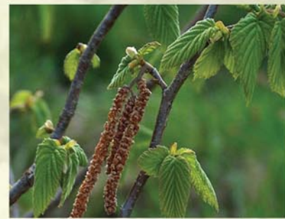
Haselnuss Corylus avellana ↑ 2(-6) m, ☀ III gelb (rot), 🍒 ☺, 🐝 ✂️