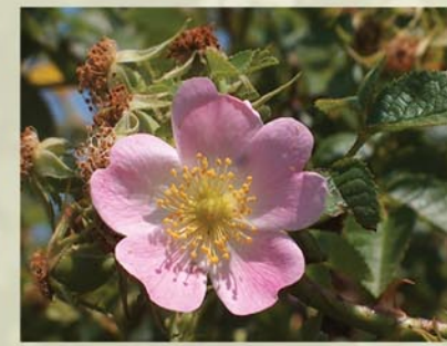
Weinrose, Apfelrose Rosa rubiginosa ↑ 1-2m, ☀ VI-VII rosa, 🍒 ☺, 🐝 ✂️