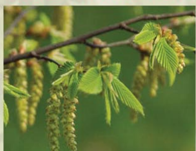
Hainbuche Carpinus betulus ↑ 1(-10) m, ☀ V gelbgrün, 🐝 ✂️