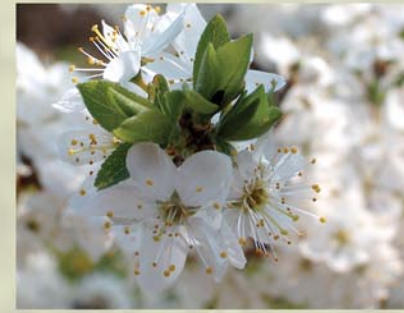
Schlehdorn, Schwarzdorn Prunus spinosa ↑ 1-3m, ☀ IV weiß, 🍒 ☺, 🐝 ✂️