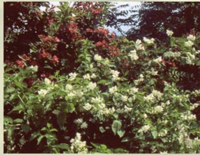
Pfeifenstrauch, Falscher Jasmin Philadelphus europaeus ↑ 1,5-3m, ☀ V-VI weiß, duftend 🐝