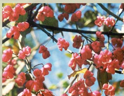
Pfaffenkaperl, Spindelstrauch Euonymus europaea ↑ 1,5 (-4) m, ☀ V gelb-grün, schöne 🍒 † † †, 🐝 ✂️ schöne Herbstfärbung