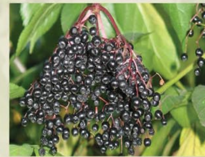
Schwarzer Holler Sambucus nigra ↑ 2-7 (15) m, ☀ V weiß, 🍒 ☺, 🐝