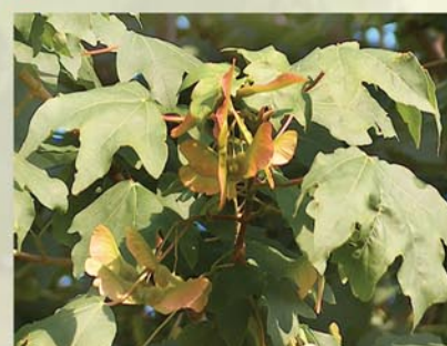
Feldahorn Acer campestre ↑ 2(-8) m, ☀ IV-V gelb, 🐝 ✂️