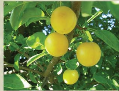
Kriecherl Prunus domestica ssp. insititia ↑ 3-5 (-10) m, ☀ IV-V weiß, 🍒 ☺, 🐝 ✂️