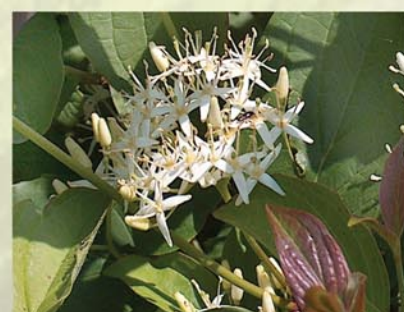
Roter Hartriegel Cornus sanguinea ↑ 2-5 m, ☀ V-VI weiß, 🍒 †, 🐝 ✂️