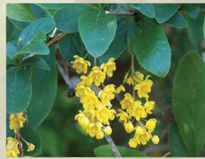
Gewöhnliche Berberitze Berberis vulgaris ↑ 1-3m, ☀ V gelb, 🍒 ☺, 🐝 ✂️