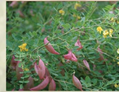
Gewöhnlicher Blasenstrauch Colutea arborescens ↑ 2-3m, ☀ V-VII gelb, 🍒 †, 🐝