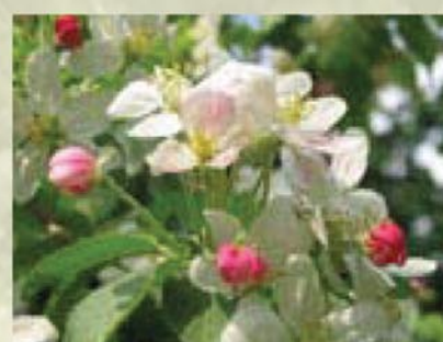
Holzapfel Malus sylvestris ↑ 3(-10) m, ☀ IV-V rosa-weiß, 🍒 ☺, 🐝 ✂️