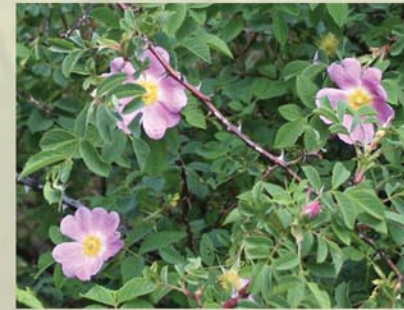
Hundsrose Rosa canina ↑ 1-3 m, ☀ VI-VIII rosa, 🍒 ☺, 🐝 ✂️