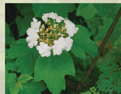
Gewöhnlicher Schneeball Viburnum opulus ↑ 2 (-4) m, ☀ V weiß, 🍒 leicht †, 🐝 ✂️ schöne Blüte, rötliches Herbstlaub, leuchtend rote Früchte