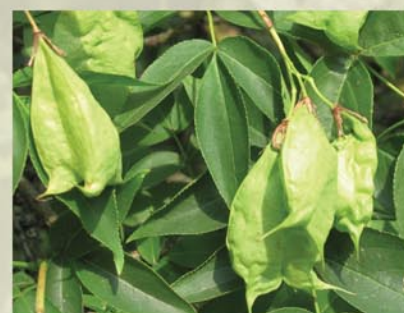
Pimpernuss Staphylea pinnata ↑ 2-5 m, ☀ V-VI weiß, schöne Blüte, blasenartige Früchte, 🐝