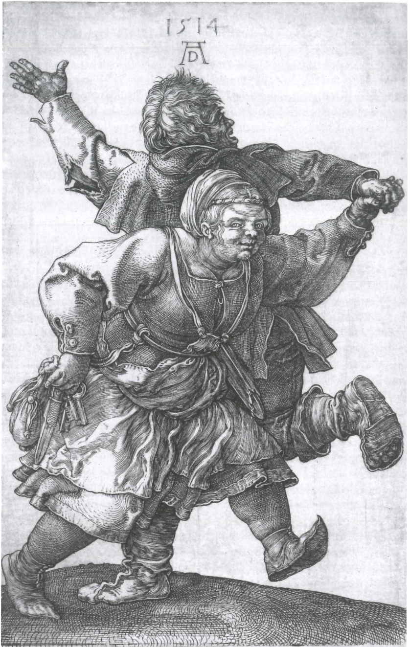
Abb. 3: Das tanzende Bauernpaar, Albrecht Dürer 1514 (Kupferstich-Kabinett, Staatliche Kunstsammlung Dresden).