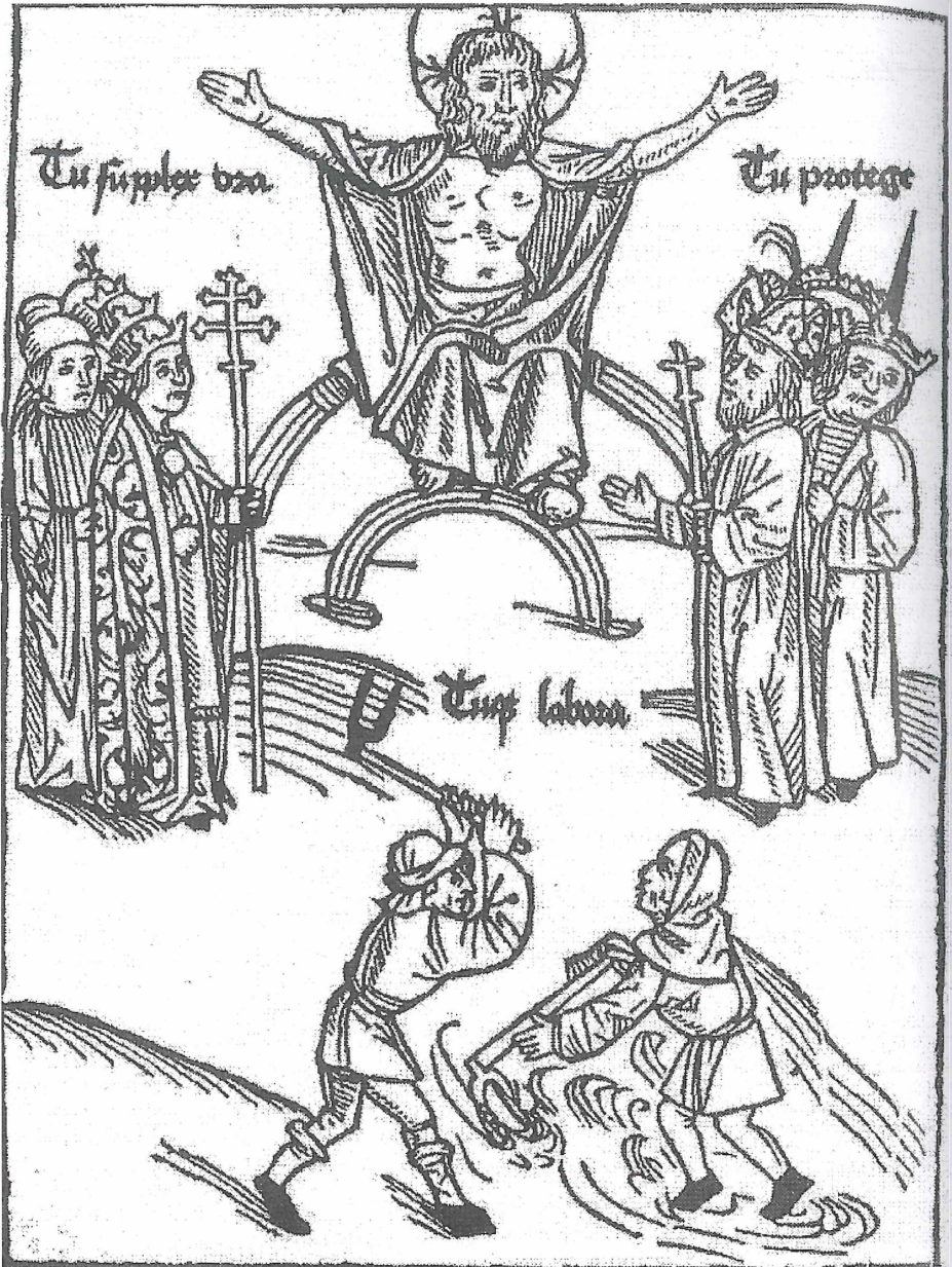
Abb. 1: Darstellung der mittelalterlichen Drei-Stände-Ordnung, in der Jesus Christus den drei Ständen ihre Aufgabe zuweist: Links oben der Klerus ( Tu supplex ora – du bete demütig), rechts der Adel ( Tu protege – du beschütze) und unten die Bauern bei der Feldarbeit ( Tuque labora – und du arbeite) (Holzschnitt aus der „ Prognosticatio in latino “ des Johannes Lichtenberger, gedruckt 1492 in Mainz)