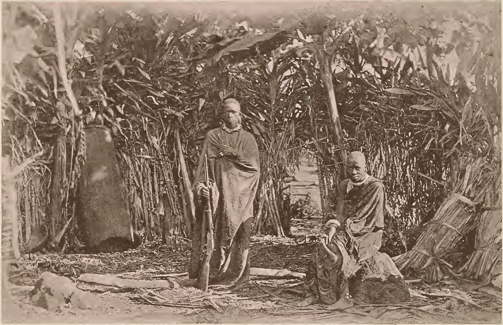
23. MAREALE MIT HAUPTFRAU.