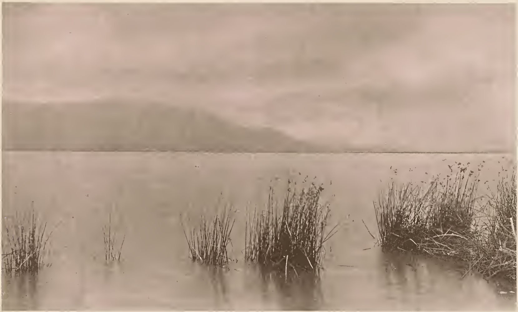
27. BLICK VOM OSTUFER DES DSCHIBE-SEES AUF DEN SEE UND DAS UGUENOGEbirGE.