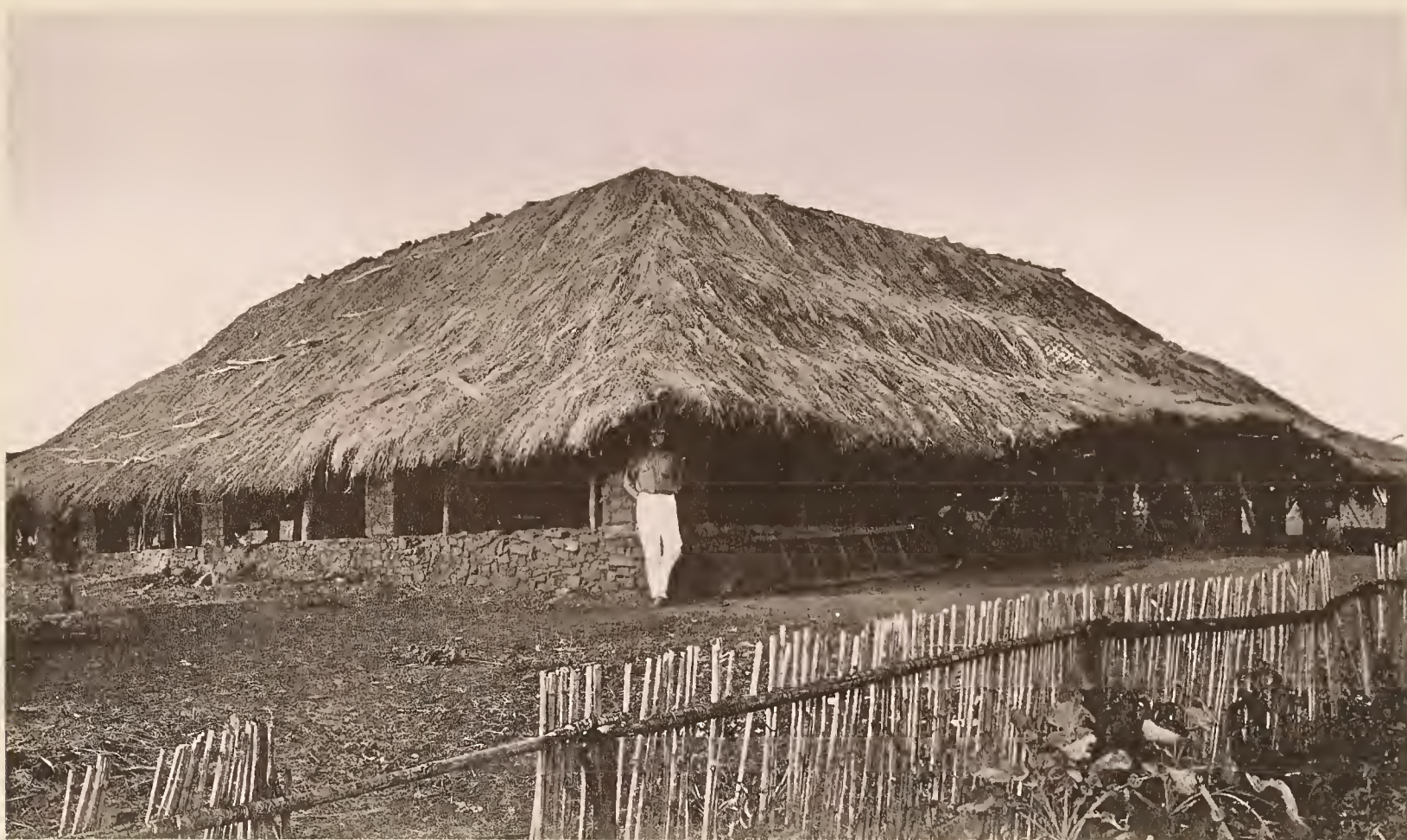
32. DIE STATION KOROGWE DER D.-O.-A. GESELLSCHAFT, SEITENANSICHT DES HAUPTGEBÄUDES.