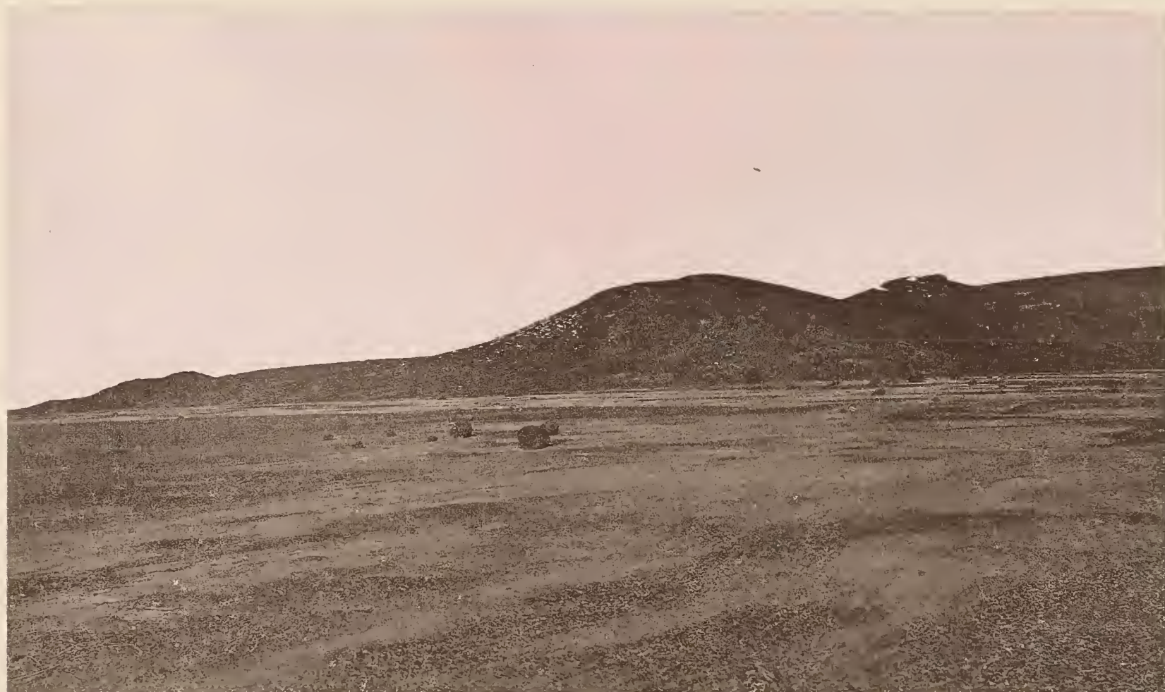
Anschluß an obenstehendes Bild.