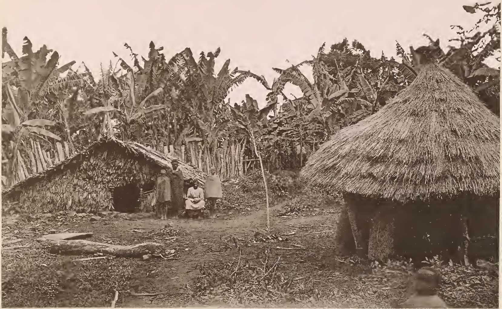
16. VORRATSHÜTTEN IN MARANGU.