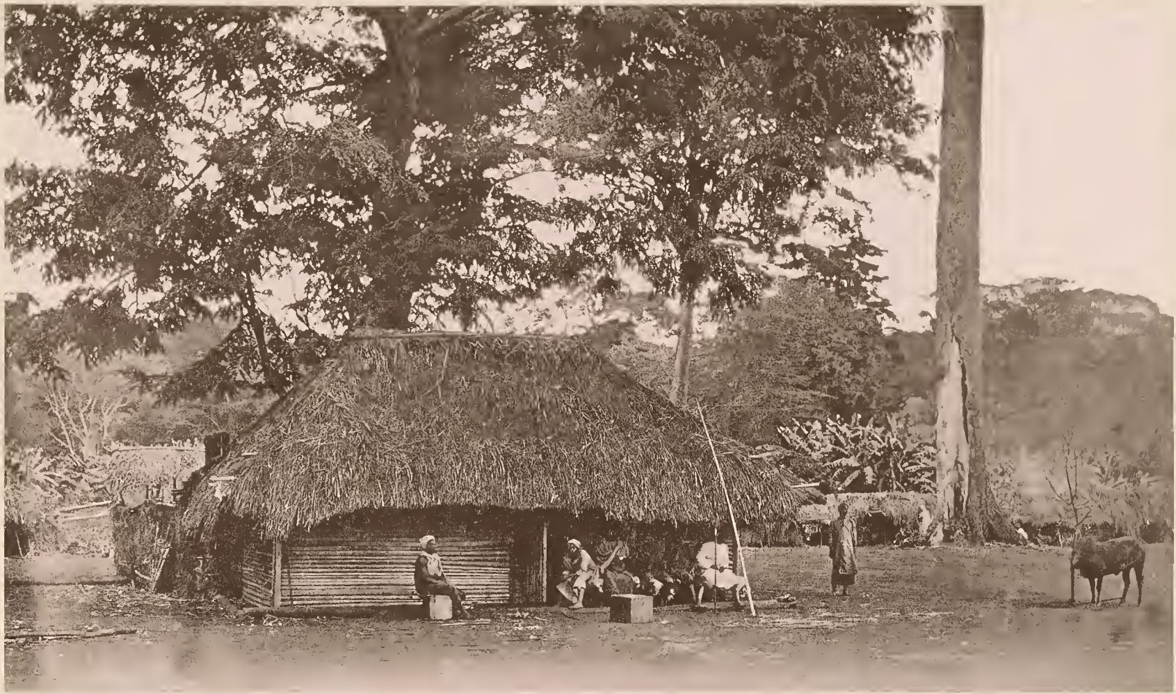
1. DAS ENGLISCHE LAGER IN TAWETA.