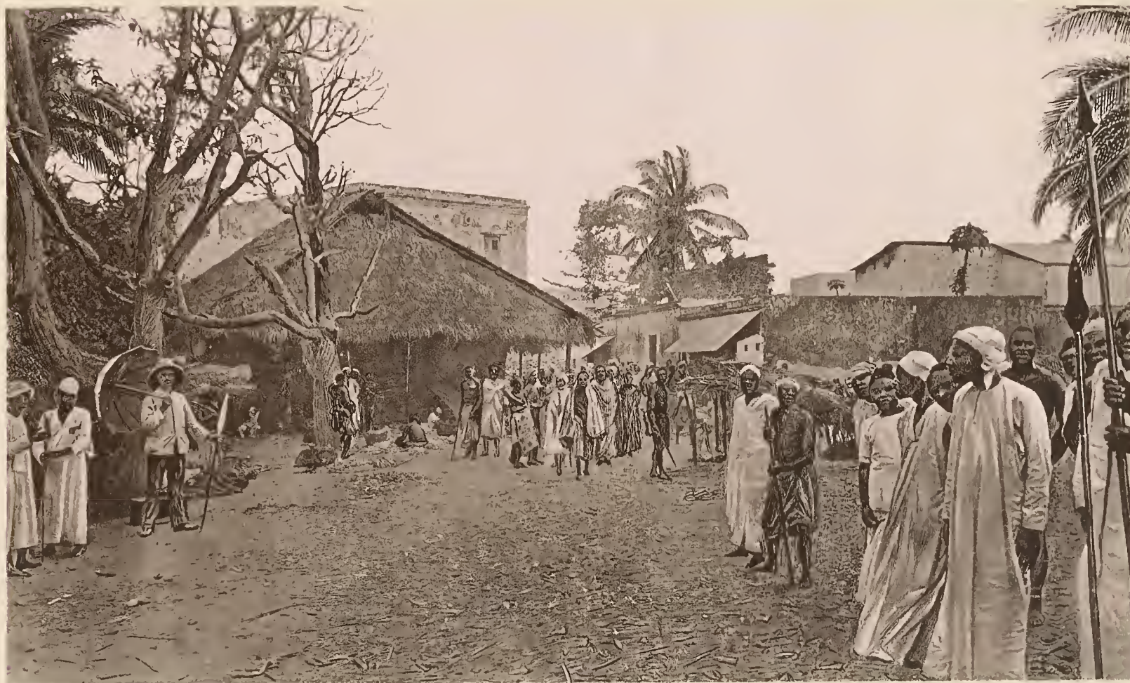
40. EINE STRASSE IN BAGAMOYO.