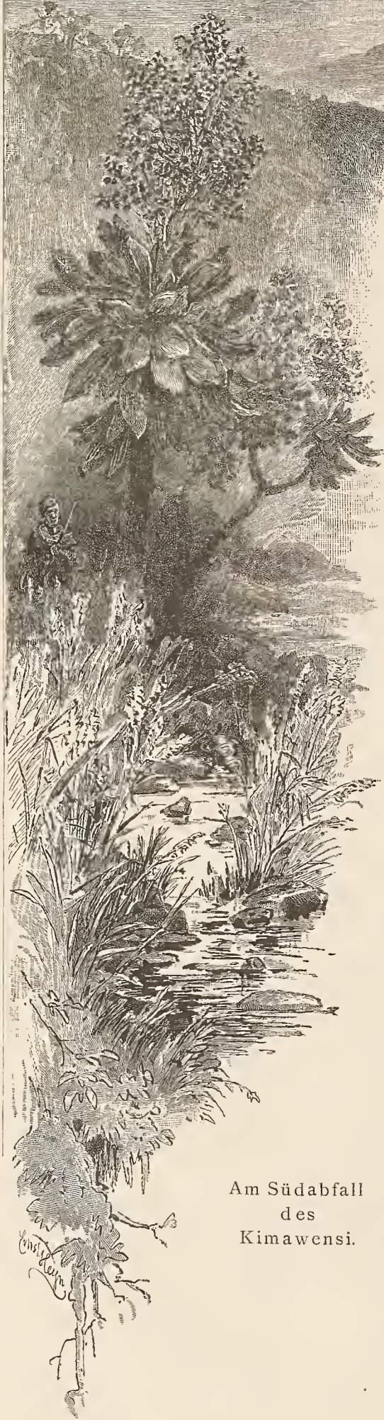
Am Südabfall des Kimawensi.

Trotz der starken Anzweiflung, welche Rebmanns und Krapfs Berichte besonders durch den englischen Pedanten Desborough Cooley erfuhren, ward doch ein Jahrzehnt später die Richtigkeit ihrer Ent-