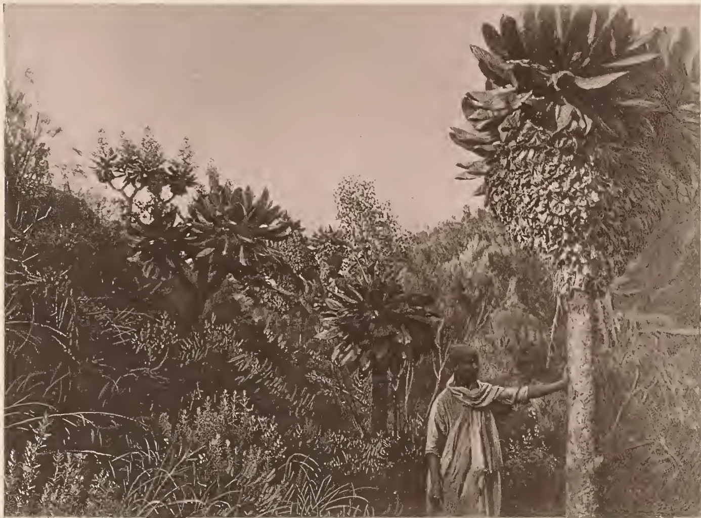
6. EINE GRUPPE VON „SENECIO JOHNSTONI“ AM OBERN KILIMANDSCHARO (2800 m).