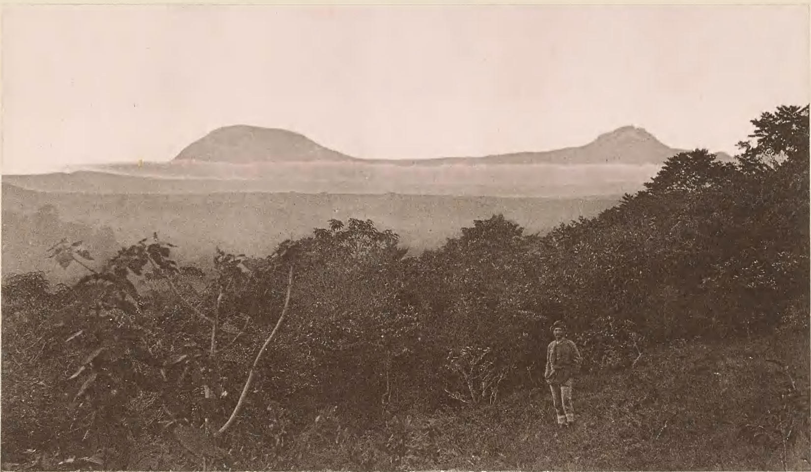
4. DER KILIMANDSCHARO; VON MARANGU AUS SO. GESEHEN.