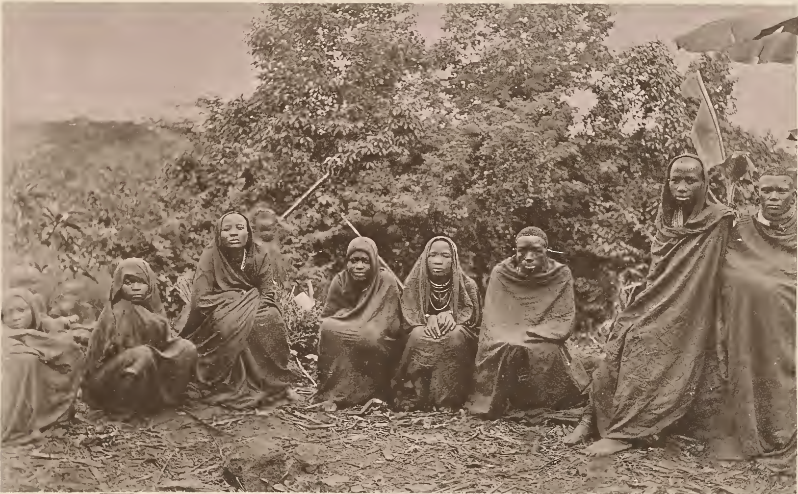
24. MAREALE MIT SEINEN FRAUEN.