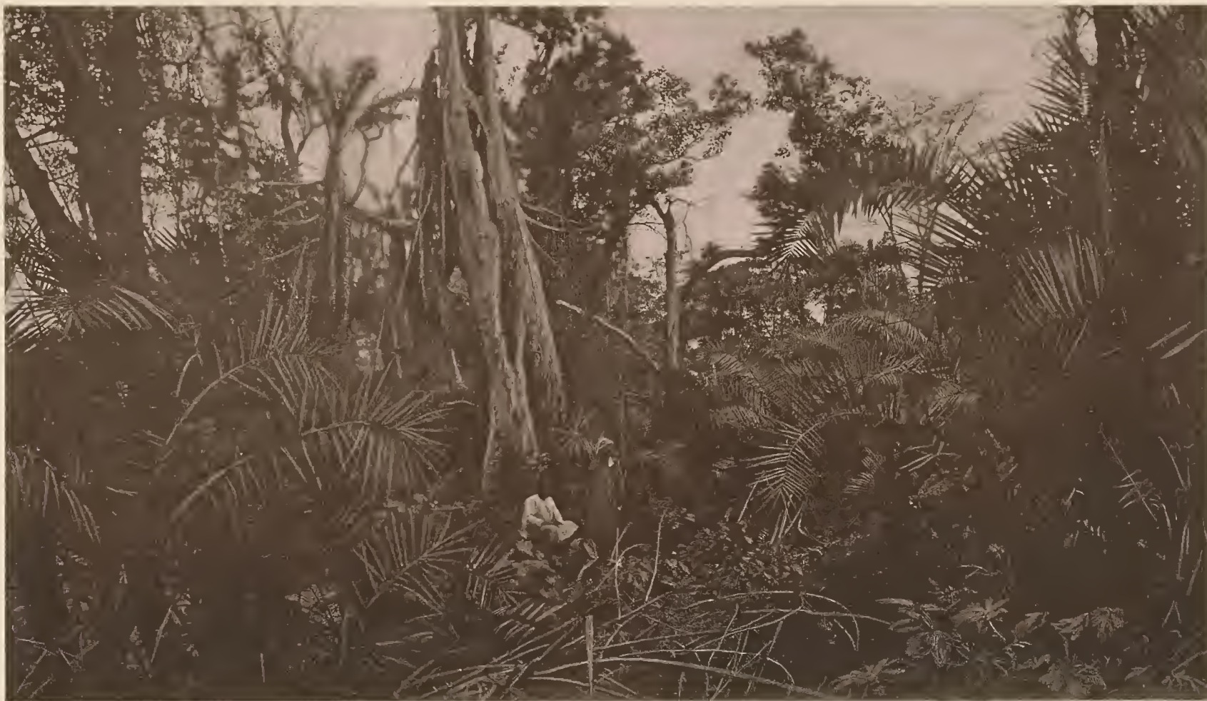
2. URWALD VON TAWETA.