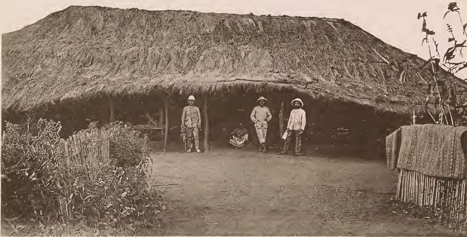
31. DIE STATION KOROGWE DER D.-O.-A. GESELLSCHAFT, VORDERANSICHT DES HAUPTGEBÄUDES.