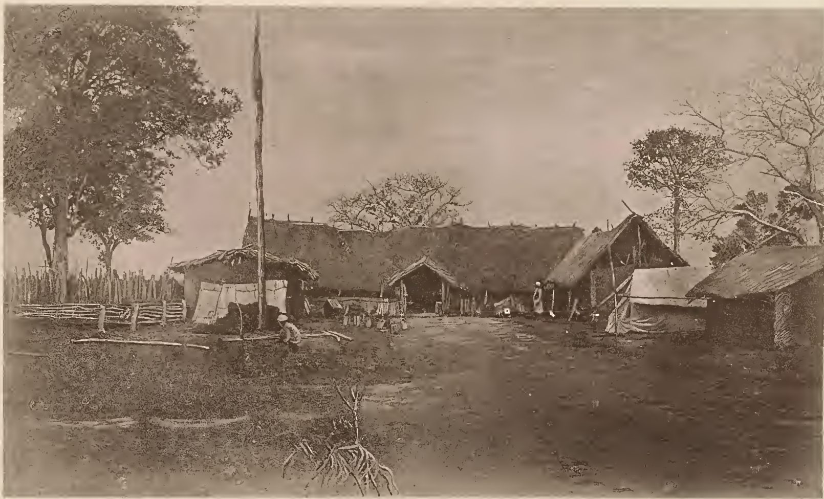
39. DIE KINGANI-STATION USUNGULA DER D.-O.-A. GESELLSCHAFT.