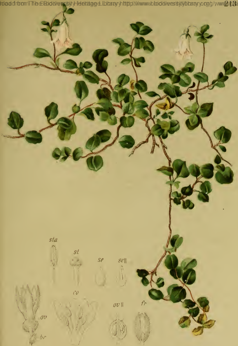
Linnaea borealis L. — Nordische Linnäe, Erdkrönchen. Schweiz bis Kärnten, Gebüsch, bis 1800 M. Juli, August.