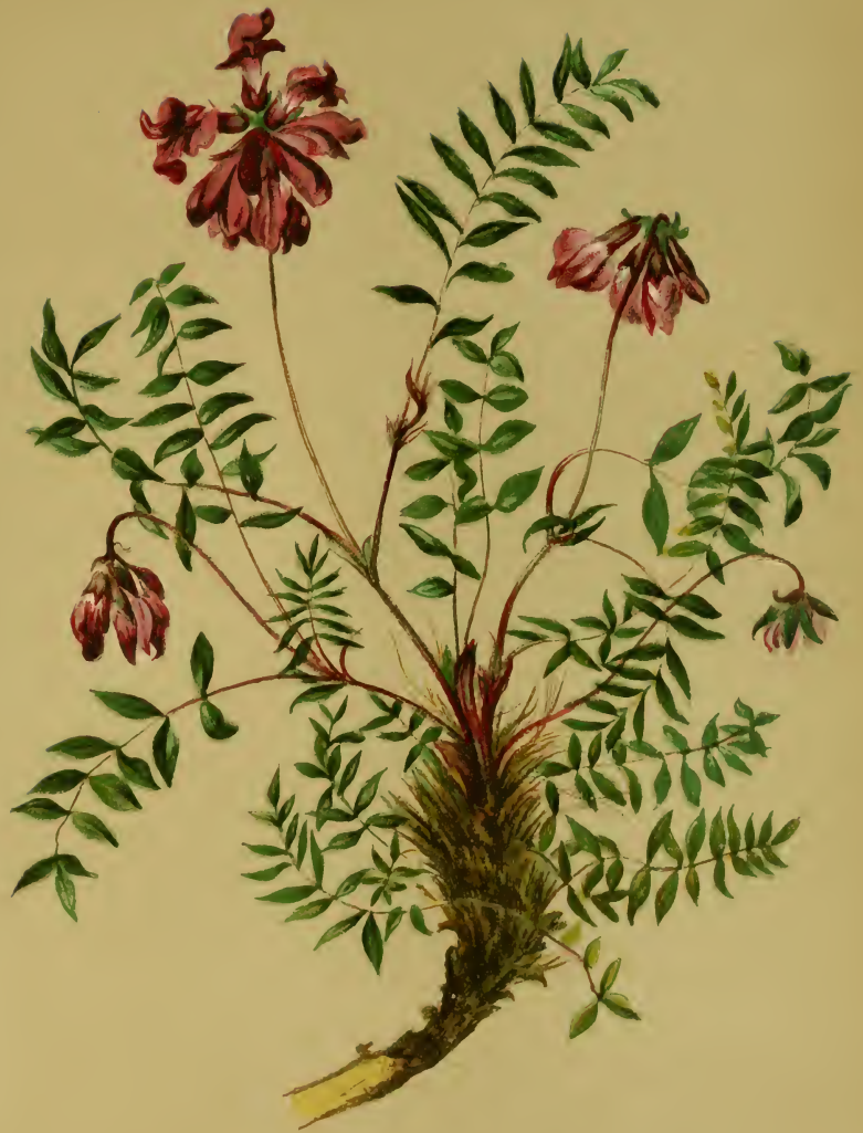
Oxytropis Jacquini Bunge = montana Jacq. — Jacquins Spitzkiel. Alpenkette, trockene Stellen, 1600—2200 M. bes. auf Kalk, Juli, August.