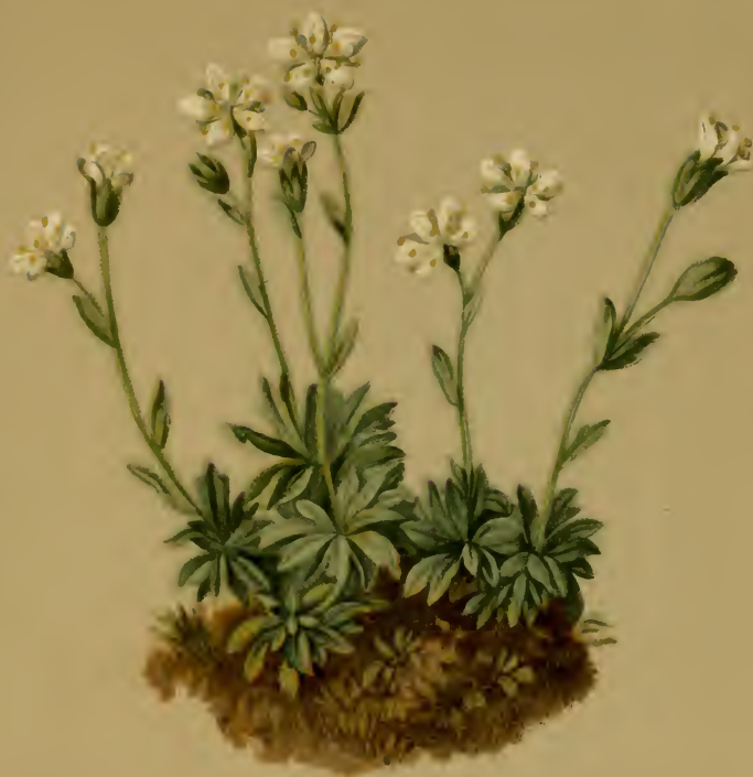
Saxifraga androsacca L. — Mannschildartiger Steinbrech. Alpenkette, feuchte Stellen, 1800–3200 M., Juni, Juli.