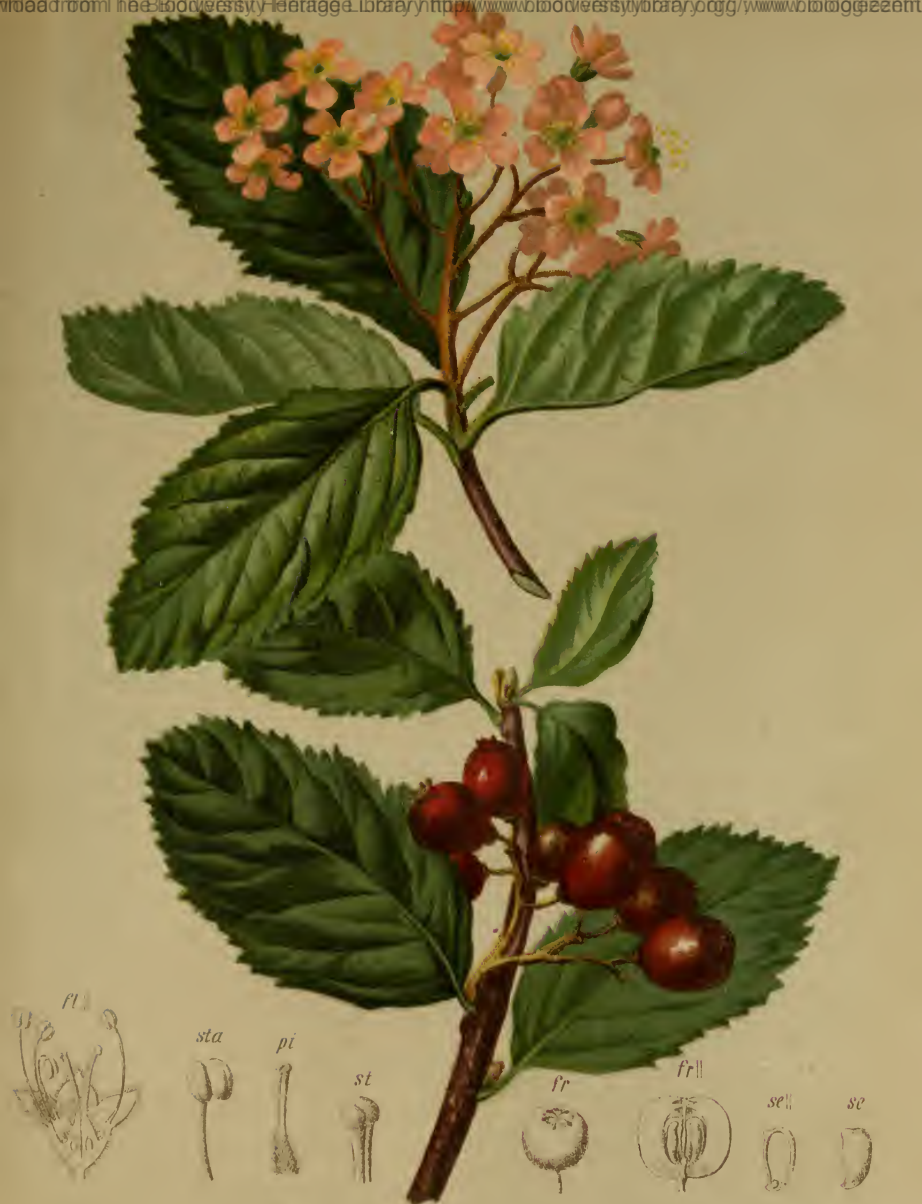
Sorbus Chamaemespilus (L.) Crntz. — Zwerg-Vogelbeere. Alpenkette, Gebüsch, 1500—1800 M. auf Kalk. Juni—Juli.