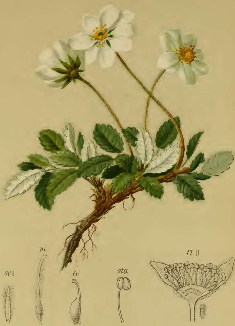
Dryas octopetala L. — Achtblättrige Dryade, Silberwurz.

Alpenkette, trockene Stellen, 1300–2200 M. auf Kalk, Juni–August,