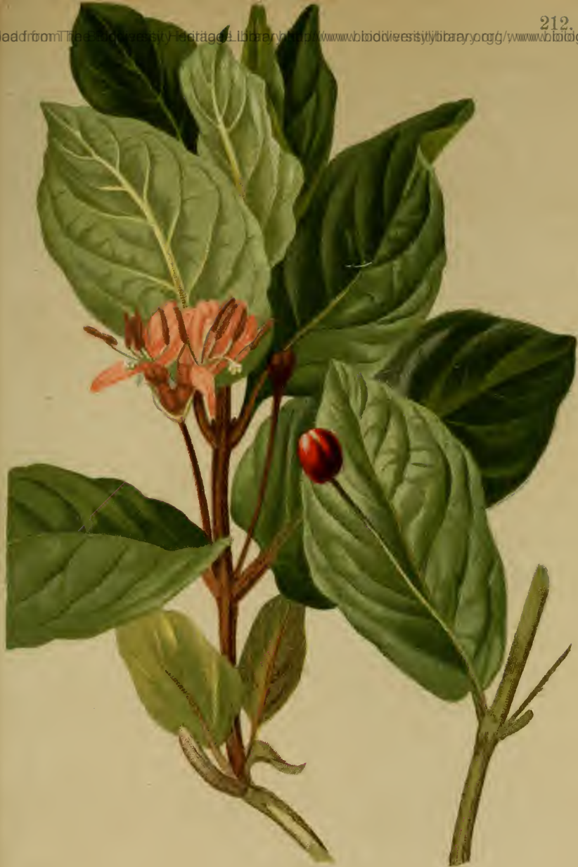
Lonicera alpigena L. — Alpen-Lonizere, Heckenkirsche. Alpenkette, Gebüsch, bis 1600 M., bes. auf Kalk, Mai, Juni.