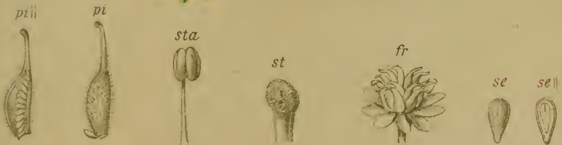
Sempervivum montanum L. — Berg-Hauswurz.

Alpenkette, trockene Stellen, 1300—2100 M. Juli, August