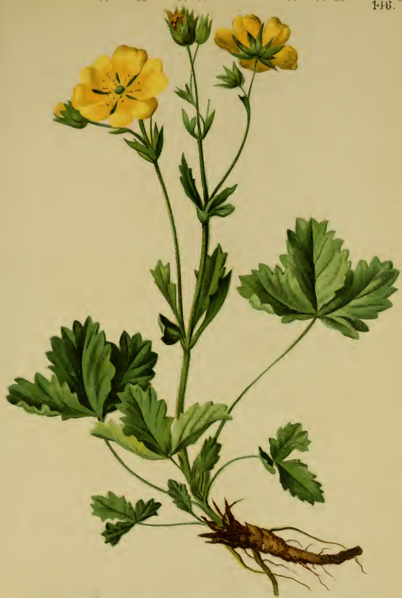
Potentilla grandiflora L. — Grossblüthiges Fingerkraut. Schweiz bis Krain, trockene Stellen, über 1600 Meter. Juli-August.