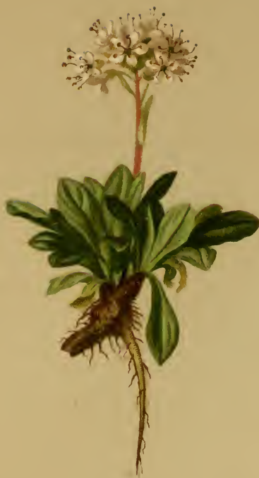
Valeriana salianca All. — Weidenblättriger Baldrian.

Westl. Schweiz und Tirol, trockene Stellen, 1900—2800 M., auf Urgestein, Juli, August.