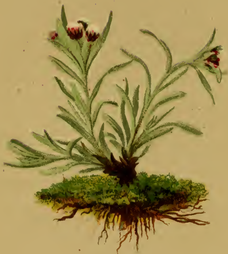
Gnaphalium supinum L. — Niedriges Ruhrkraut

Alpenkette, auf Gerolle, 1580–2300 M. Juni–August.