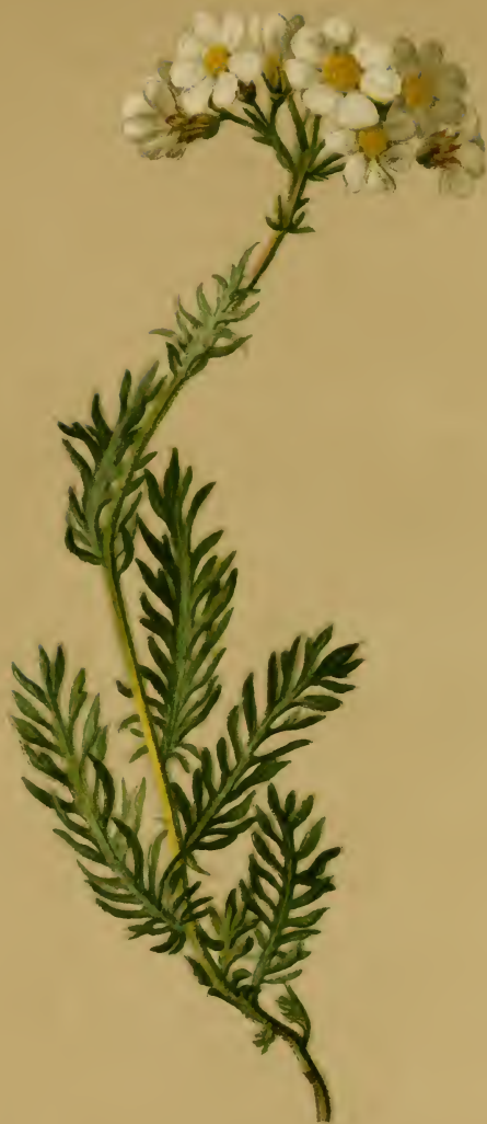
Achillea moschata L. — Bisam-Schafgarbe.

Schweiz bis Steiermark, trockene Stellen, 1900—2200 M., auf Urgestein, Juli, August.