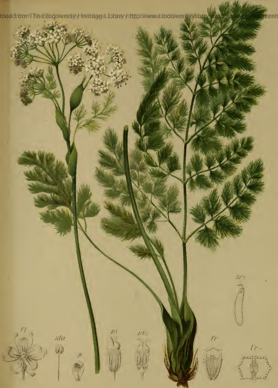
Meum athamanticum Jacq. — Augenwurzartige Bärwurz. Alpenkette, besonders östl. Alpen, Wiesen, 1000–2100 M. auf Kalk, Juli-August.