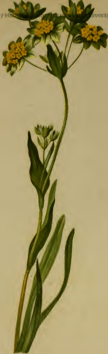
Bupleurum ranunculoides L. — Hahnenfussartiges Hasenohr. Schweiz, Tirol und Krain, trockene Stellen, 1500–2200 M., Juli, August,