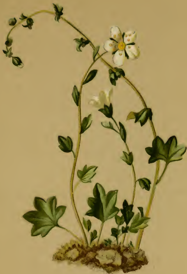
Saxifraga cernua L. — Nickender Steinbrech. Schweiz bis Steiermark, feuchte Stellen, 1300—1800 M., Juli, August.