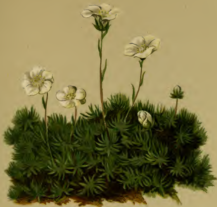
Saxifraga burseriana L. — Burser's Steinbrech.

Alpenkette, auf Kalk und Dolomit, 1900—2400 M. Juni, Juli.