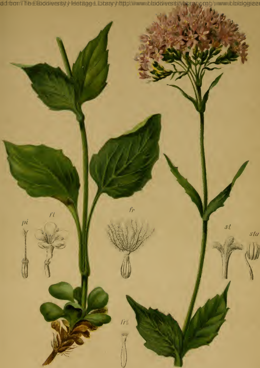
Valeriana montana L. — Berg-Baldrian. Alpenkette. feuchte Stellen, 1000—1800 M., Juni—August.