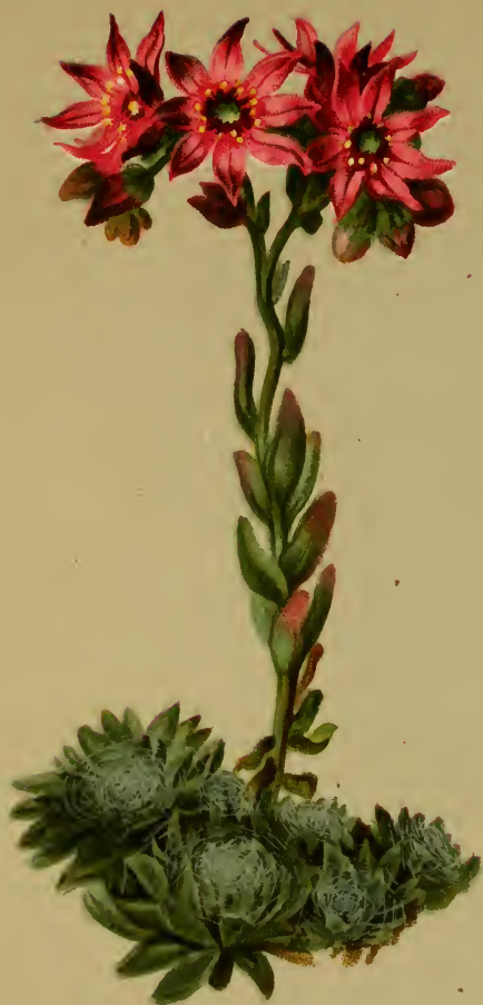
Sempervivum arachnoideum L. — Spinnwebige Hauswurz.

Schweiz bis Steiermark, trockene Stellen, 1300—2000 M. Juli, August.