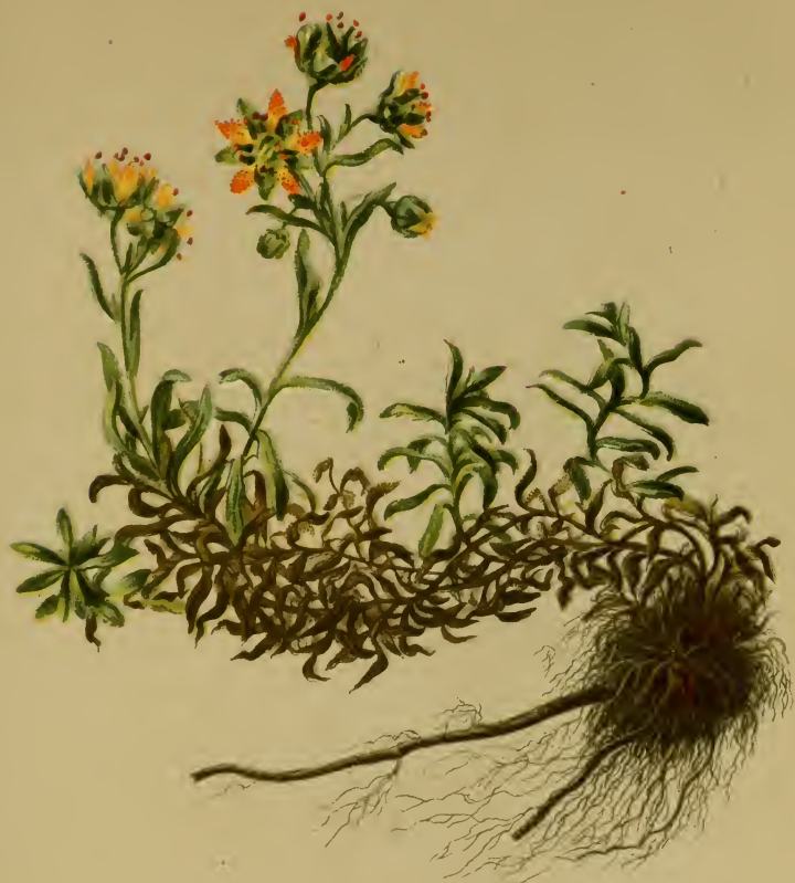
Saxifraga aizoides L. — Immergrüner Steinbrech.

Alpenkette, feuchte Stellen, 1000–2000 M. Juni–August.