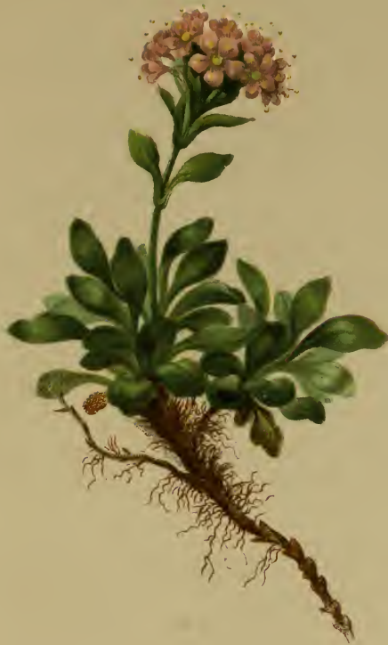
Valeriana supina L. — Niedriger Baldrian.

Schweiz bis Steiermark, feuchte Stellen, 1900–2600 M., bes. a. Kalk, Juli–August.