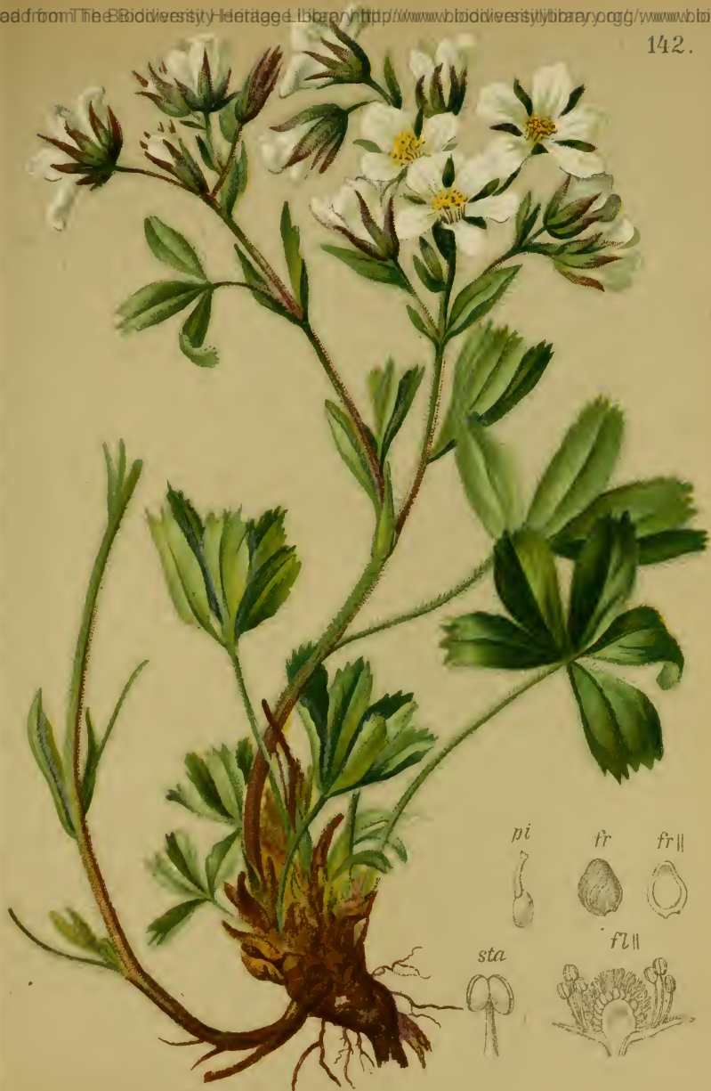
Potentilla caulescens L. — Vielstängeliges Fingerkraut.

Alpenkette, trockene Stellen, bis 1600 M. auf Kalk, Juni, Juli.