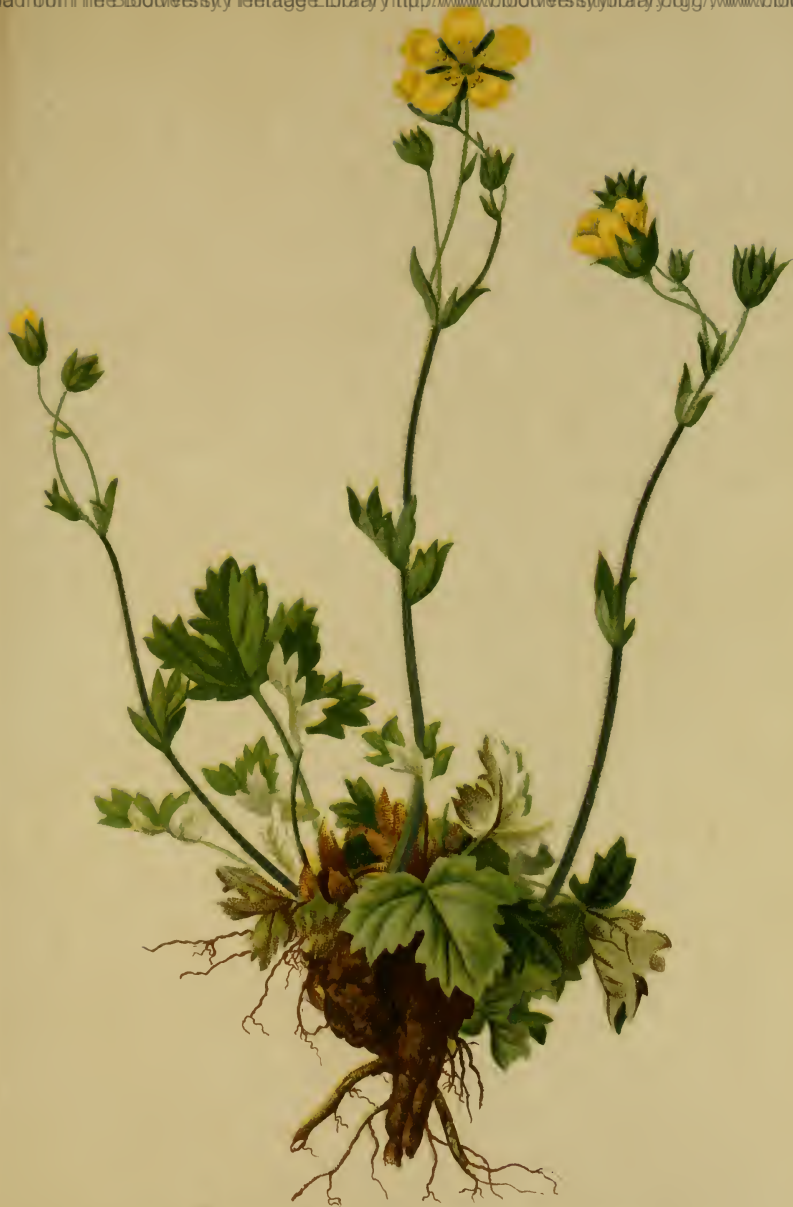
Potentilla nivea L. — Schneeweisses Fingerkraut.

Schweiz, Tirol und Salzburg, trockene Stellen, 1900—2200 M., auf Schiefergestein, Juli, August.