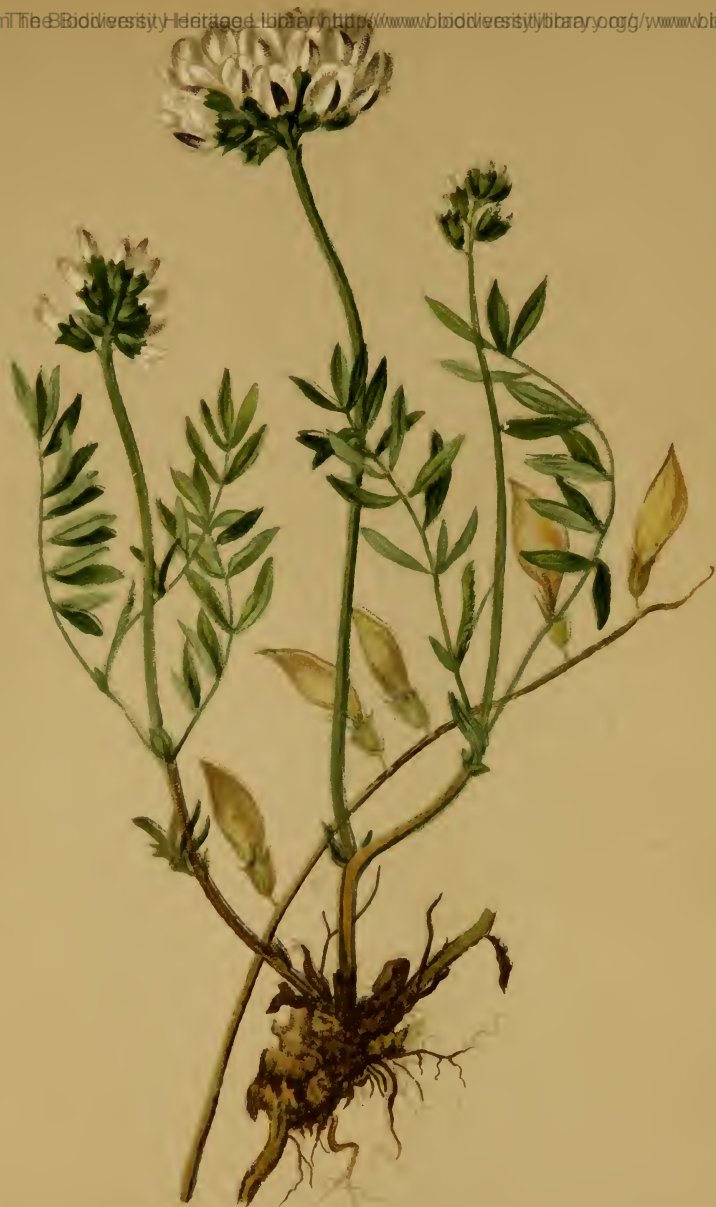
Astragalus australis (L.) Peterm. = Phaca australis L. Koch. — Südlicher Tragant.

Schweiz bis Salzburg und Kärnten, trockene Stellen, 1700–2300 M., Juli, August.