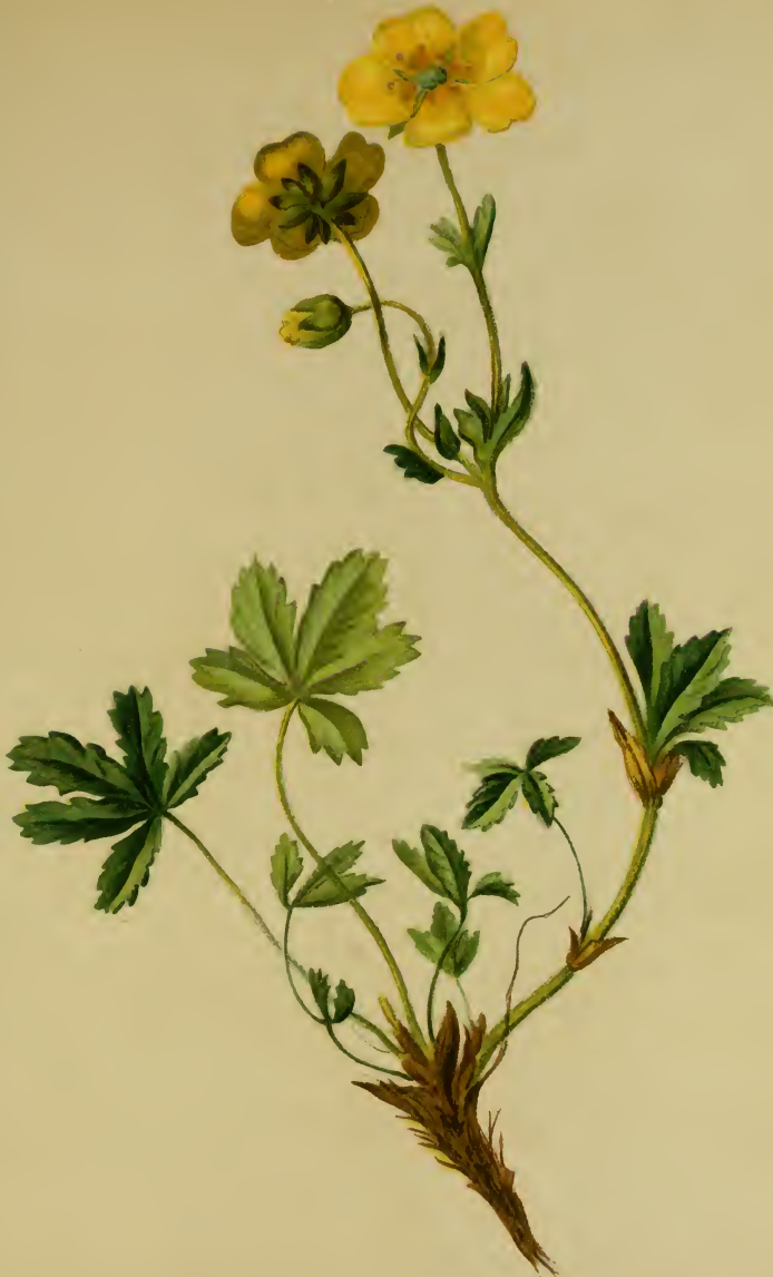
Potentilla aurea L. — Goldgelbes Fingerkraut. Alpenkette, Wiesen, 1300–2400 M., besonders auf Kalk. Mai–Juli