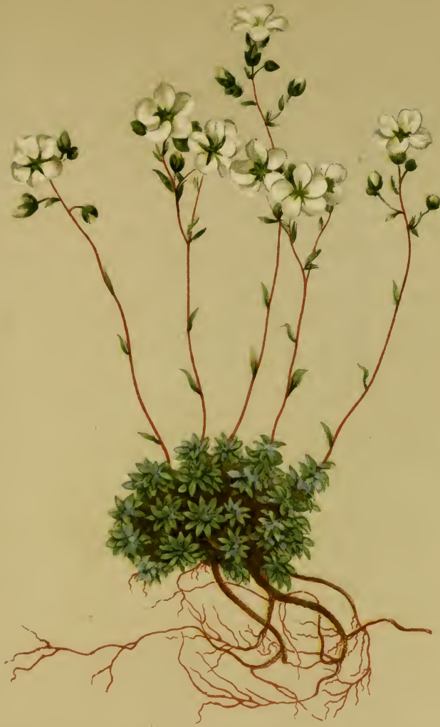
Saxifraga caesia L. — Meergrauer Steinbrech.

Schweiz bis Oesterr. u. Steierm., trockene Stellen, 1300–2700 M. auf Kalk und Dolomit, Juni, Juli.