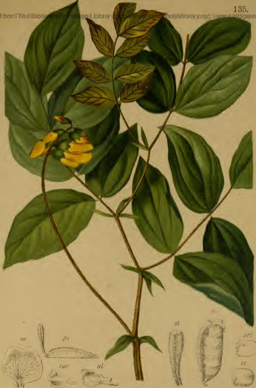
Orobus Styriacus Gremlí (1882). — Steirische Walderbse. Oestliche Alpenkette, Steiermark, Gebüsch, Mai, Juni.