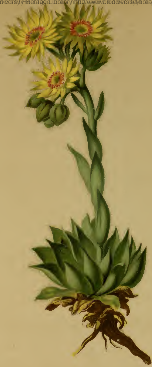
Sempervivum Wulfeni Hoppe. — Wulfen's Hauswurz.

Schweiz bis Steiermark, trockene Stellen, 2000–2600 M., auf Urgestein, Juni–August.