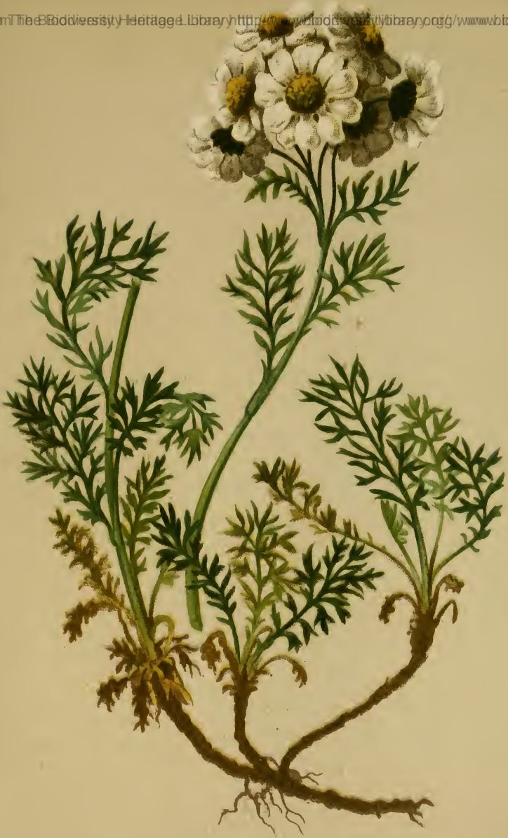
Achillea atrata L. — Geschwärzte Schafgarbe.

Alpenkette, Wiesen, feuchte Stellen, 1600—2200 M., bes. auf Kalk, Juli, August.