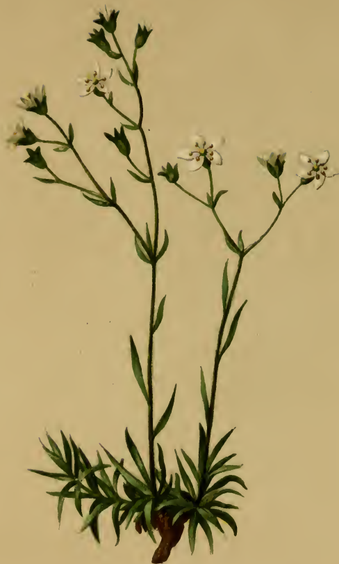
Saxifraga tenella Wulf. — Zarter Steinbrech. Steiermark und Julische Alpen, trockene Stellen, 1000—1800 M., Juni, Juli.