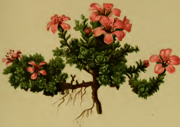
Saxifraga oppositifolia L. — Gegenblättriger Steinbrech.

Nördliche Alpenkette, trockene Stellen, 1900—2500 M., bes. auf Kalk. Juni—August.