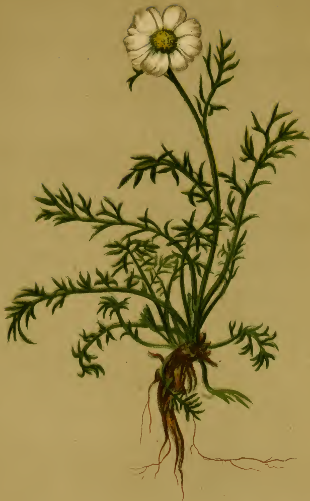
Anthemis Styriaca Vest = montana Koch et aut pp. — Steirische Hundskamille.

Steiermark, am hohen Zinken, u. s. w. — August—September.