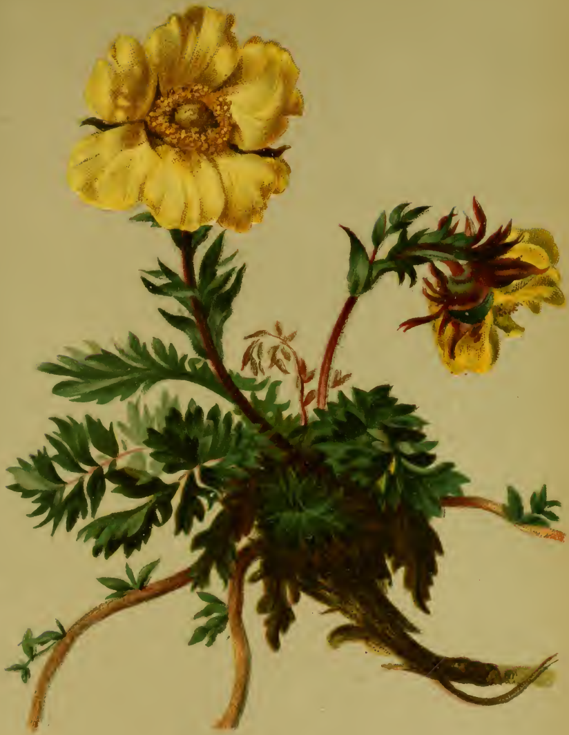
Geum reptans L. — Kriechendes Benediktenkraut. Alpenkette, trockene Stellen, 1900—2500 M. bes. auf Urgestein. Juni, Juli.