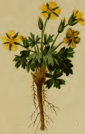
Potentilla minima Hall. fil. (1794) = Brauneana Hoppe 1800. — Kleinstes Fingerkraut.

Alpenkette, Wiesen, 1300—2400 M. bes. auf Kalk, Juni, Juli.