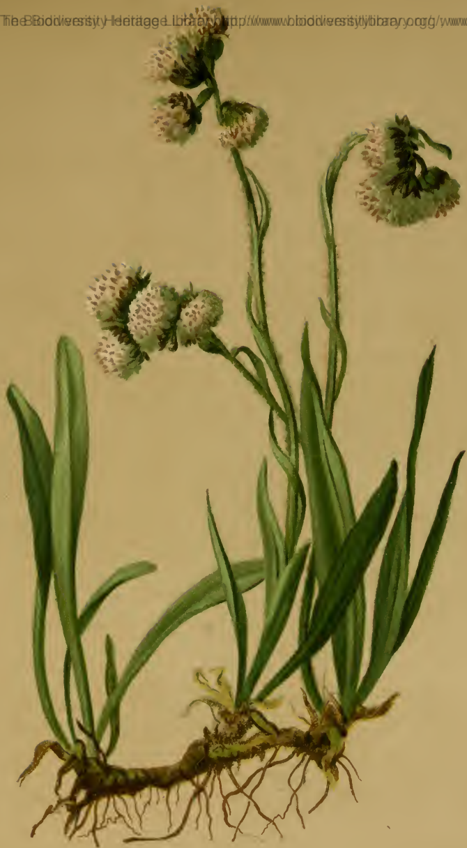
Gnaphalium Carpathicum Wahlenb. — Karpathisches Ruhrkraut. Alpenkette, Wiesen, 1900–2500 M., auf Urgestein, Juli, August.