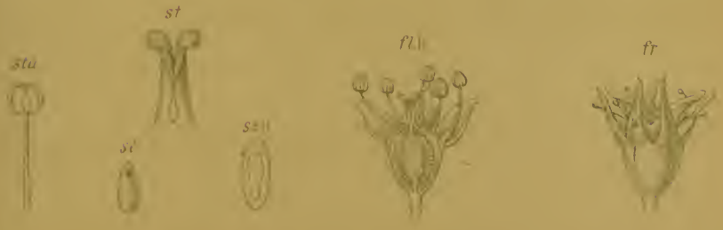
Saxifraga muscoides Wulf. (1779) nec. All. (1785). — Moosartiger Steinbrech.

Alpenkette, bes. im nördlichen Zuge, trockene Stellen, 1200—2500 M. bes. auf Kalk. Juli, August.