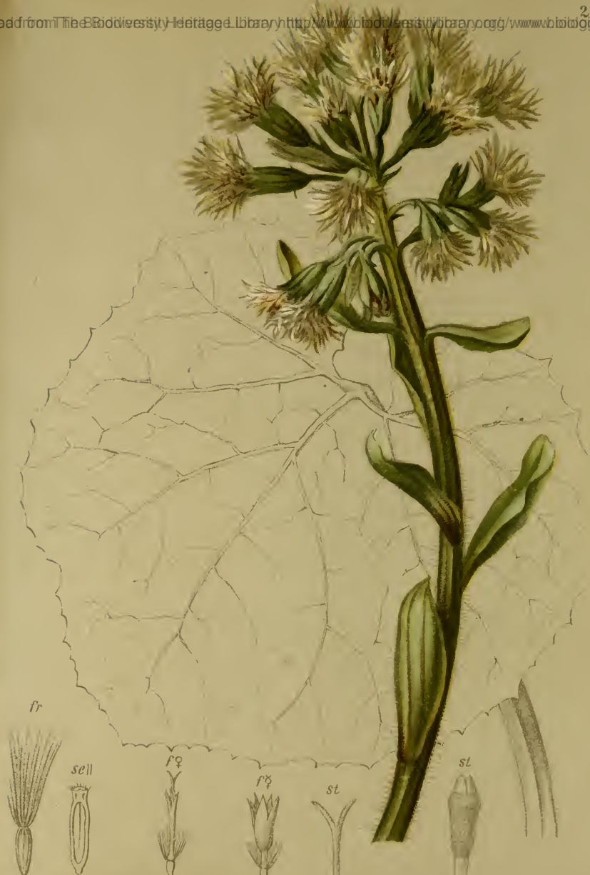
Petasites niveus (Vill) Baumg. — Schneeweisse Pestwurz.

Alpenkette, feuchte Stellen, bis 1500 M. bes. auf Kalk. März—Mai.