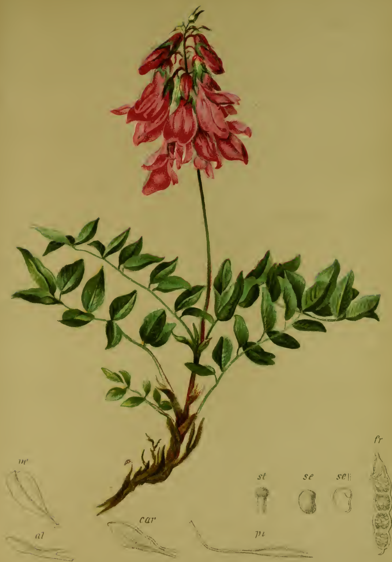
Hedysarum obscurum L. — Dunkler Süssklee.

Alpenkette, trockene Stellen, 1600—2200 M. bes. auf Kalk. Juli, August.