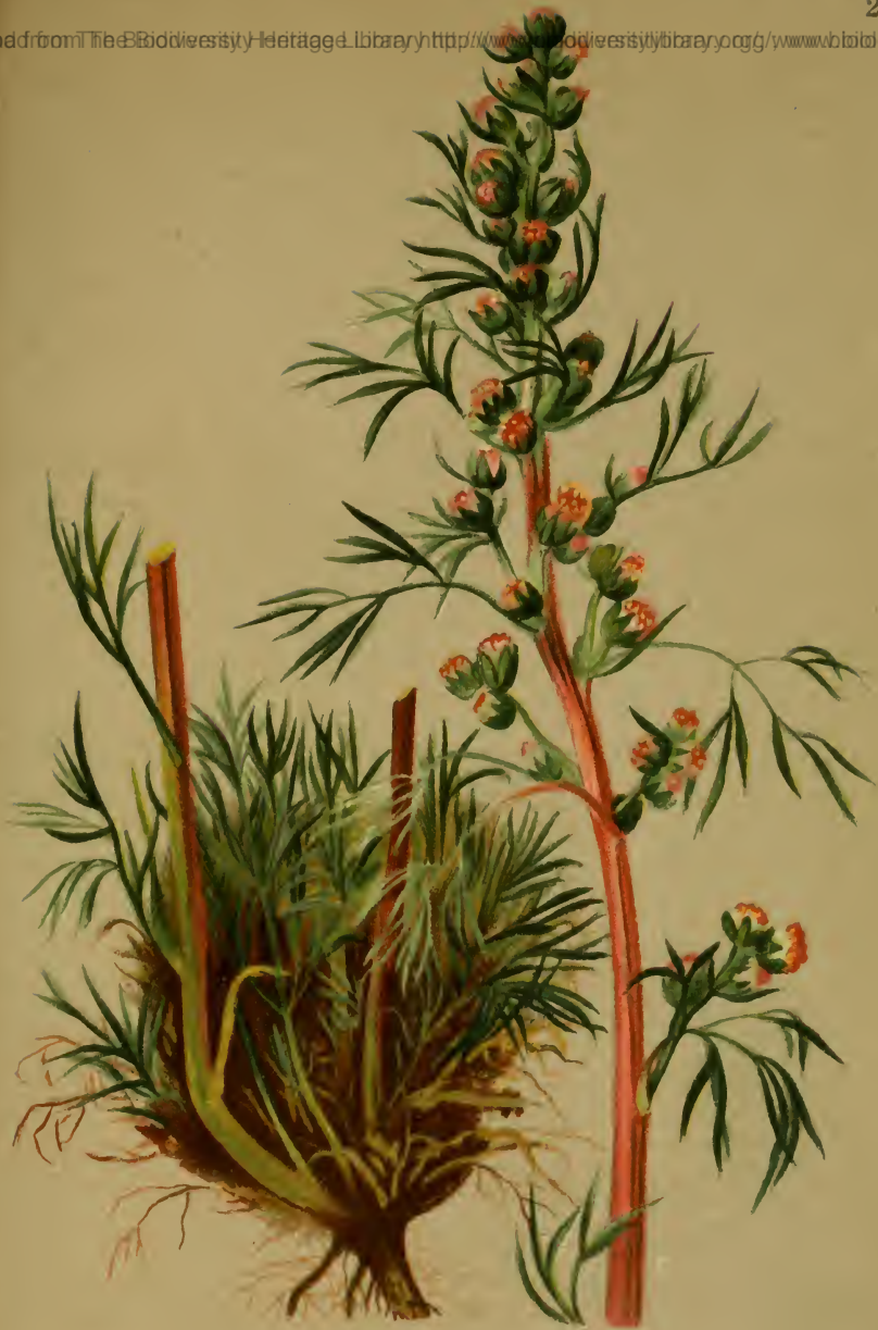
Artemisia nana Gaud. — Zwergiger Beifuss. Schweiz und Tirol, Juli, August.