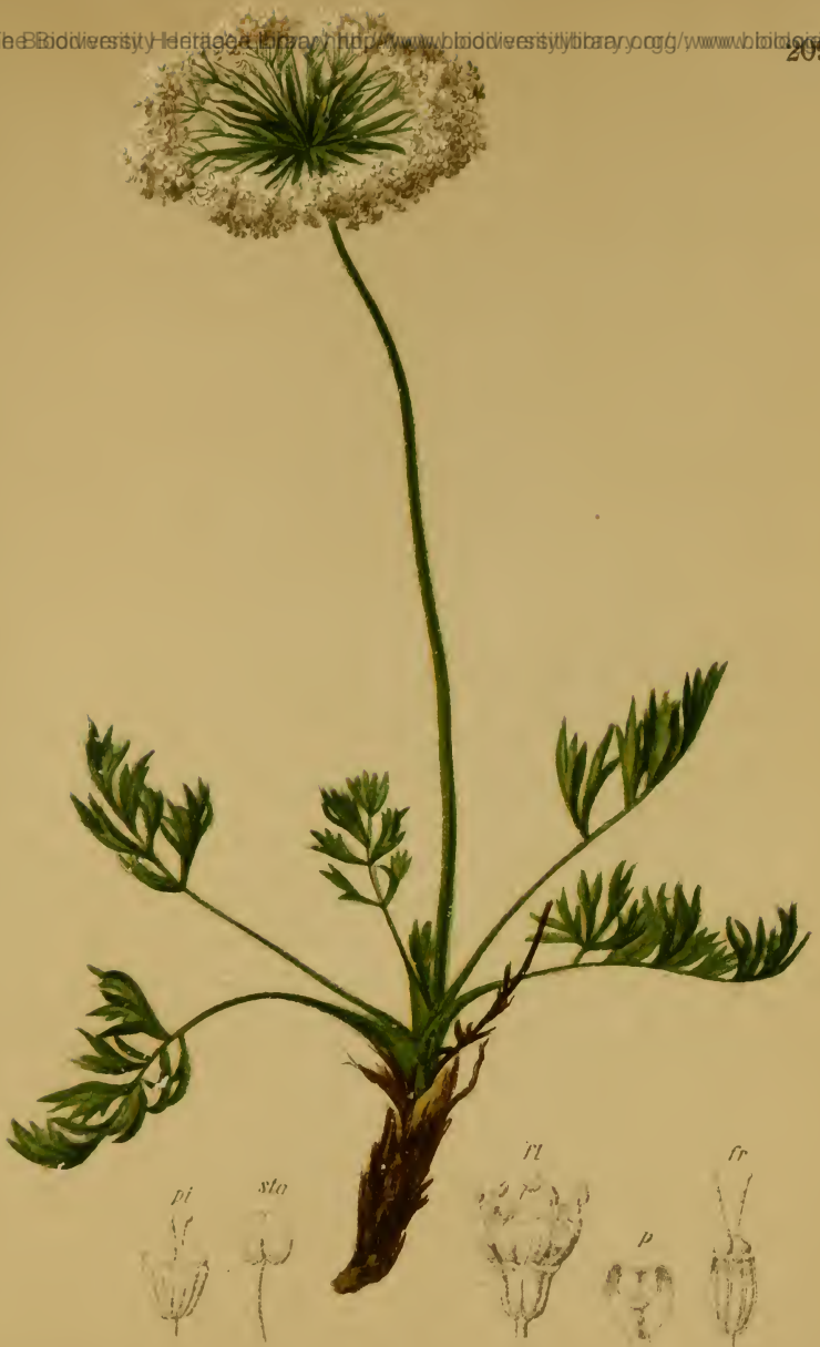
Pachypleurum simplex (L.) Reichb. = Gaya Gaud. 1828 nec Kunth. — Einfache Dickrippe.

Alpenkette, Wiesen, 1900—2500 M., bes. auf Urgestein, Juli, August.