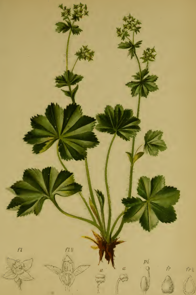
Alchemilla pubescens M. Bieb. — Flaumhaariger Frauenmantel.

Alpenkette, Wiesen, 1900—2200 M., auf Kalk, Juni—Juli.