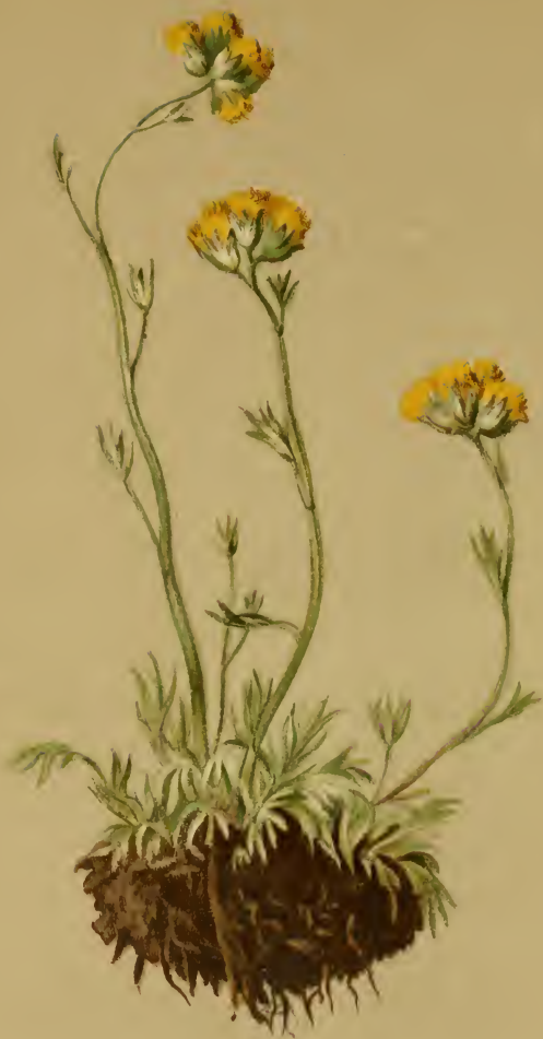
Artemisia glacialis L. — Gletscher-Beifuss. Schweiz, über 1800 M., Juli, August.