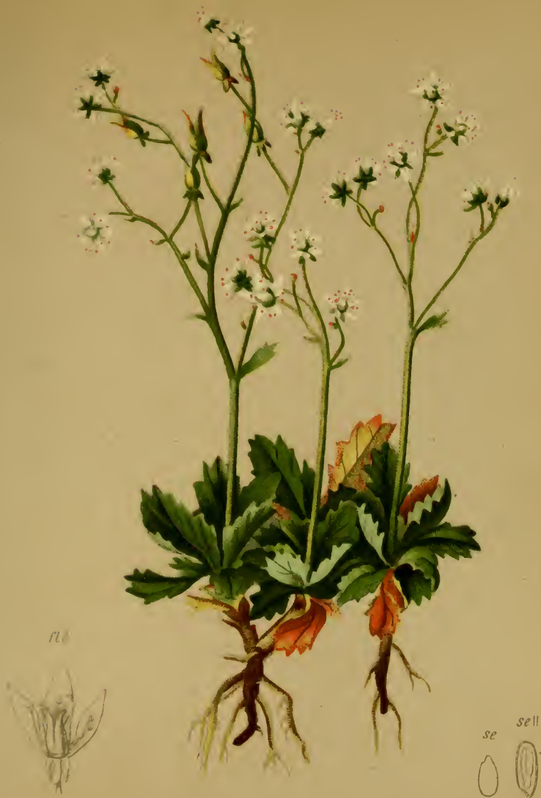
Saxifraga stellaris L. — Sternblüthiger Steinbrech.

Alpenkette, bes. feuchte Stellen, 1400—2000 M. Juli, August.