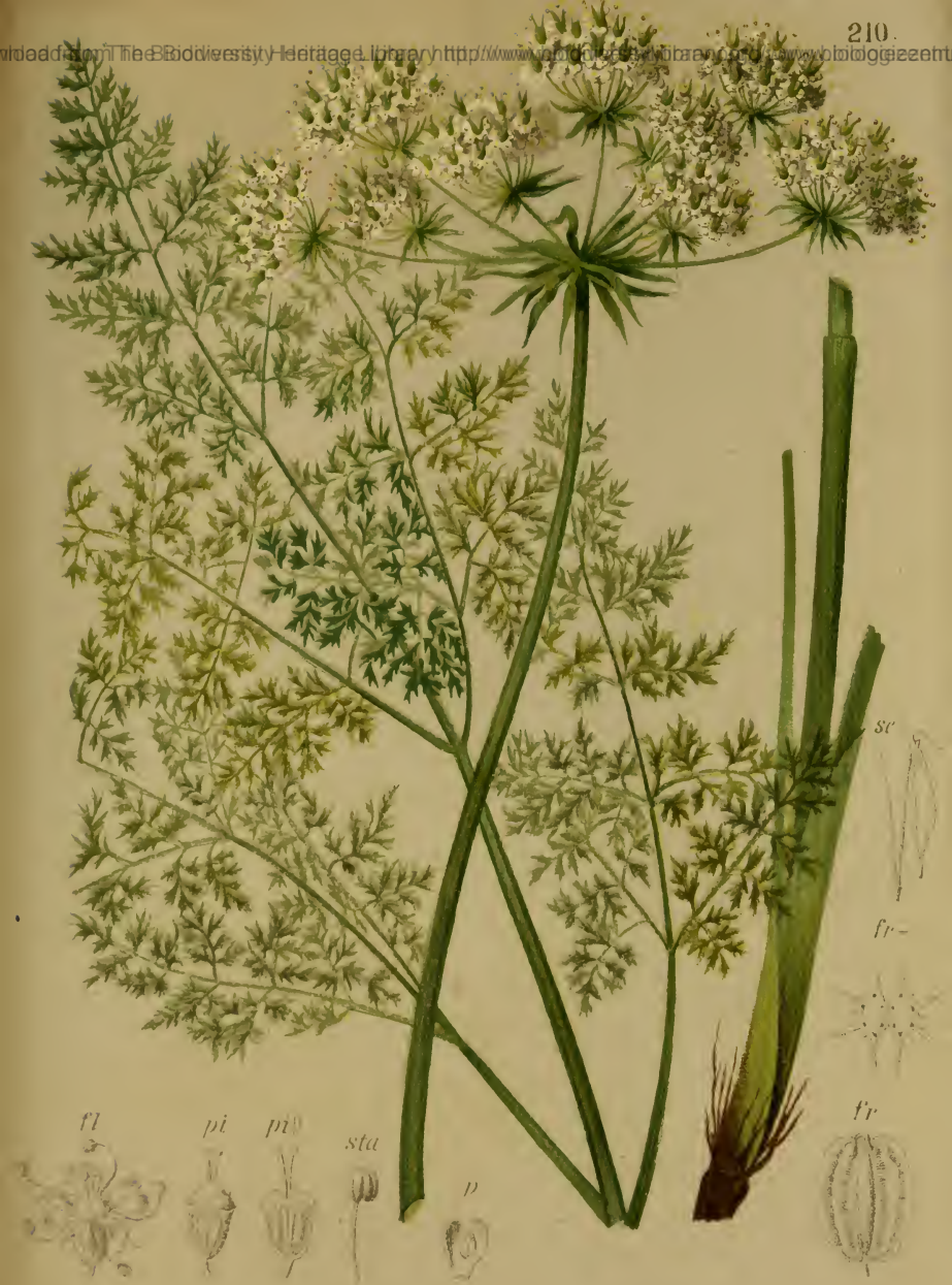
Laserpitium hirsutum Lam. — Behaartes Laserkraut.

Südl. Schweiz bis Krain, Gebüsch, trock. Stellen, 1300–2100 M., bes. a. Urgestein, Juli–August.