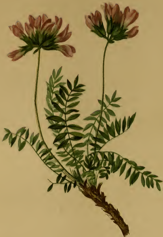
Oxytropis neglecta Gay (1850) = cyanea Gaud., Koch et aut. nec M. Bieb. = Gaudini Bunge 1851. — Vernachlässigter Spitzkiel. Schweiz, Tirol bis Kärnten, trockene Stellen, 1900—2500 M., Juli, August.