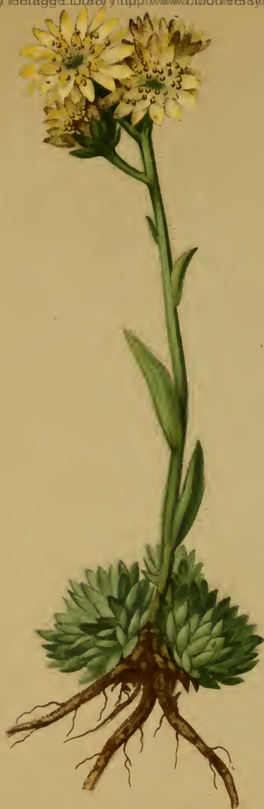
Sempervivum Braunii Funk. — Braun's Hauswurz. Tirol und Kärnten, trockene Stellen, 1800—2500 M., auf Urgestein, Juli, August.