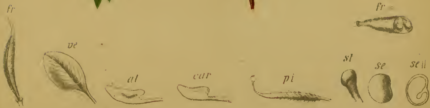
Astragalus alpinus L. = Phaca astragalina De Cand. - Alpen-Tragant.

Schweiz bis Steiermark, besonders auf Urgestein, 1600—2200 M. Juli—August.