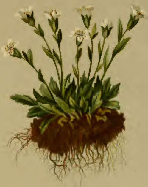
Saxifraga controversa Sternb. = ascendens Koch et aut. nec L. — Streitiger Steinbrech.

Alpenkette, fenichte Stellen, 1000—2000 M., Juni, Juli.