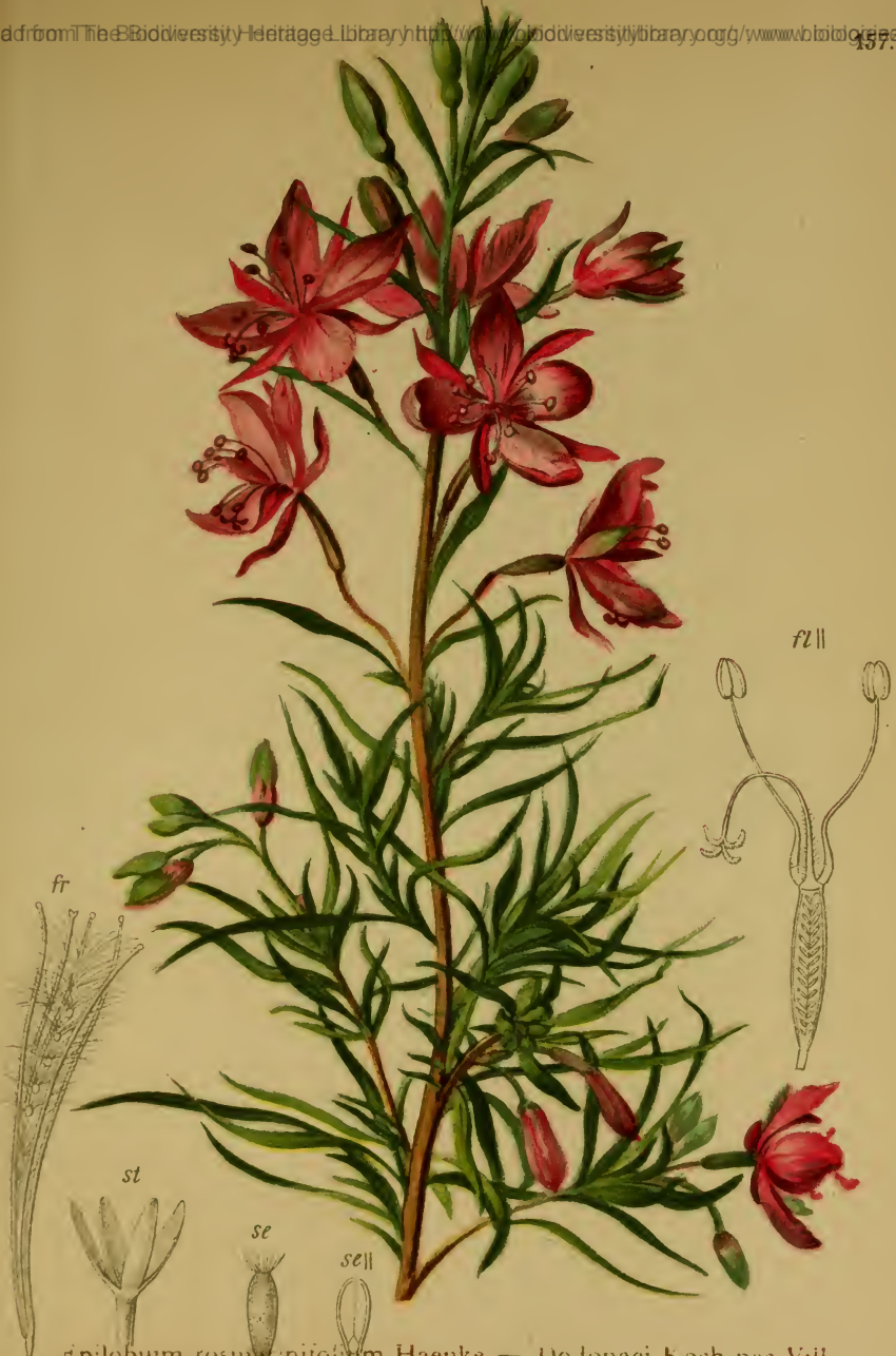
Epilobium rosmarinifolium Haenke — Dodonaei Koch nec Vill. — Rosmarinblättriges Weidenröschen.

Alpenkette, auf Kalkgerölle, bis 1600 M. Juli—August.