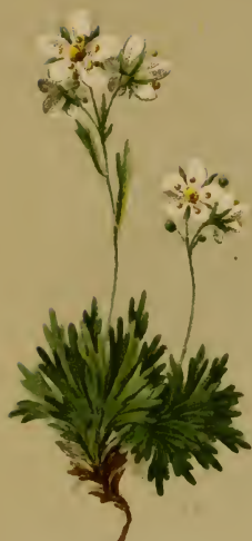
Saxifraga exarata Vill. = exarata var. \alpha compacta Koch. — Gefurchter Steinbrech.

Schweiz, Tirol, Kärnten bis Krain, trockene Stellen, 1800–2700 M., Juni, Juli.