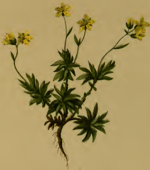
Saxifraga sedoides L. — Fettblattartiger Steinbrech.

Alpenkette, trockene und feuchte Stellen, 1900—2500 M., auf Kalk, Juli, August.