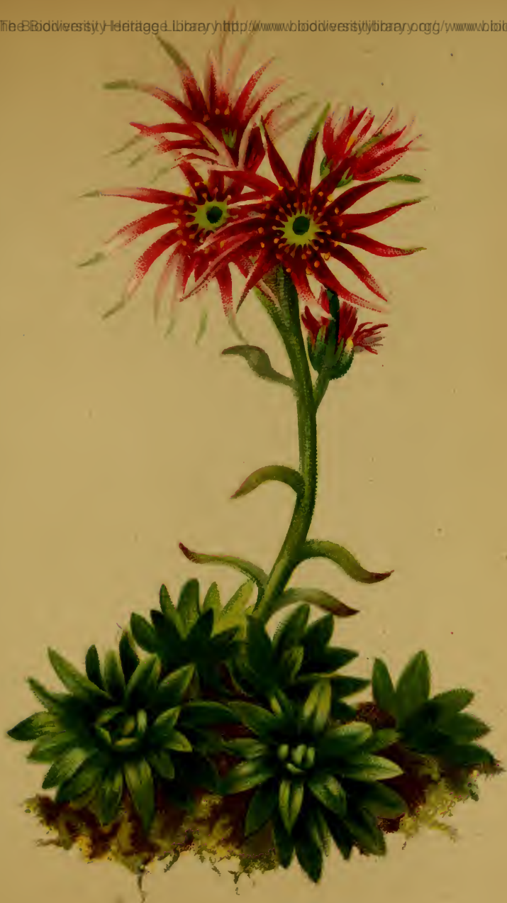
Sempervivum Funkii , Braune. — Funk's Hauswurz.

Ostpreu., auf Geröll: 1700—2100 M. Juli—August.