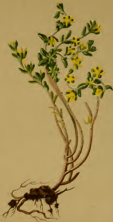
Sedum annuum L. — Einjähriges Fettblatt. Alpenkette, trockene Stellen. bis 2000 M., bes. auf Urgestein, Juli, August.