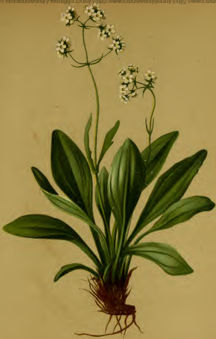
Valeriana saxatilis L. — Felsen-Baldrian. Alpenkette, trockene Stellen, 1600—2100 M. auf Kalk. Juni, Juli.