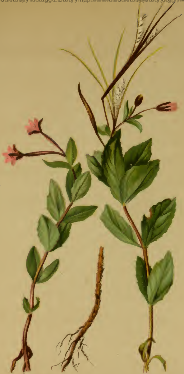
Epilobium alsinefolium Vill. (1779) = organifolium Lam. 1786. — Mierenblättriges Weidenröschen. Alpenkette. feuchte Stellen, 1300–1900 M., Juli, August.