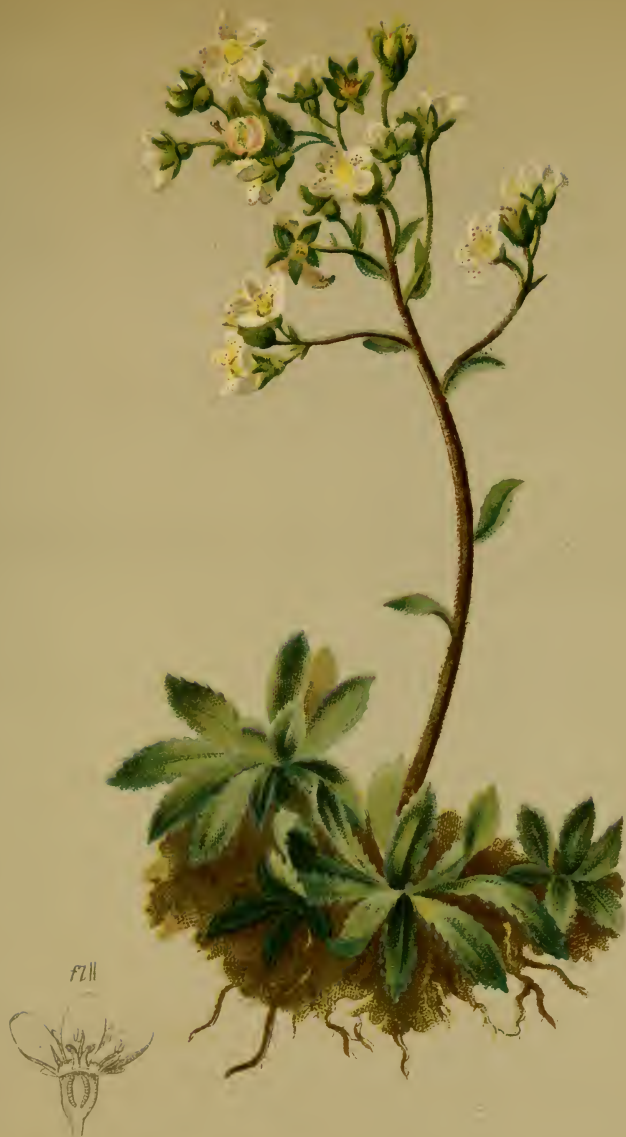
Saxifraga brevifolia Sternb. = Aizoon Jacq. — Kurzblättriger Steinbrech.

Alpenkette, auf Kaikboden 1200—2000 M. Juni—August.