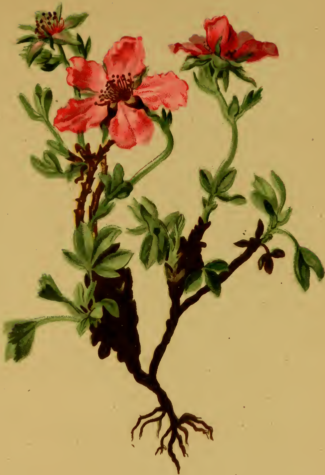
Potentilla nitida L. — Schönes Fingerkraut.

Südliche Alpenkette, 2000—3000 M. Juli, August.