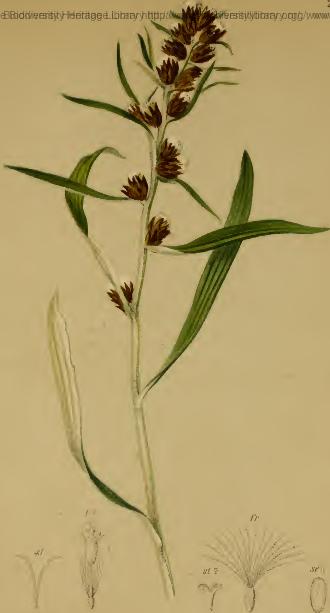
Gnaphalium Norvegicum Gunn. — Norwegisches Ruhrkraut. Alpenkette, trockene Stellen, 1300–1900 M., bes. auf Urgestein, Juli, August.