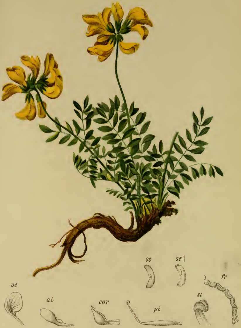
Hippocrepis comosa L. — Schopfiger Hufeisenklee. Alpenkette, trockene Stellen, bis 1800 M., besonders auf Kalk. Juni–August.