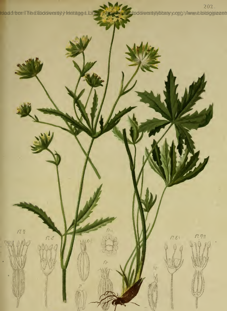
Astrantia minor L. — Kleiner Thalstern.

Schweiz und Tirol, Wiesen, 1800—2300 M. auf Urgestein. Juli, August.