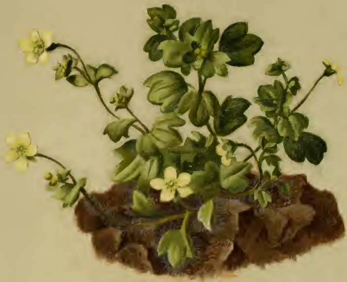
Saxifraga arachnoidea Sternb. --- Spinnenwebiger Steinbrech. Südtirol, an feuchten Stellen, 300—2000 M. auf Dolomit. Juli, August.