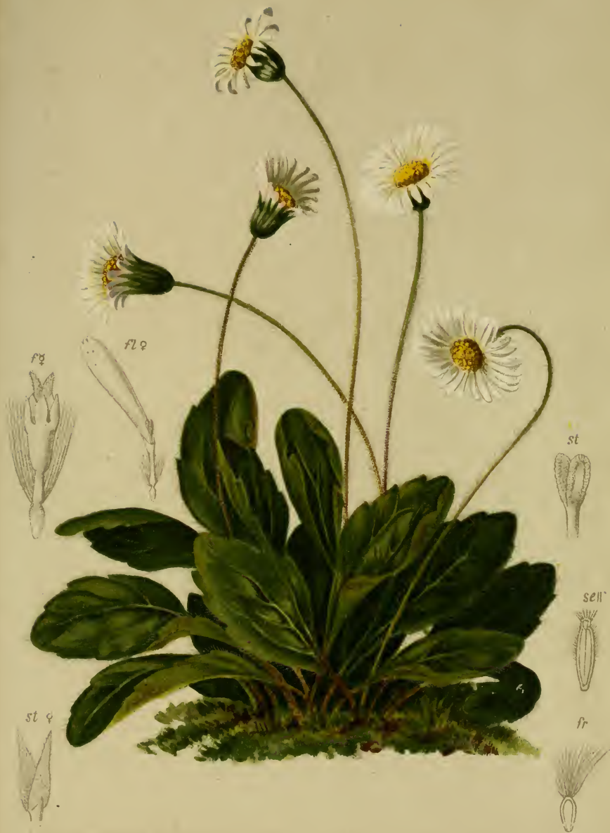
Bellidiastrum Michelii (L.) Cass. — Micheli's Alpenmassliebchen.

Alpenkette, Triften, bis 1900-M. bes. auf Kalk. Mai—Juli.