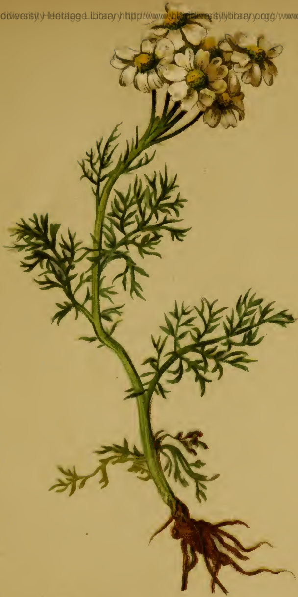
Achillea Clusiana Tausch. — Clusius-Schafgarbe. Ostalpen, 1600—2200 M. Juli—August.