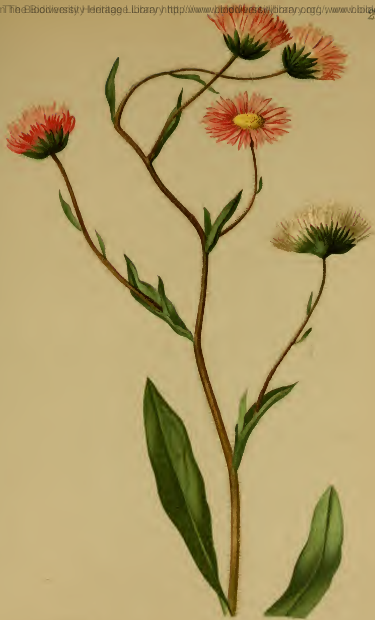
Erigeron Villarsii Bell. — Villars' Berufkraut. Schweiz, Tirol und Kärnten, Wiesen, 1500—1900 M., Juli, August.