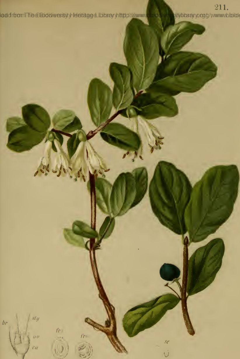
Lonicera coerulea L. — Blaue Lonizere, Heckenkirsche.

Alpenkette, Gebüsch, bis 1600 M., bes. auf Kalk, Mai, Juni.