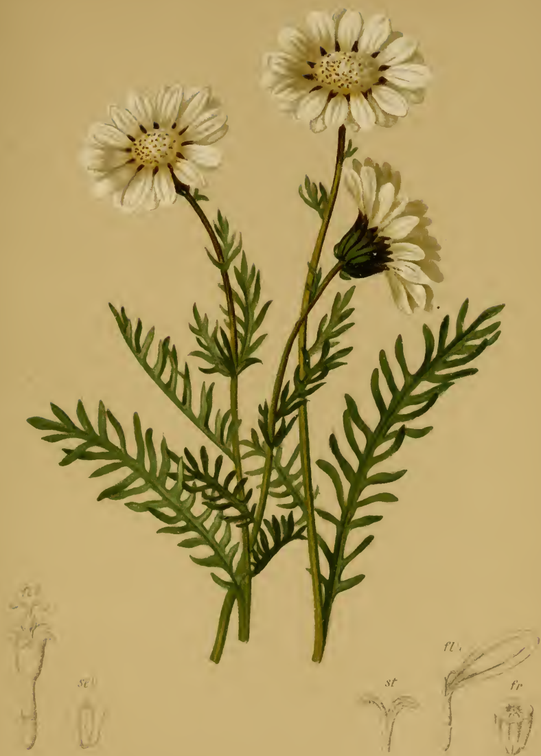
Anthemis alpina L. — Alpenhundskamille.

Tirol bis Steiermark, trockene Stellen, 1800--2200 M., bes. auf Kalk, Juli, August.