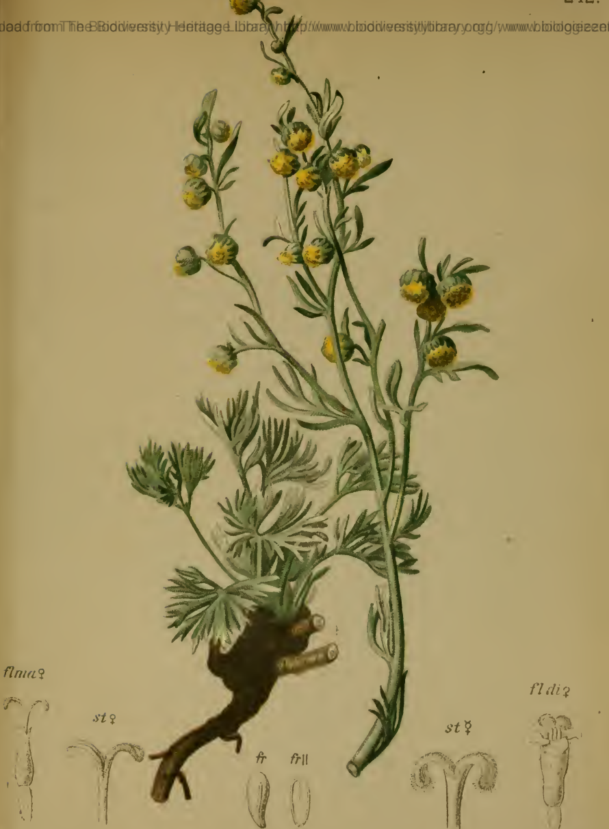
Artemisia mutellina Vill. — Edelraute

Downloaded from The Botanical Society of America Library at http://www.botanicalsociety.org/ on 07/11/15