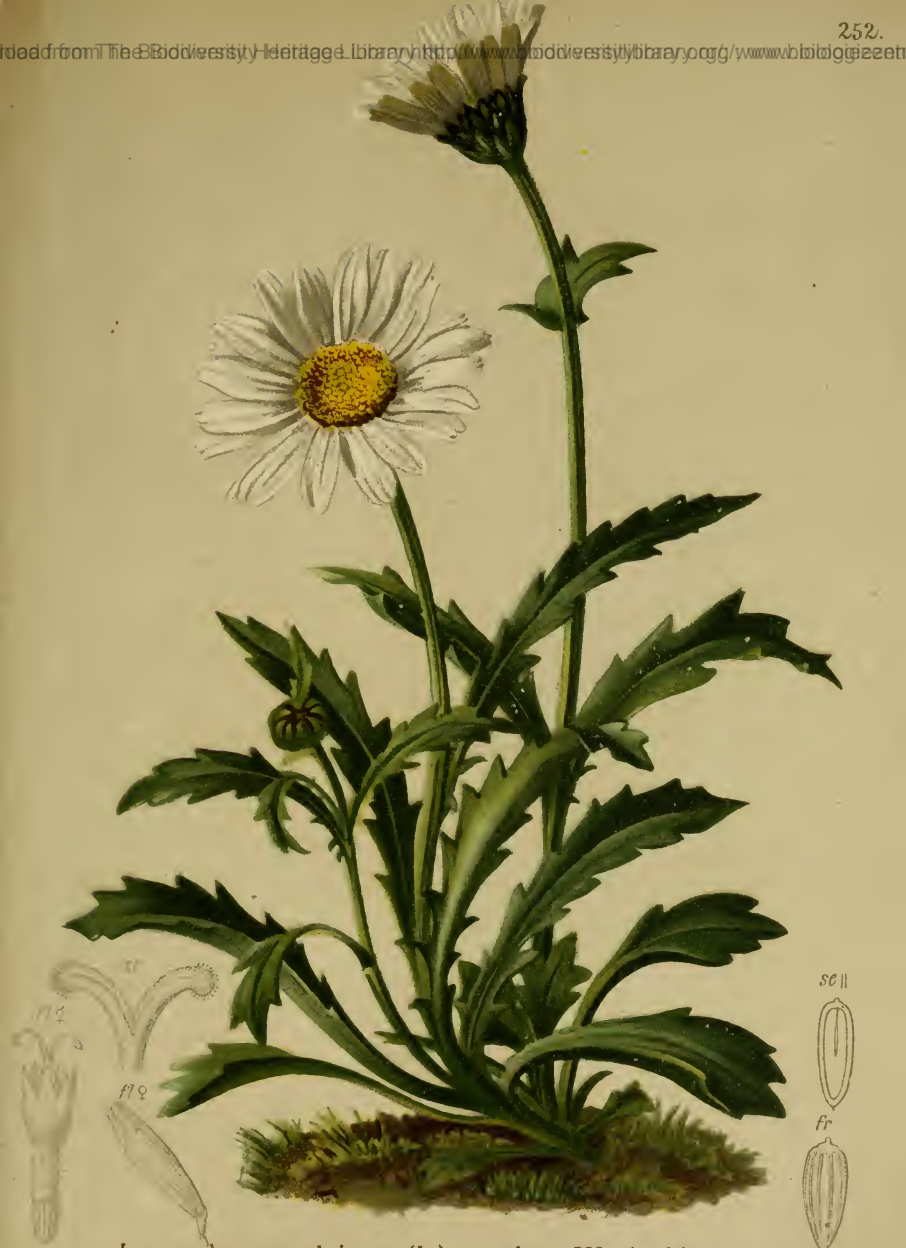
Leucanthemum alpinum (L.) — Alpen-Wucherblume.

Schweiz bis Oesterreich, Wiesen, 1700—2500 M. Juli, August.