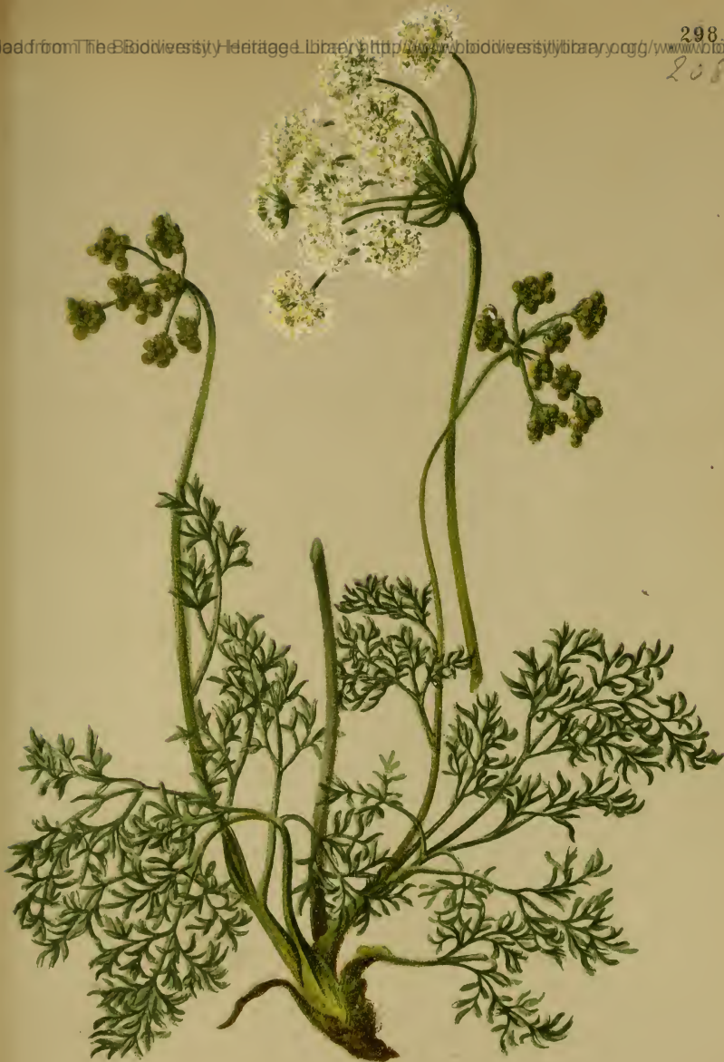
Meum mutellina (L.) Gärtn. — Rauten-Bärwurz.

Alpenkette, Wiesen, 1300—2200 M. Juli, August.