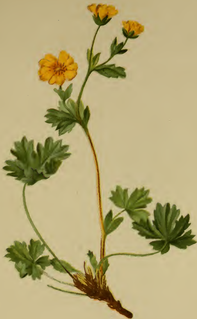
Potentilla villosa (Crntz. 1769) = maculata Pourr. 1788 = salisburgensis Hänke 1788 = rubens Vill. 1789 = crocea Hall. Schleich. h. 1807 = alpestris Hall. Fil. 1823. - Zottiges Fingerkraut. Alpenkette, Wiesen, 1900—2500 M., auf Urgest., selten auf Kalk, Juli, August.