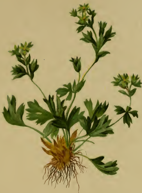
Alchemilla pentaphyllea L. — Fünfblättriger Frauenmantel.

Schweiz u. Tirol, Gletscher, 1860—2500 M. Juli, August.