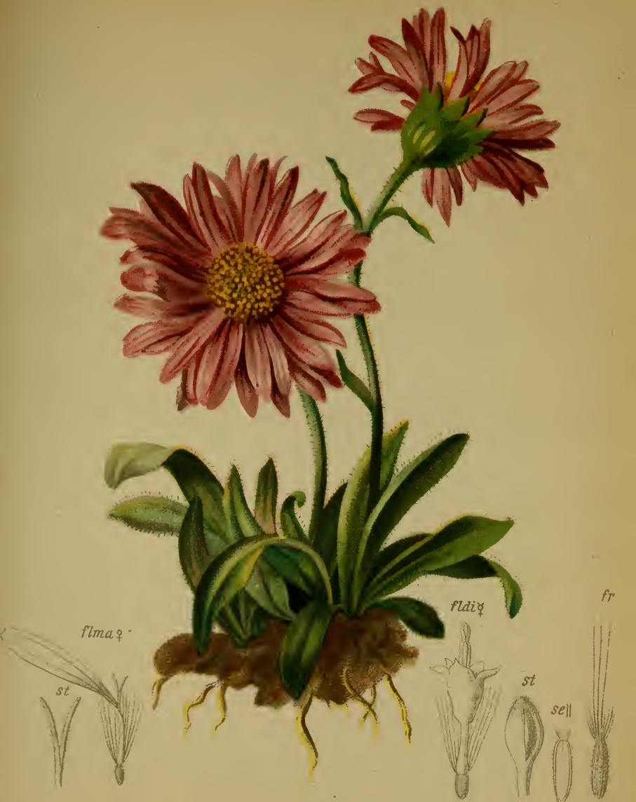
Aster alpinus L. — Alpen-Sternblume.

Alpenkette, auf Kalkgerölle, 1560—1900 M. Juli, August.