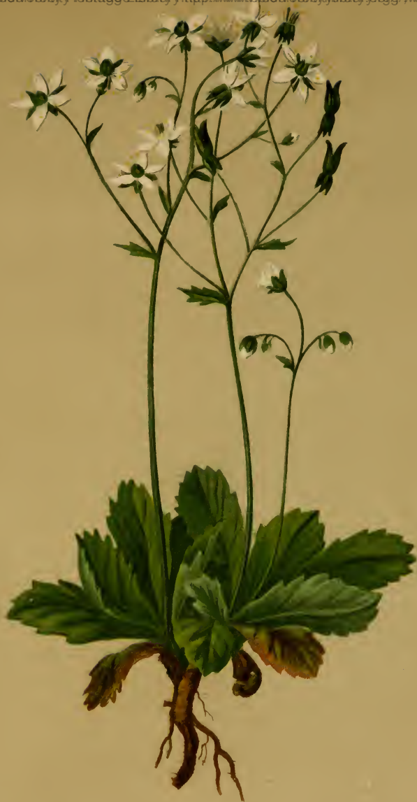
Saxifraga Engleri D. T. = Clusii Koch et aut. geom. nec Gouan! stellaris L. var. robusta Engl. — Engler's Steinbrech. Schweiz, Tirol und Salzburg, feuchte Stellen, 1300—1900 M., Juni—August.