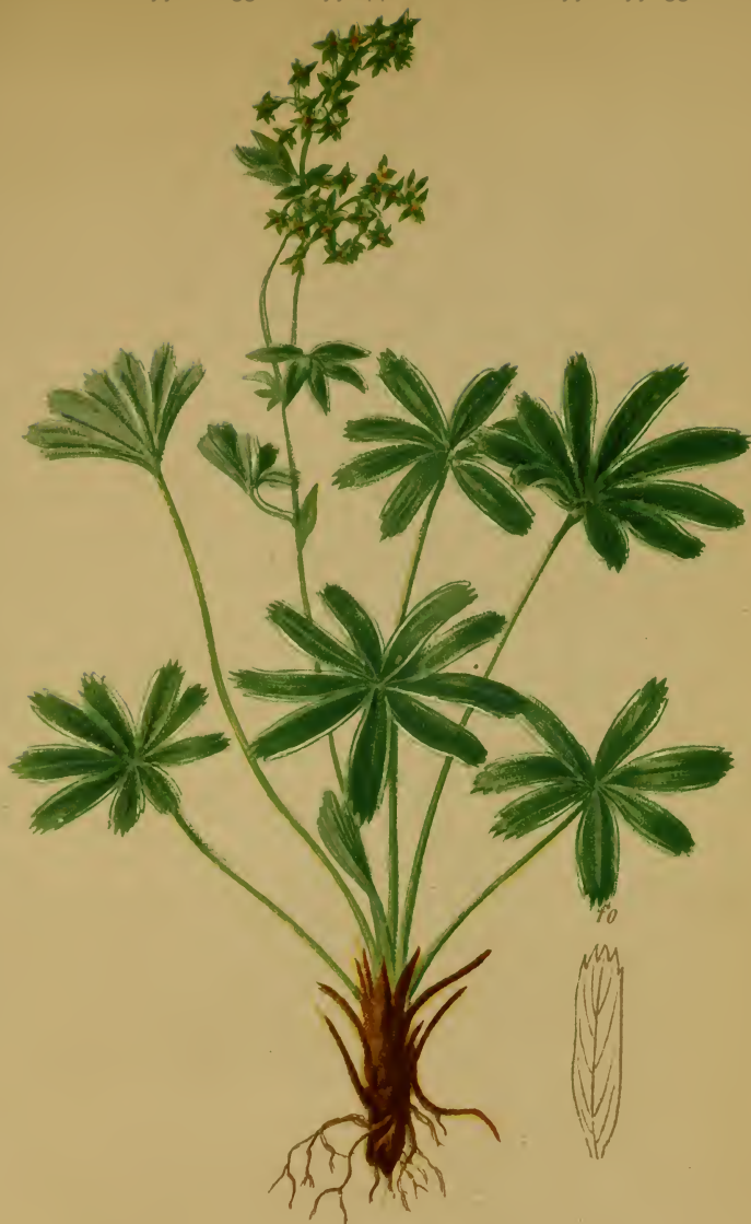
Alchemilla alpina L. — Alpen-Frauenmantel.

Alpenkette, auf Triften, bis 1800 M. Juni—August.