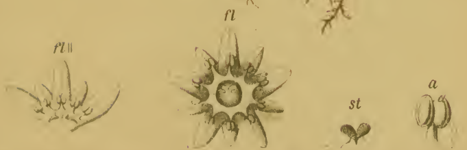
Zahlbrucknera paradoxa (Sternb.) Reichenb. — Wundersame Zahlbrucknera.

Kärnten u. Steiermark, selt. 1050—1800 M. Juni, Juli.