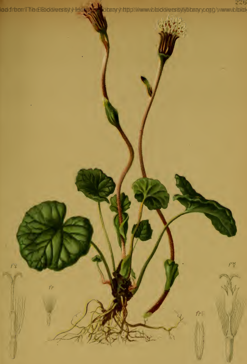
Homogyne alpina (L.) Cass. — Gemeiner Alplattich.

Downloaded from The Biodiversity Heritage Library http://www.biodiversitylibrary.org/