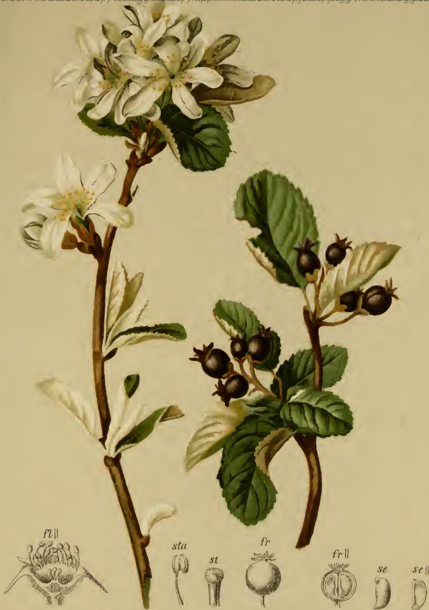
Aronia rotundifolia Pers. — Rundblättrige Felsenbirne.

Alpenkette, trockene Stellen. bis 1600 M. Mai, Juni,