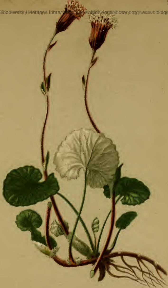
Homogyne discolor (Jacq.) Cass. — Zweifarbiger Alplattich. Tirol bis Oesterreich und Kärnten, Wiesen, 1600—2000 M., auf Kalk, Juni, Juli.