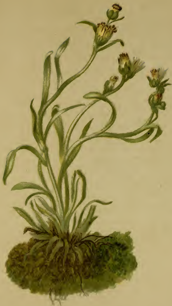
Gnaphalium Hoppeanum Koch. — Hoppe's Ruhrkraut. Schweiz bis Steiermark, trockene Stellen, 1900—2500 M., Juli, August.