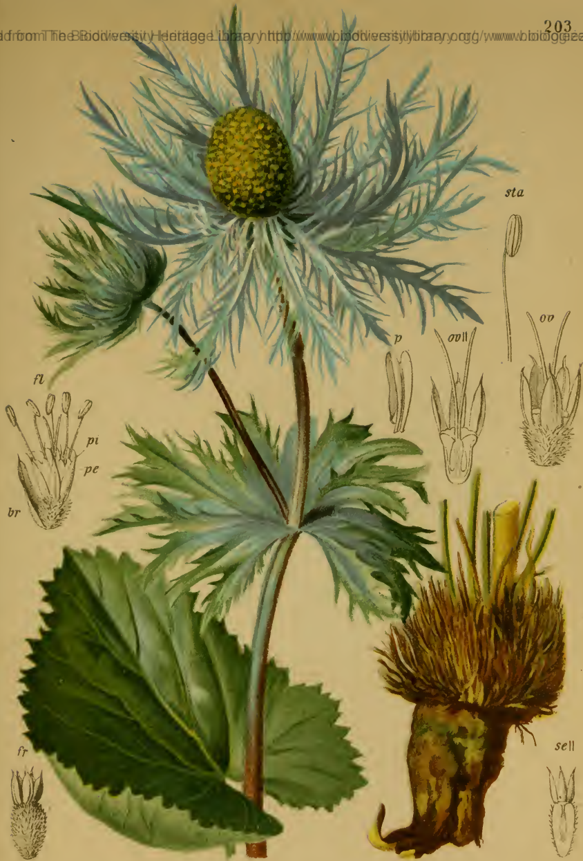
Eryngium alpinum L. — Alpen-Mannstreue.

Schweiz, Kärnten und Krain, auf Triften, 1500 — 1900 M. Juli—August.