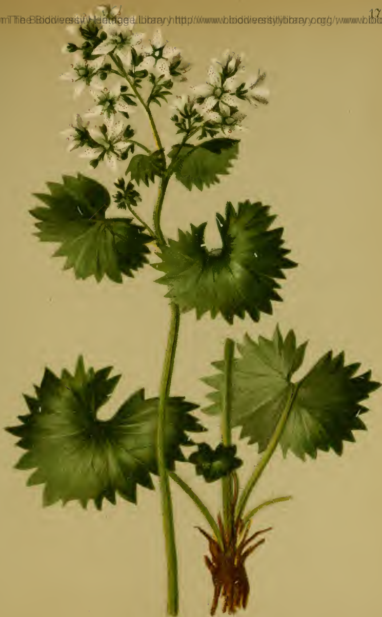
Saxifraga rotundifolia L. — Rundblättriger Steinbrech.

Alpenkette, feuchte Stellen, 600—1600 M., bes. auf Kalk, Juni—August.