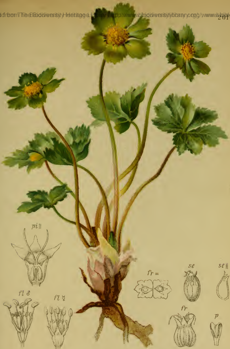
Hacquetia Epipactis (L.) de Cand. — Gelbgrüne Hacquetie, Schaftdolde.

Kärnten bis Krain, Gebüsch, bis 1500 M., April, Mai.