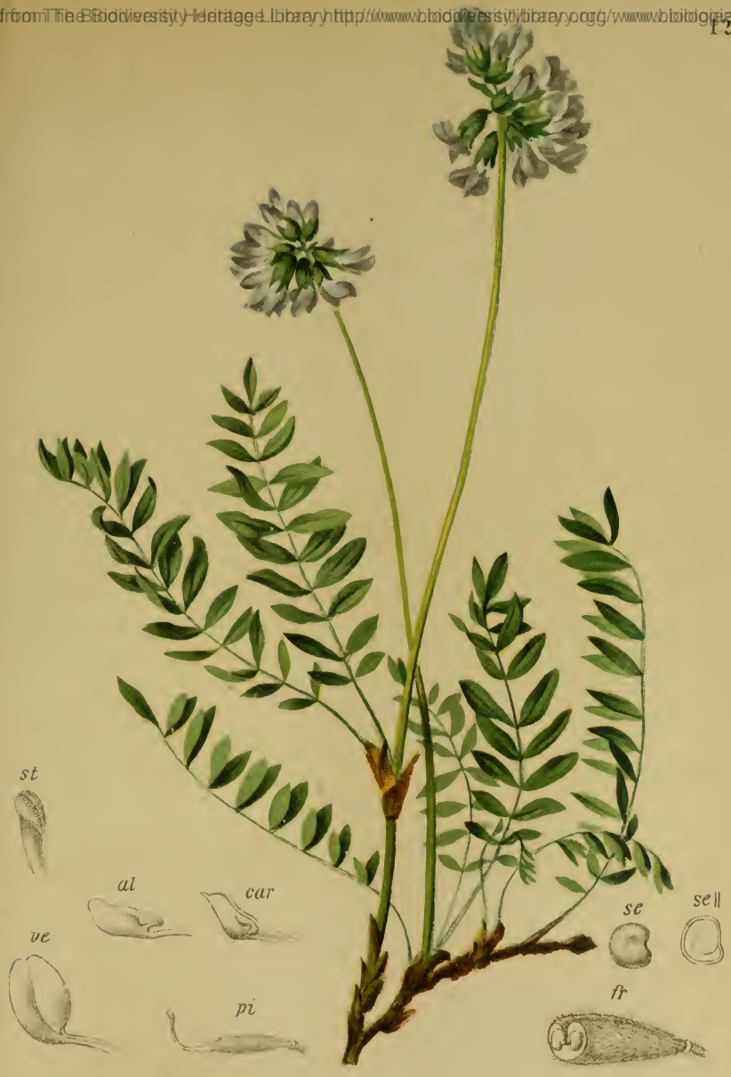
Oxytropis Lapponica (Wahlenb.) Gaud. — Lappländ. Spitzkiel Schweiz, Südtirol, Salzburg u. Kärnten, trockene Stellen, 2000–2500 M. zuf Urgestein. Juli–August.