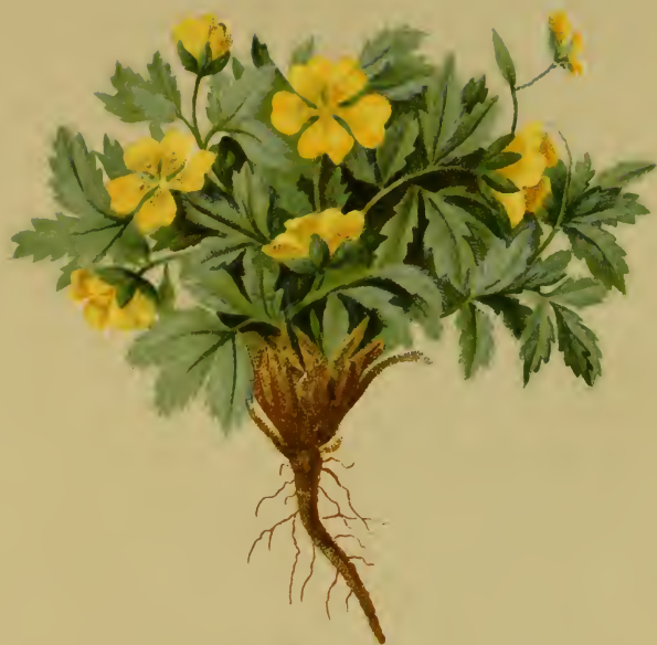
Potentilla frigida Vill. — Kälteliebendes Fingerkraut.

Schweiz bis Steiermark, trockene Stellen, 2200–2500 M., auf Urgestein, Juli, August.