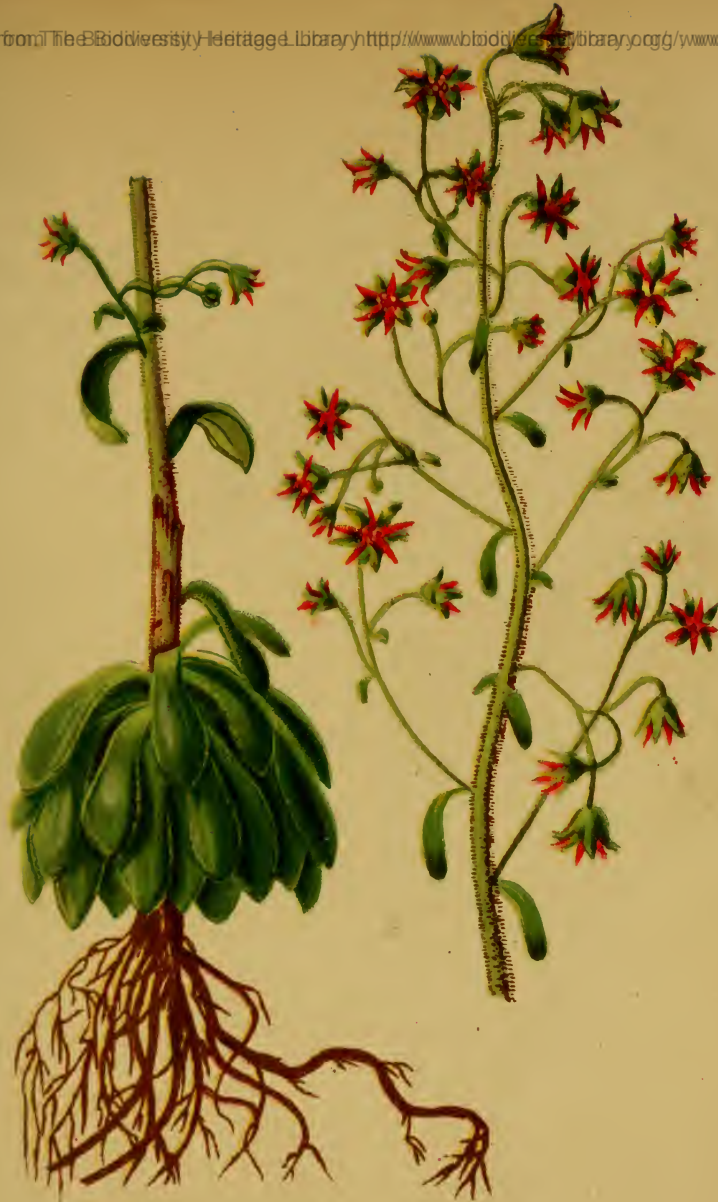
Saxifraga mutata L. — Veränderlicher Steinbrech.

Alpenkette, auf Kalkboden, 800—2000 M. Juli—August.