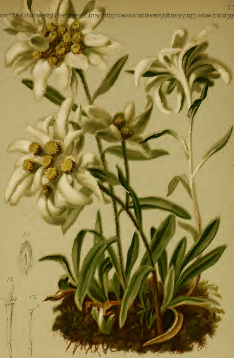
Gnaphalium Leontopodium (L.) Scop. — Strahliges Ruhrkraut, Edelweiss.

Alpenkette, trockene Stellen, 1300—1900 M.. bes. auf Kalk, Juli—September.