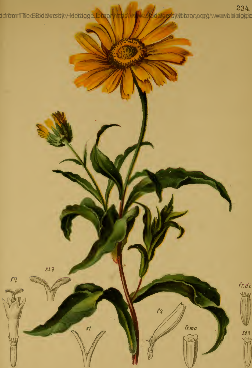
Buphthalmum salicifolium L. — Weidenblättrige Rindszunge.

Alpenkette, auf Kalkboden, bis 1800 M. Juli—August.