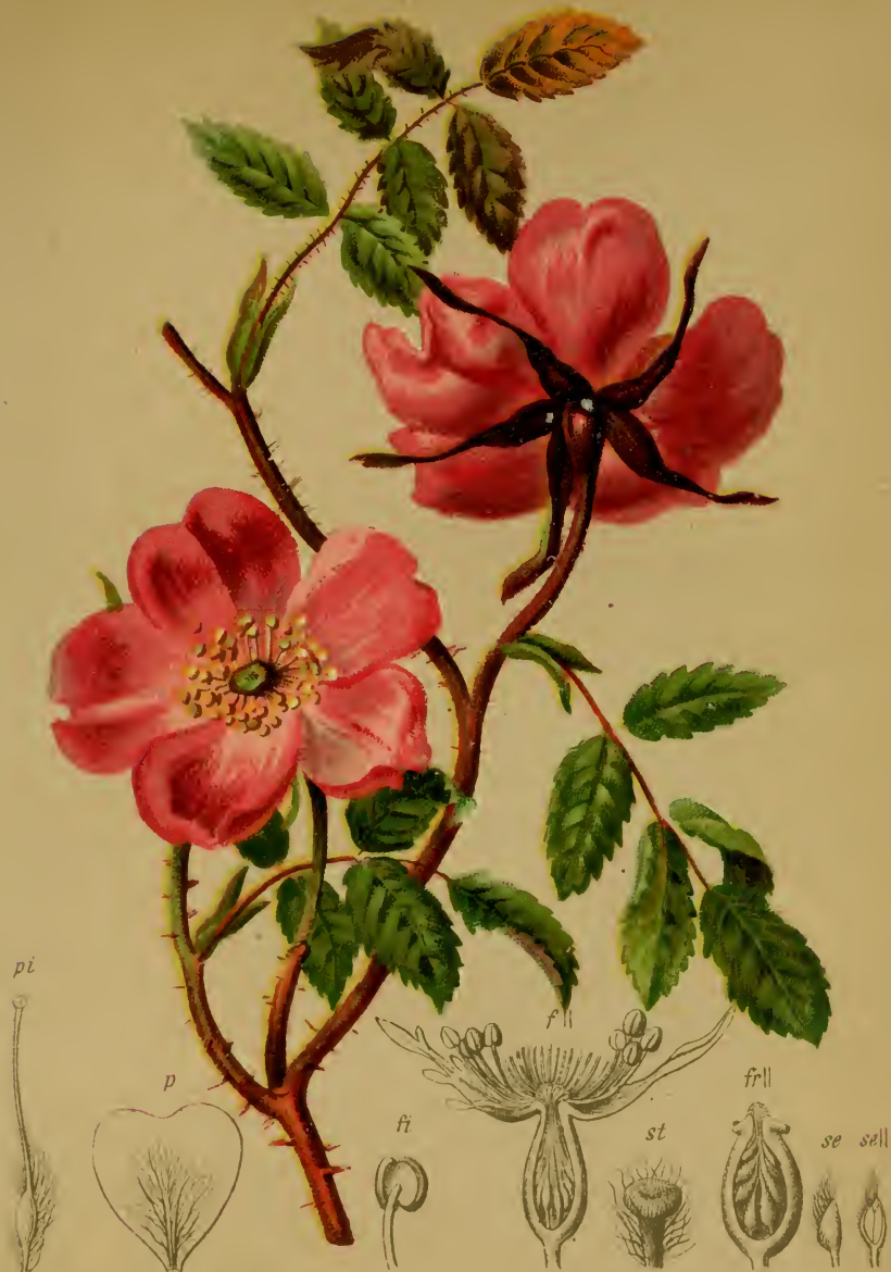
Rosa alpina L. — Alpine (Alpen-) Rose.

Alpenkette, Gebüsch, bis 1800 M. Mai, Juni.