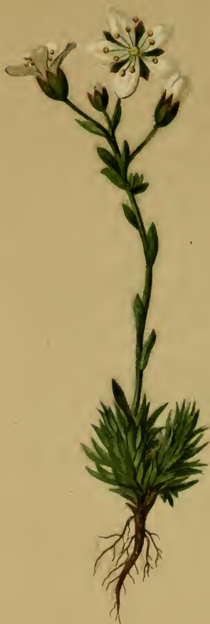
Saxifraga Vandellii Sternb. — Vandelli's Steinbrech. Schweiz, Tirol und Steiermark, Mai, Juni.