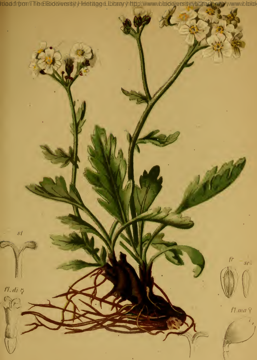
Achillea Clavenae L. — Chiavena's Schafgarbe.

Alpenkette, auf Kalkboden, 1700—2200 M. Juni—September.