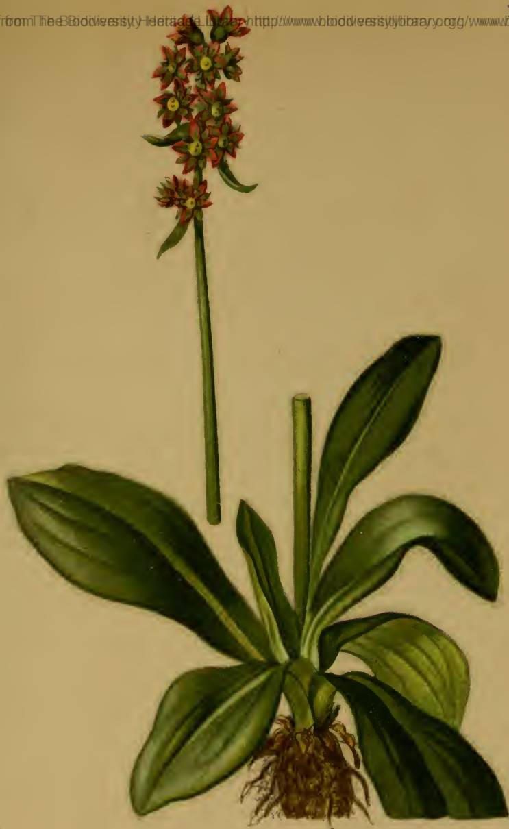
Saxifraga hieraciifolia Waldst. & Kit. — Habichtskrautblättriger Steinbrech.

Ober-Steiermark, feuchte Stellen, bei 1600 M., Juni, Juli.