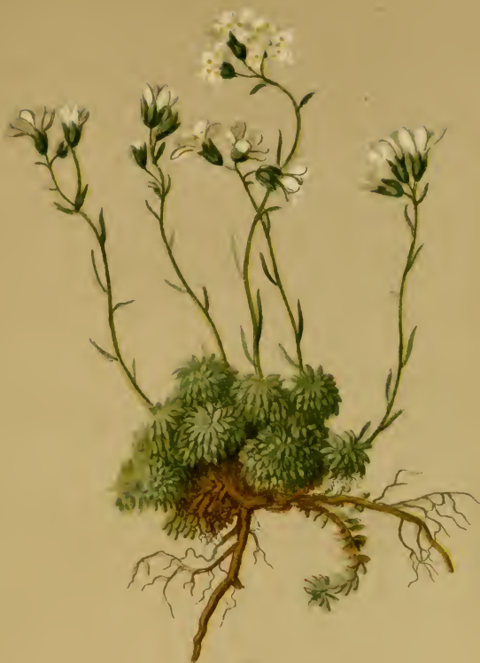
Saxifraga squarrosa L. — Sporriger Steinbrech.

Südl. Alpenkette, Tirol bis Krain, trockene Stellen, 1500–2300 M., auf Kalk und Dolom Juli, August.