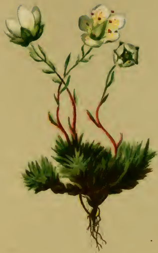
Saxifraga bryoides L. — Bryumartiger Steinbrech. Alpenkette, trockene Stellen, 1900–2500 M. auf Urgestein, Juli, August.