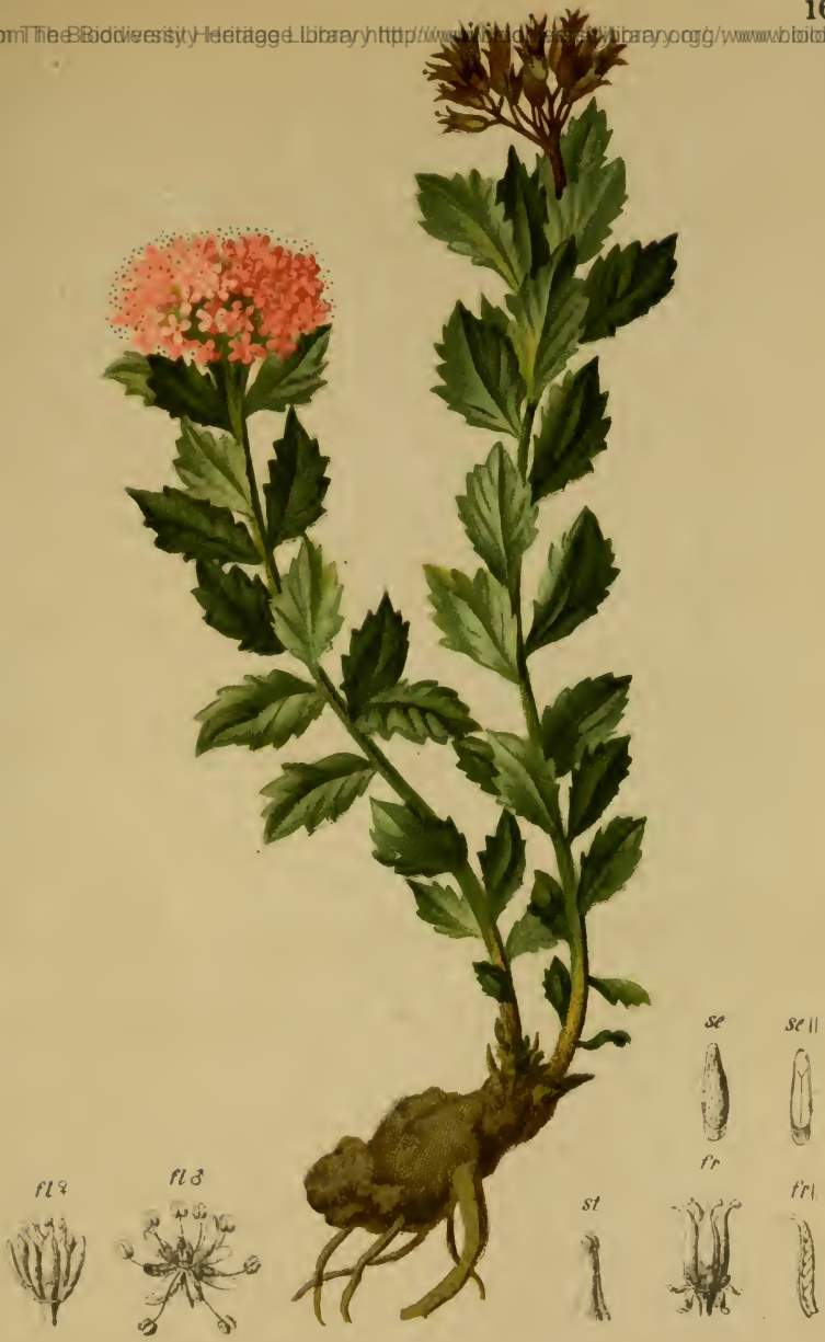
Rhodiola rosea L. — Gemeine Rosenwurz. Alpenkette, trockene Stellen, 1300–2200 M., auf Urgestein, Juni, Juli.