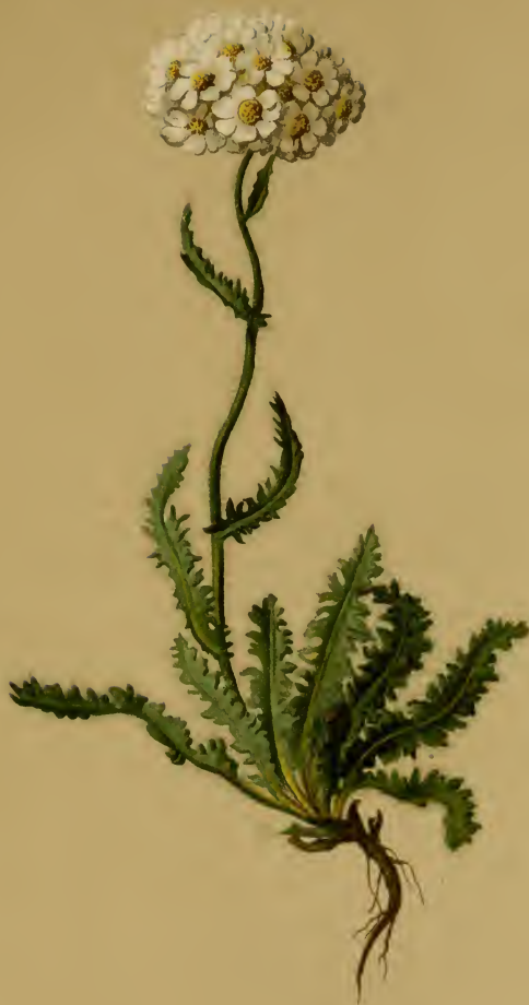
Achillea nana Gaud. — Zwerg-Schafgarbe.

Schweiz und westl. Tirol, trockene Stellen, über 1860 M., auf Urgestein, Juli, August.