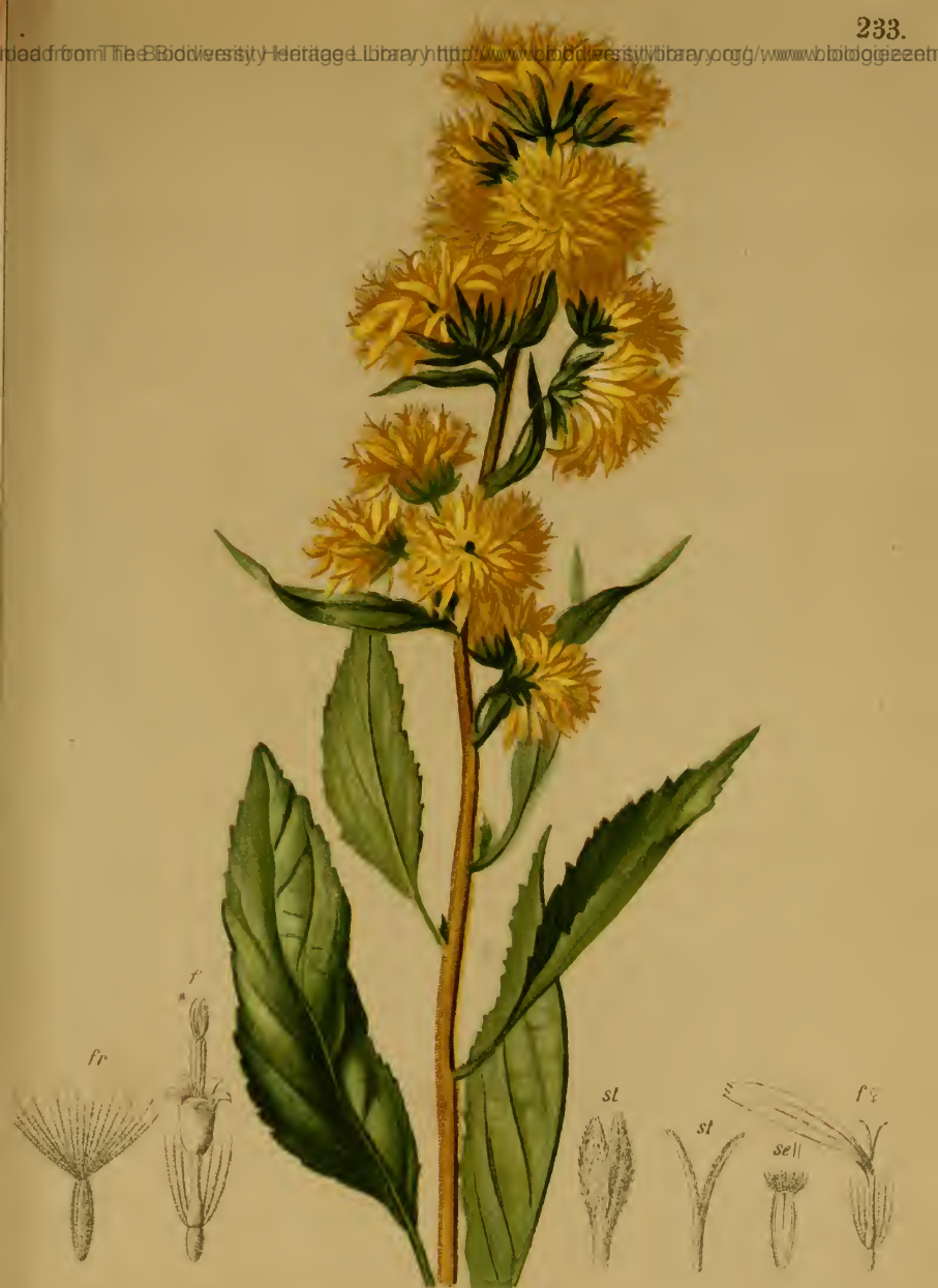
Solidago alpestris Waldst. & Kit. = virgaurea L. var. \delta Koch Voralpen Goldrute.

Alpenkette, trockene Stellen, Wiesen, 1200–2200 M., Juni, Juli.