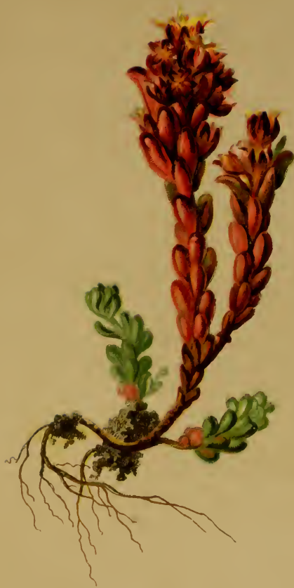
Sedum atratum L. = rubens Wulf. — Schwärzliches Fettblatt.

Alpenkette, trockene Stellen, 1300—2000 M., Juli, August.