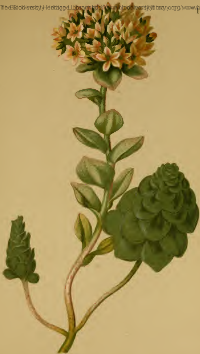
Sedum Anacampseros L. — Rundblättriges Fettblatt. Schweiz und Südtirol, trockene Stellen, 1500—1900 M., Juli, August.