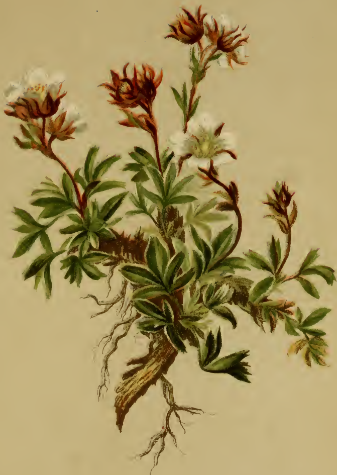
Potentilla Clusiana Jacq. — Clusius' Fingerkraut. Tirol, Salzburg, Ober-Baiern, Steiermark und Nieder-Österreich, trockene Stellen, 1600–2000 M., auf Kalk, Juli, August.