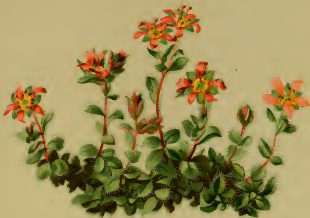
Saxifraga biflora All. — Zweiblüthiger Steinbrech.

Alpenkette, trockene Stellen, 2300–3300 M., Juni, Juli.