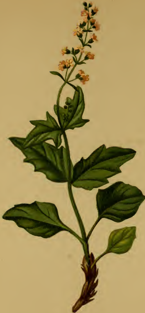
Valeriana elongata L. — Verlängerter Baldrian.

Tirol bis Oesterreich und Krain, trockene Stellen, 1600–2000 M., auf Kalk, Juli, August.