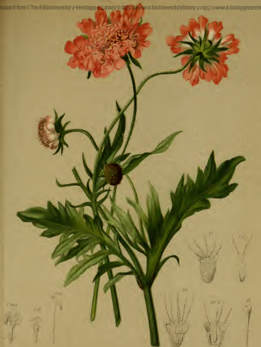
Scabiosa lucida Vill. — Glänzendes Krätzenkraut. Alpenkette, Wiesen, 1500—2100 M., bes. auf Kalk, Juni — September.