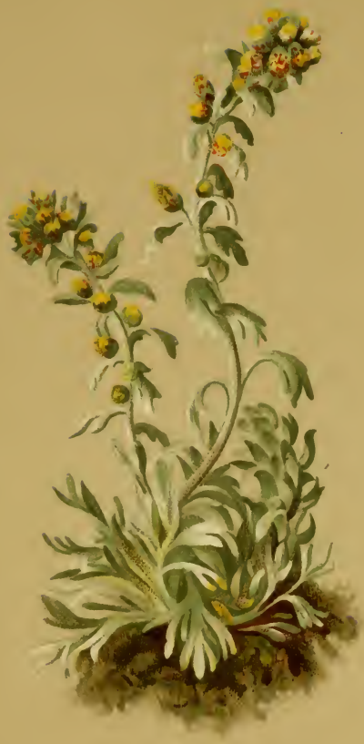
Artemisia spicata . Wulf. — Aehriger Beifuss.

Sudl. Schweiz bis Steiermark, trockene Stellen, 1800—2500 M. auf Urgestein. Juli, August.