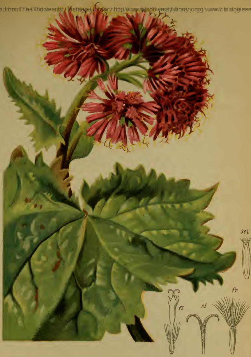
Adenostyles alpina (L.) Bl. & Fing. — Alpen-Drüsengriffel.

Alpenkette, auf Kalkboden, 1000—1600 M. Juli, August.