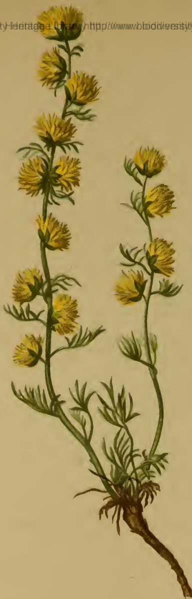
Artemisia nitida Bertol. = lanata Koch & aut., nec Willd. — Glänzender Beifuss.

Südtirol, trockene Stellen, 1600–2000 M., auf Kalk, Juli, August.