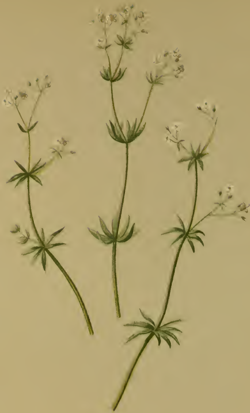
Galium Austriacum Jacq. = silvestre Poll. 1776 var. \alpha glabrum Koch = commutatum Jord. 1846 — Oesterreichisches Labkraut. Südtirol bis Oesterreich und Steiermark, trockene Stellen, bis 1600 M., Juni–September.