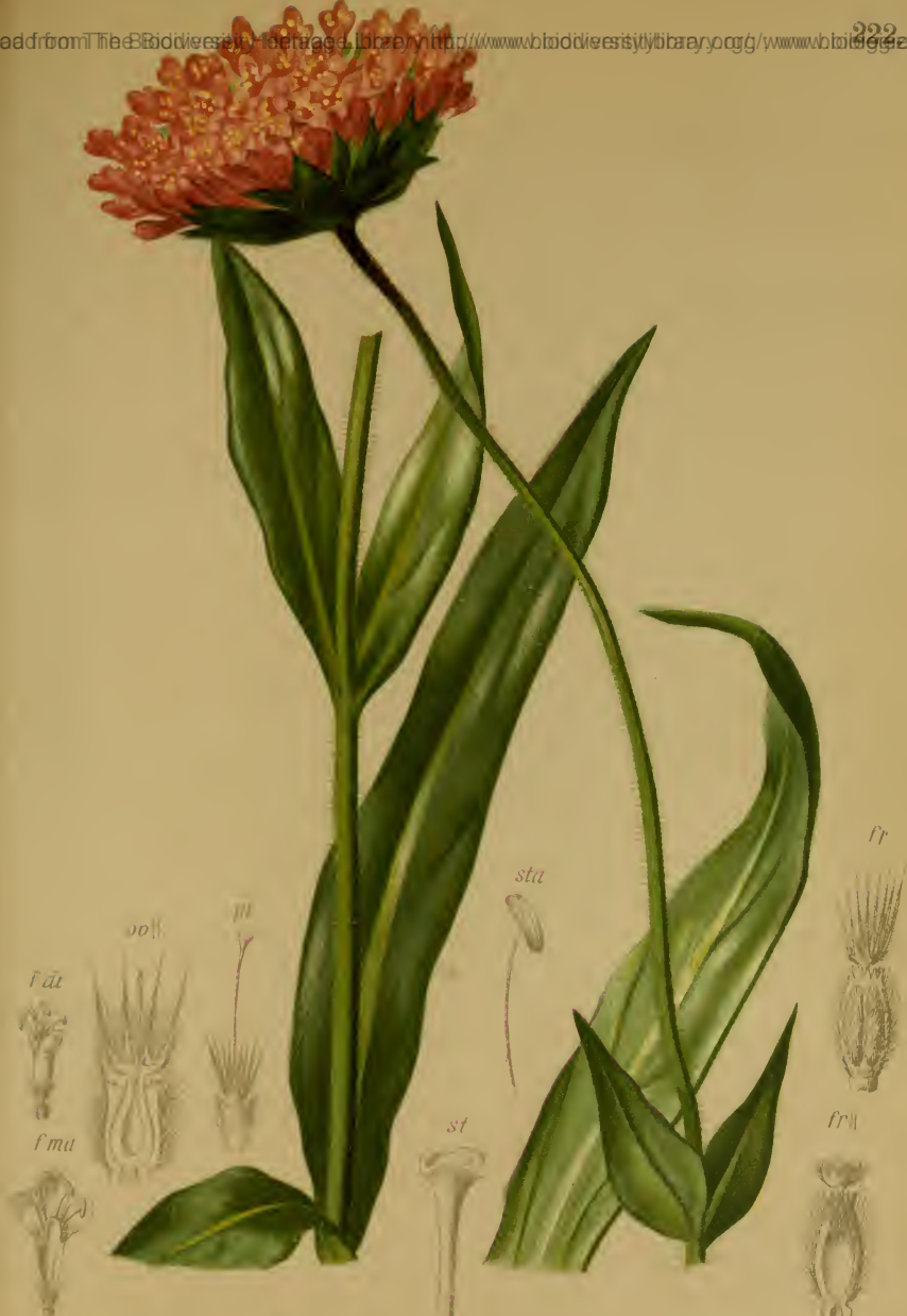
Knautia longifolia (Waldst. & Kit.) Koch — Langblättrige Knautie, Witwenblume.

Tirol bis Steiermark und Oesterreich, Wiesen, 1300—1600 M., Juli, August.