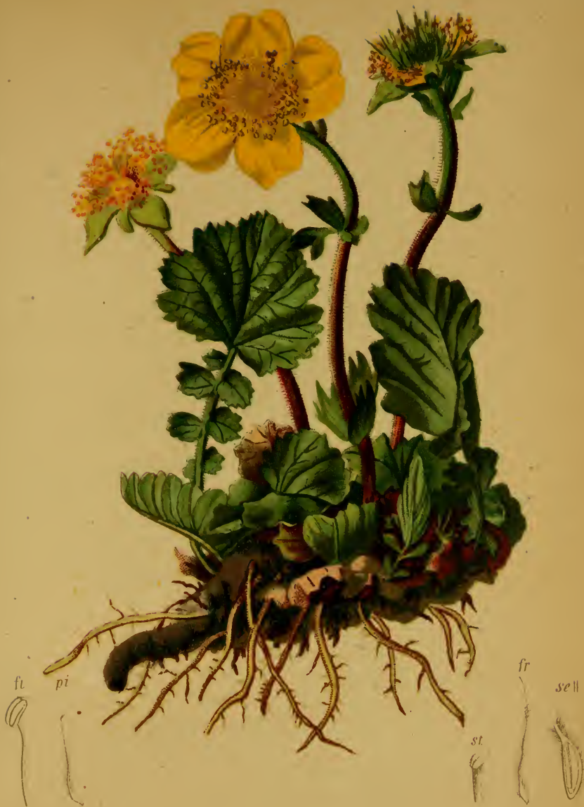
Geum montanum L. — Berg-Benediktenkraut.

Alpenkette, auf Alpenwiesen. 1200—2300 M. Juni, Juli.