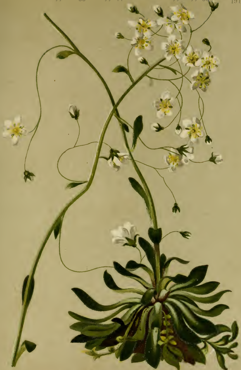
Saxifraga crustata Vest. — Krustiger Steinbrech.

Tirol bis Krain. 900—2200 M auf Kalk. Juli, August.