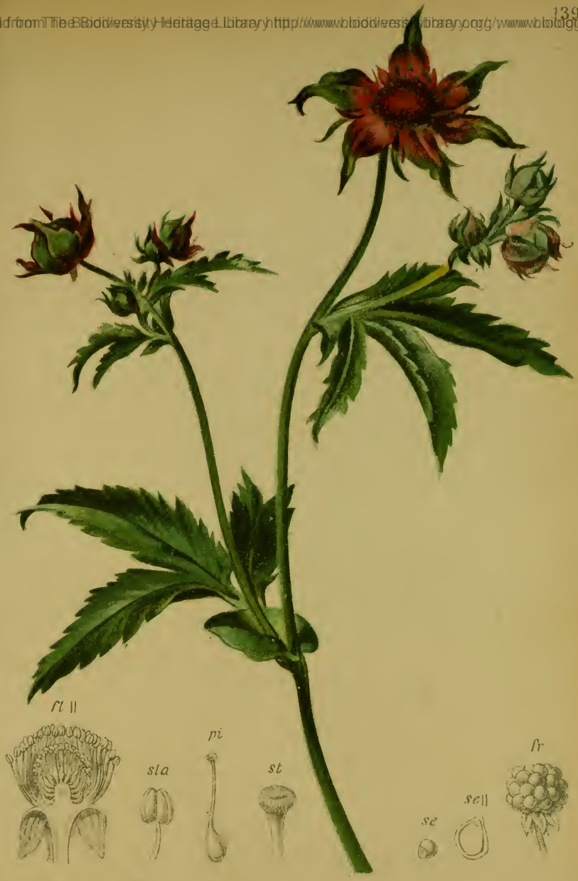
Comarum palustre L. — Sumpf-Blutauge.

Alpenkette, feuchte Stellen, bis 1600 M. Juni--August