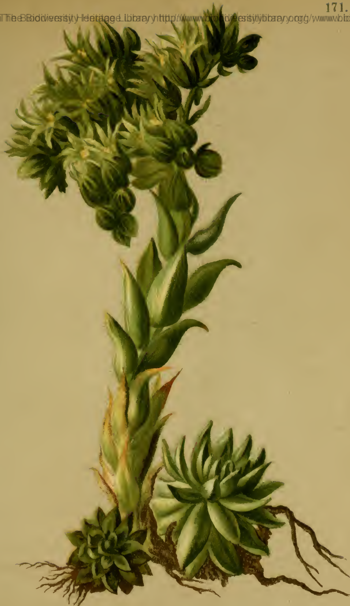
Sempervivum hiatum L. — Kurzhaarige Hauswurz. Tirol bis Oesterreich, trockene Stellen, um 1500 M., Juli–September.