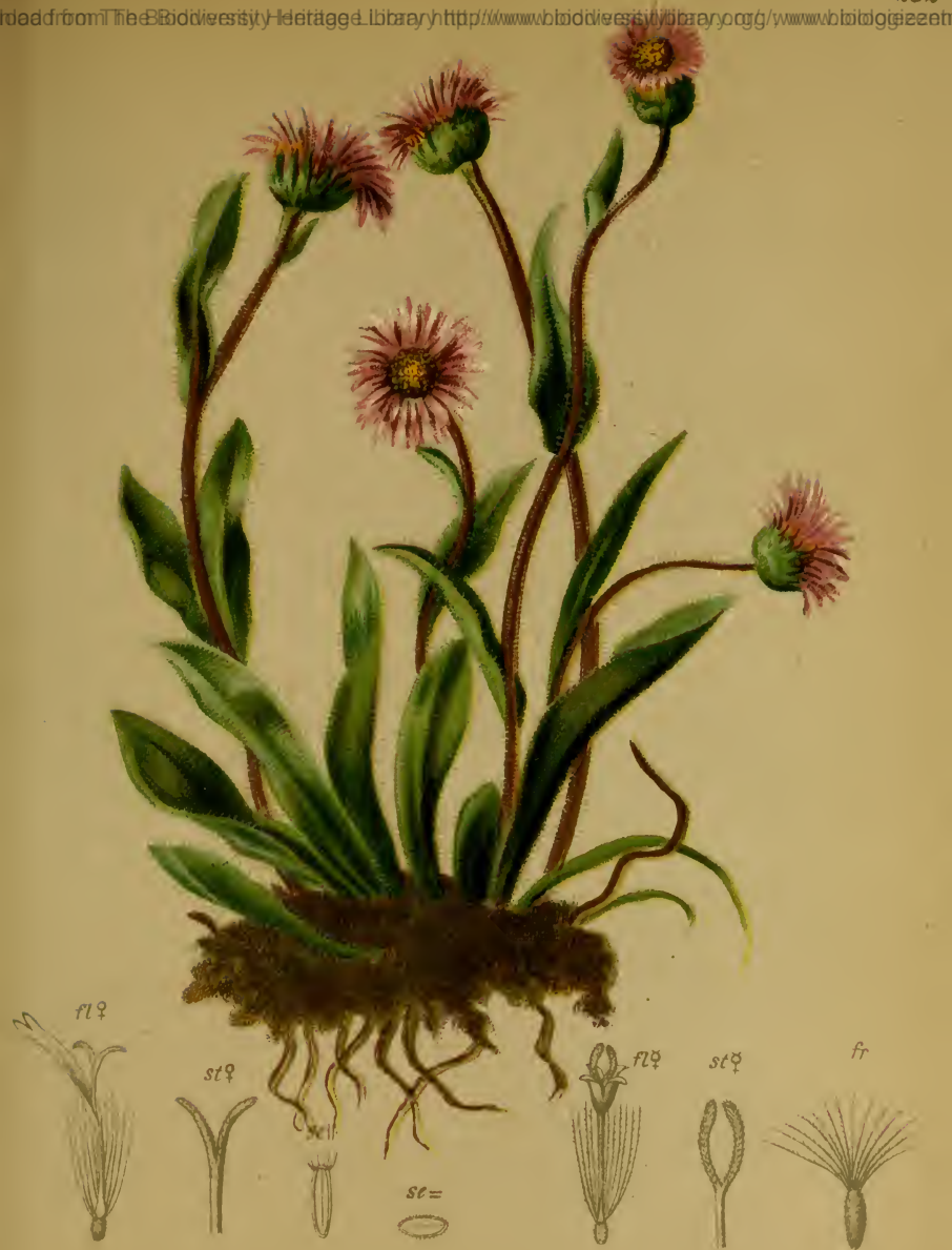
Erigeron alpinus L. — Alpen-Berufskraut.

Alpenkette, auf Gerölle, 1200—1860 M. Juli, August.