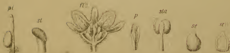
Sibbaldia procumbens L. — Niederliegende Sibbaldie, Gelbling. Alpenkette, Wiesen, 1600—2200 M., besonders auf Urgestein, Juni, Juli.