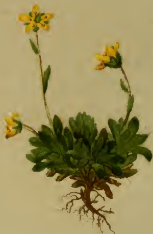
Saxifraga Seguieri Spreng. — Seguer's Steinbrech. Schweiz und Tirol, Gletscher, 2700–3200 M., Juli, August.