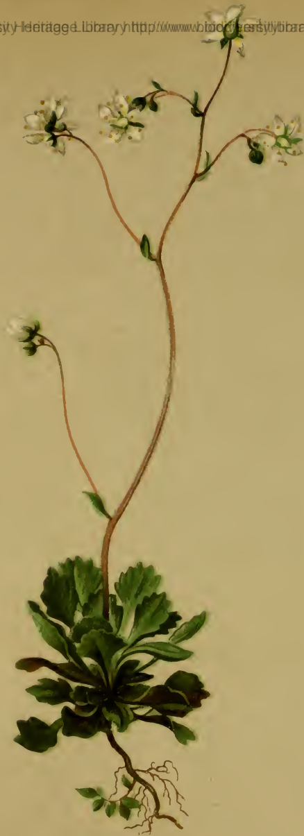
Saxifraga cuneifolia L. — Keilblättriger Steinbrech.

Alpenkette, feuchte Stellen, 1000—2000 M., Juni, Juli.