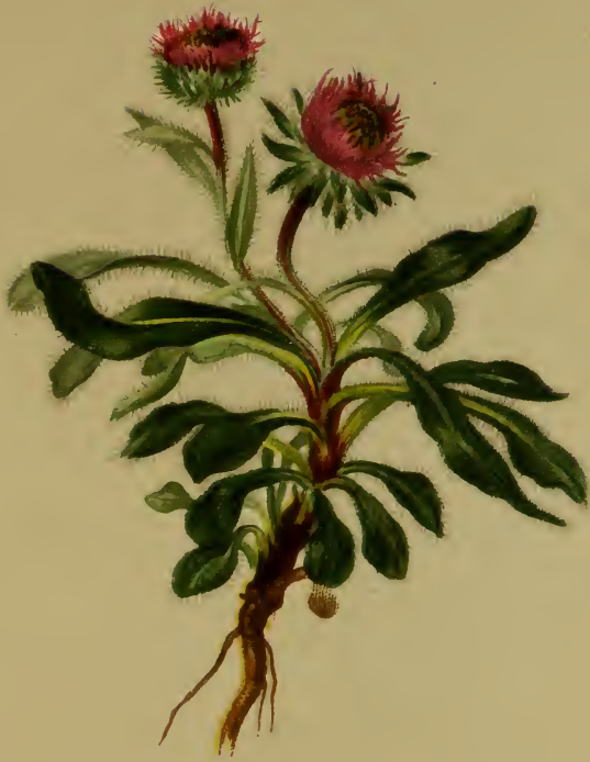
Erigeron uniflorus L. — Einblüthiges Berufkraut.

Alpenkette, auf Urgestein, 1900—2500 M. Juli, August.