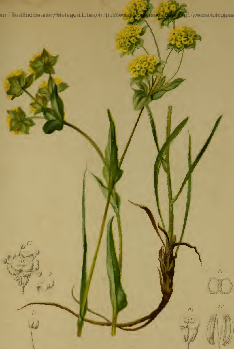
Bupleurum petraeum L. = graminifolium Vahl. — Felsen- Hasenohr.

Südtirol bis Krain, trockene Stellen, 1600—2300 M., Juli, August.