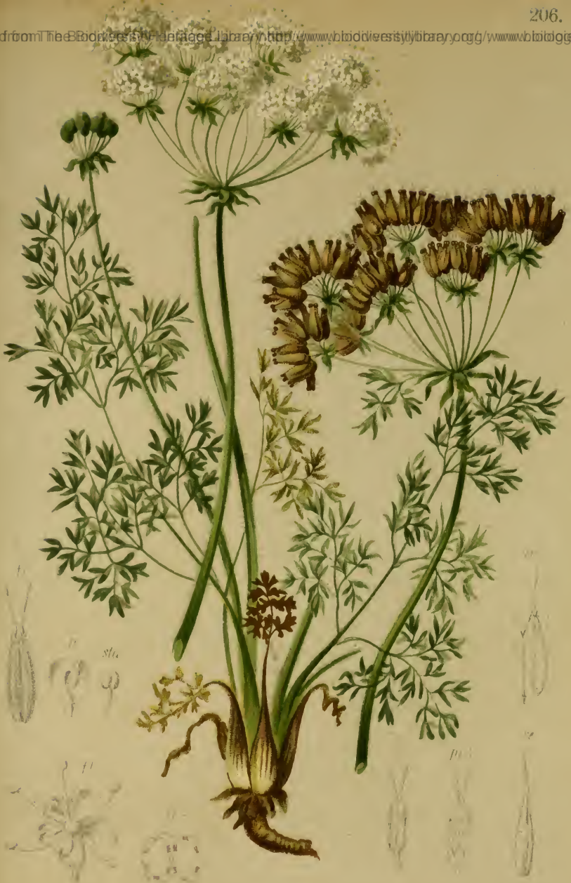
Athamanta Cretensis L. — Kretische Augenwurz. Alpenkette, 1300–2300 M., auf Kalk, Juni–August.