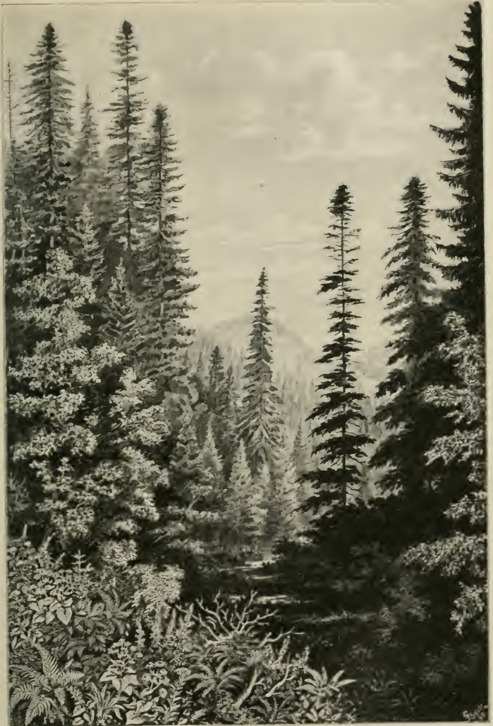
Voralpiner Mischwald auf der Stozer-Planina (Bosnien).

(Nach einer Originalzeichnung des Verfassers.)