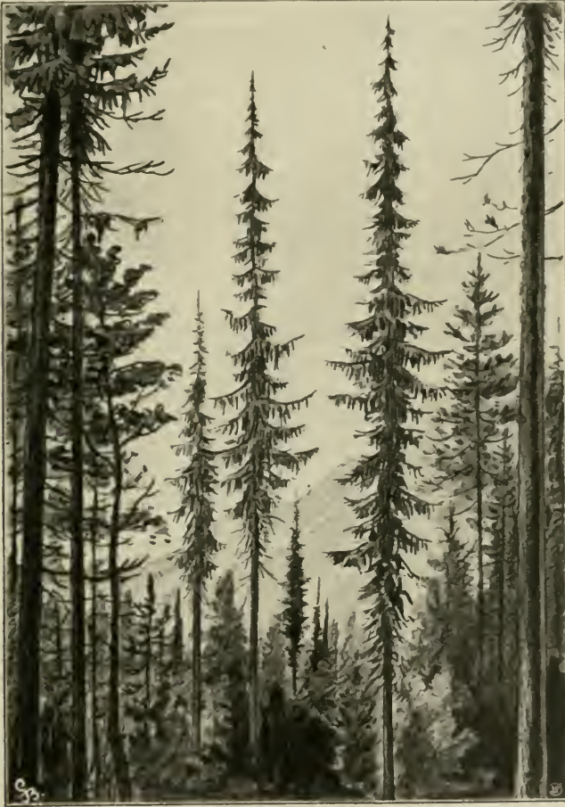
Fig. 11. Picea Omorica im Walde bei Medena luka nächst Semeč in Bosnien. Eingestreut Picea vulgaris , Pinus gra , Fagus silvatica . (Nach einer Photographie.)

Aber selbst das westliche Areal zeigt nur eine äußerst geringe Ausdehnung. Es erstreckt sich von 44^{\circ} 1' bis 43^{\circ} 27' n. Br. und von 17^{\circ} 35' bis 19^{\circ} 50' ö. L. von Greenwich. Das einzige ziemlich zusammenhängende, etwa 25 km lange Bestockungsgebiet 1) liegt zwischen den zur Drina abfallenden Abhängen des Semeč bei Višegrad und den Südgehängen der Javor-Planina