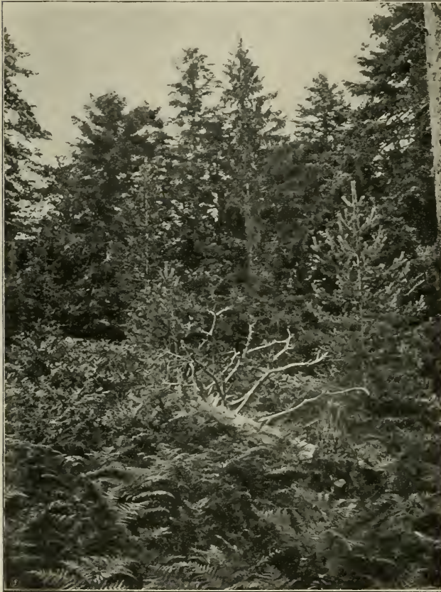
Fig. 4. Mischwald am Smolin in Bosnien. Als Gehölz: Fagus silvatica , Picea excelsa , Abies alba , Pinus sylvestris . Vorn Pteridium -Gestrüpp.

sich die Schwarzföhre öfters auch noch mit der Tanne; endlich im Vrbasthale von der Grabovica bis zur Lisina sind Föhren, Fichten und Rotbuchen in Mengewäldern vereinigt. Auch mit Eichen zeigt sich die Schwarzföhre öfters vermengt. Im Višegrader Bezirke, gegen die serbische Grenze zu, kann man Wälder aus Föhren, Rotbuchen und Eichen beobachten, ebenso im Rudenikforste an der Spreča und auf dem Ozren bei Maglaj, an letztgenanntem Orte