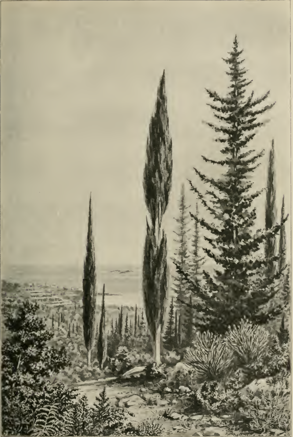
Cypressen- ( Cupressus sempervirens ) Hain bei Orebić auf Sabioncello.

(Nach einer Originalzeichnung des Verfassers.)