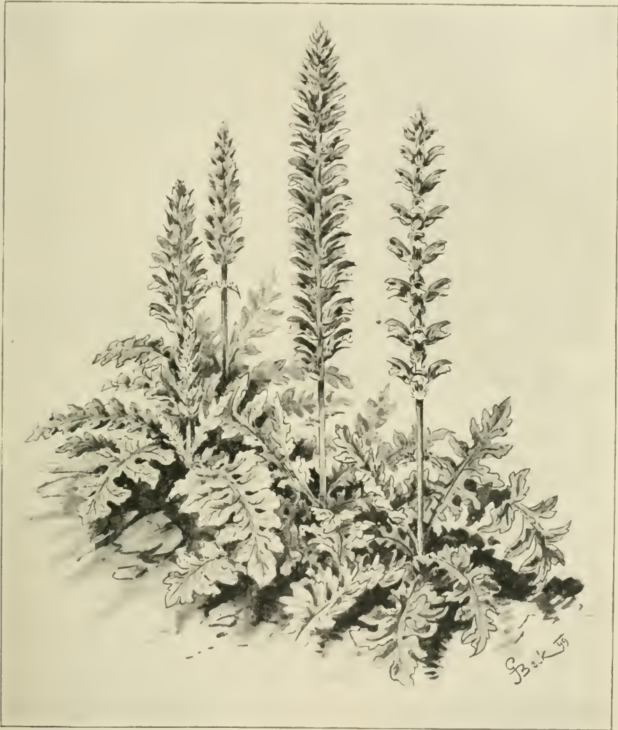
Fig. 7. Acanthus longifolius . (Nach einer Originalzeichnung des Verfassers.)

Die unter der Saat vorkommenden Unkräuter, welche in der nachfolgenden Liste hervorgehoben werden, sind zumeist mit jenen Mitteleuropas identisch.