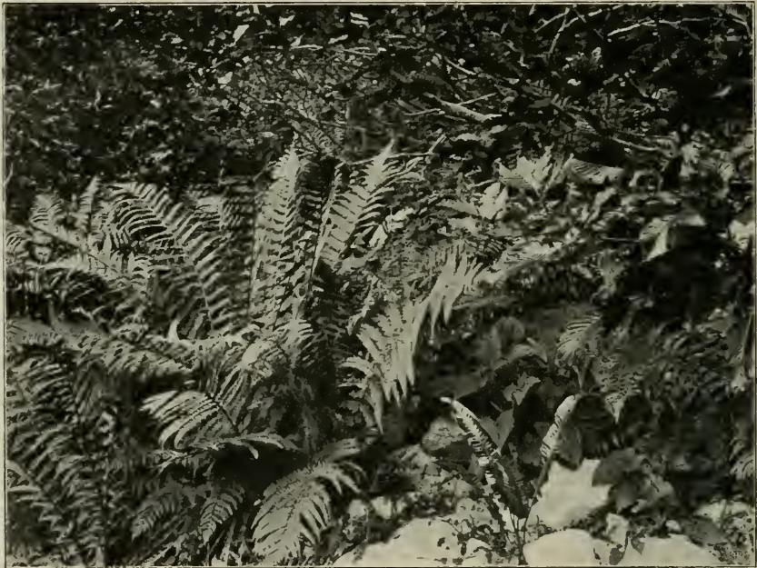
Fig. 10. Niederwuchs unter einem Busche von Rhamnus fallax im voralpinen Mischwalde auf der Plaša-Planina. Aspidium lobatum , A. Filix mas , Salvia glutinosa , Scolopendrium vulgare .

Auf den ostserbischen Gebirgen, wo sich der Voralpenwald über einem schon mit Voralpenpflanzen durchsetzten Buchenwalde in einer Höhe von 1300 bis 1400 m entwickelt und noch jungfräulichen Urwald darstellt, giebt es (nach