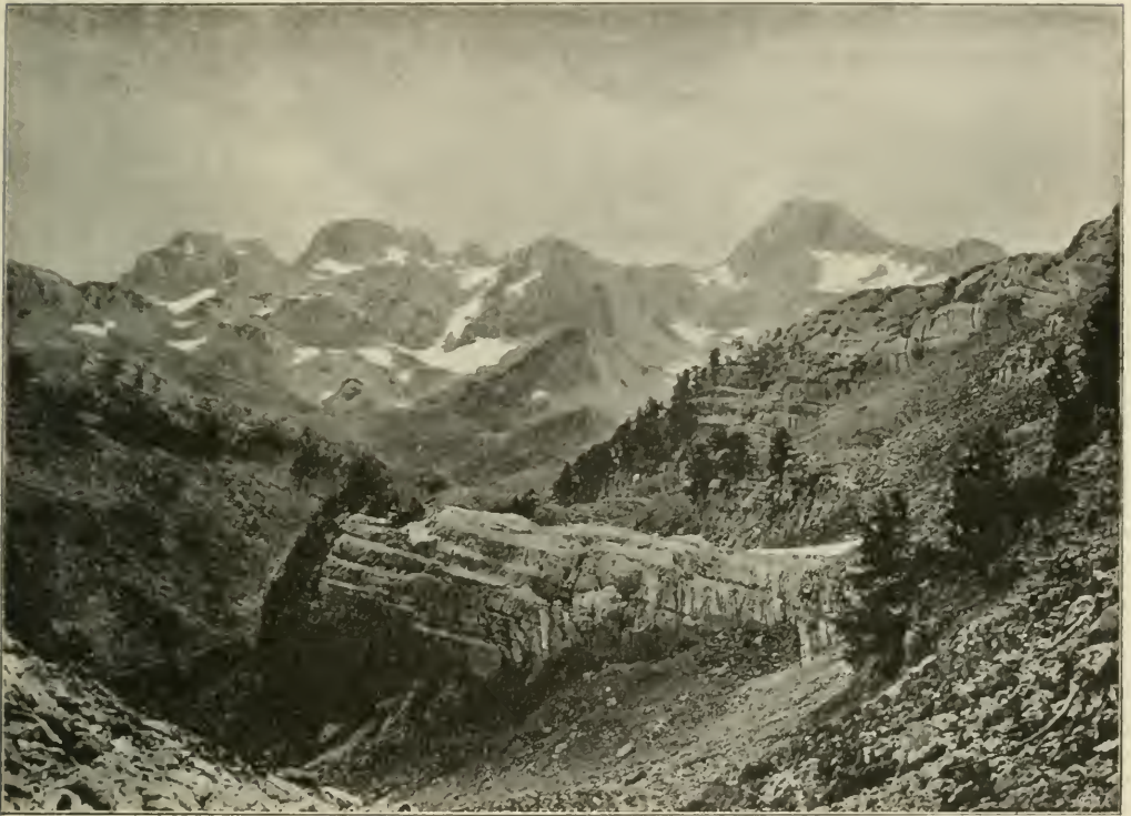
Fig. 15. Die Lupoglav-Gruppe (2102 m) in der Prenj-Planina von Nordwest. Das Kar und die steinig und felsigen Gehänge sind mit Felsenvegetation besetzt. Gegen den Vordergrund letzte Stände der Pinus leucodermis .

wände und Gesteinstrümmer zerstückelten Beständen die für die Hochalpenregion der illyrischen Gebirge bezeichnendsten Gewächse. Sie ist zwar reich an Arten, aber die Individuen sind nicht zahlreich; daher zeigt die Felsenvegetation eine große Abwechslung in ihrer Zusammensetzung. Die Arten wechseln nicht nur nach den Gebirgen, wie noch später erläutert werden wird, sondern selbst von Fels zu Fels, was dazu führt, dass einzelne Arten oft nur auf sehr beschränkten Localitäten sich angesiedelt resp. erhalten haben, sonst aber trotz geeigneter Besiedlungsstellen weit und breit fehlen.