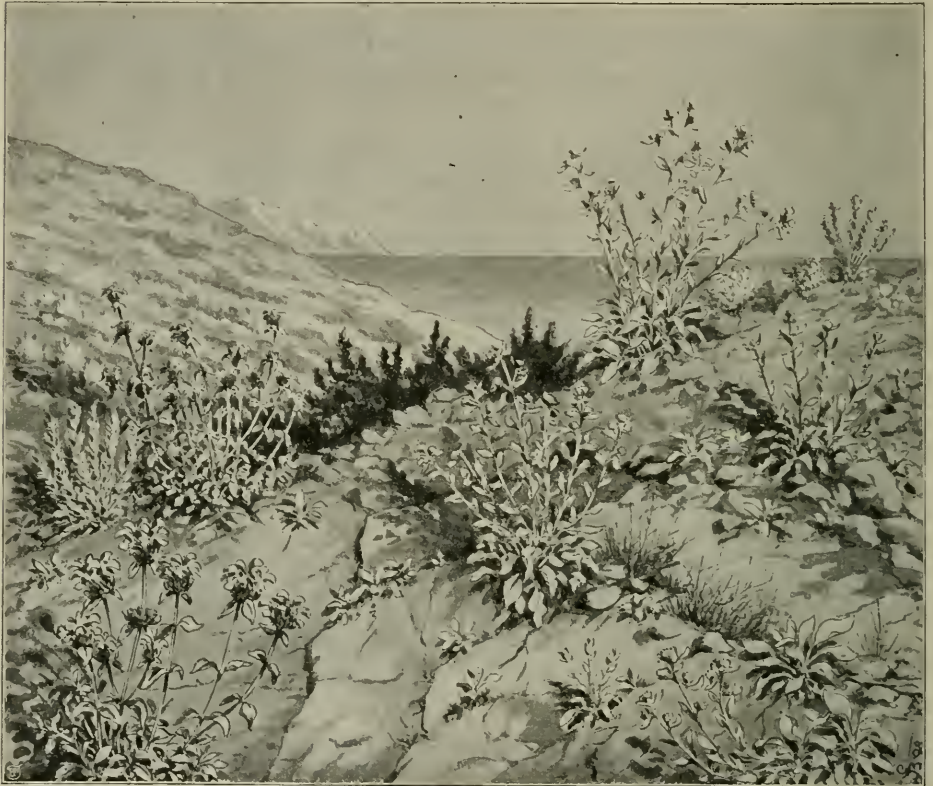
Fig. 2. Dalmatinische Felsheide bei Ragusa. Inula candida , Brachypodium ramosum (rechts); Phlomis fruticosa (links); in der Mitte Büsche von Juniperus oxycedrus . (Nach einer Originalzeichnung des Verfassers vom 3. Juni 1894.)

Nur an wenigen Punkten bietet sich die Steinheide in ihrer ursprünglichen, unangetasteten Gestalt dar. Dort entbehrt sie niemals eines zerstreuten Strauchwuchses, welcher zu einem Teile aus sommergrünen, zum anderen Teile aus