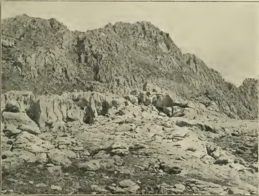
Fig. 18. Erodierete Kalkfelsen mit Felsenvegetation im Velebit-Gebirge an der Passstraße oberhalb Prag, bei 950—1127 m ü. M.

Am Koziak teilt sie in einer Seehöhe von 700—780 m ihren Wohnsitz auf steilen, fast lotrecht über die mediterrane Vegetation sich erhebenden Felswänden mit einigen Hochgebirgspflanzen, wie Vesicaria graeca , Anthyllis Jacquini , Globularia cordifolia var. bellidifolia , und zahlreichen mediterranen Felsgewächsen, wie Ephedra campylopoda , Allium subhirsutum , Quercus Ilex , Euphorbia Wulfeni , Campanula pyramidalis , Cephalaria leucantha , Chrysanthemum cinerariifolium und Inula candida . Mit diesen Gewächsen kommen auf den Felswänden noch vor: Aethionema saxatile , Alsine verna , Saxifraga tri-dactylites , Cytisus argenteus , Astragalus Muellerei , Genista pulchella , Hedrae-anthus tenuifolius und Valeriana tuberosa .