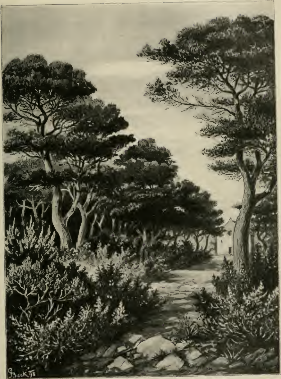
Strandföhren- ( Pinus halepensis ) Wald bei Ragusa (Lapad).

(Nach einer Originalzeichnung des Verfassers.)