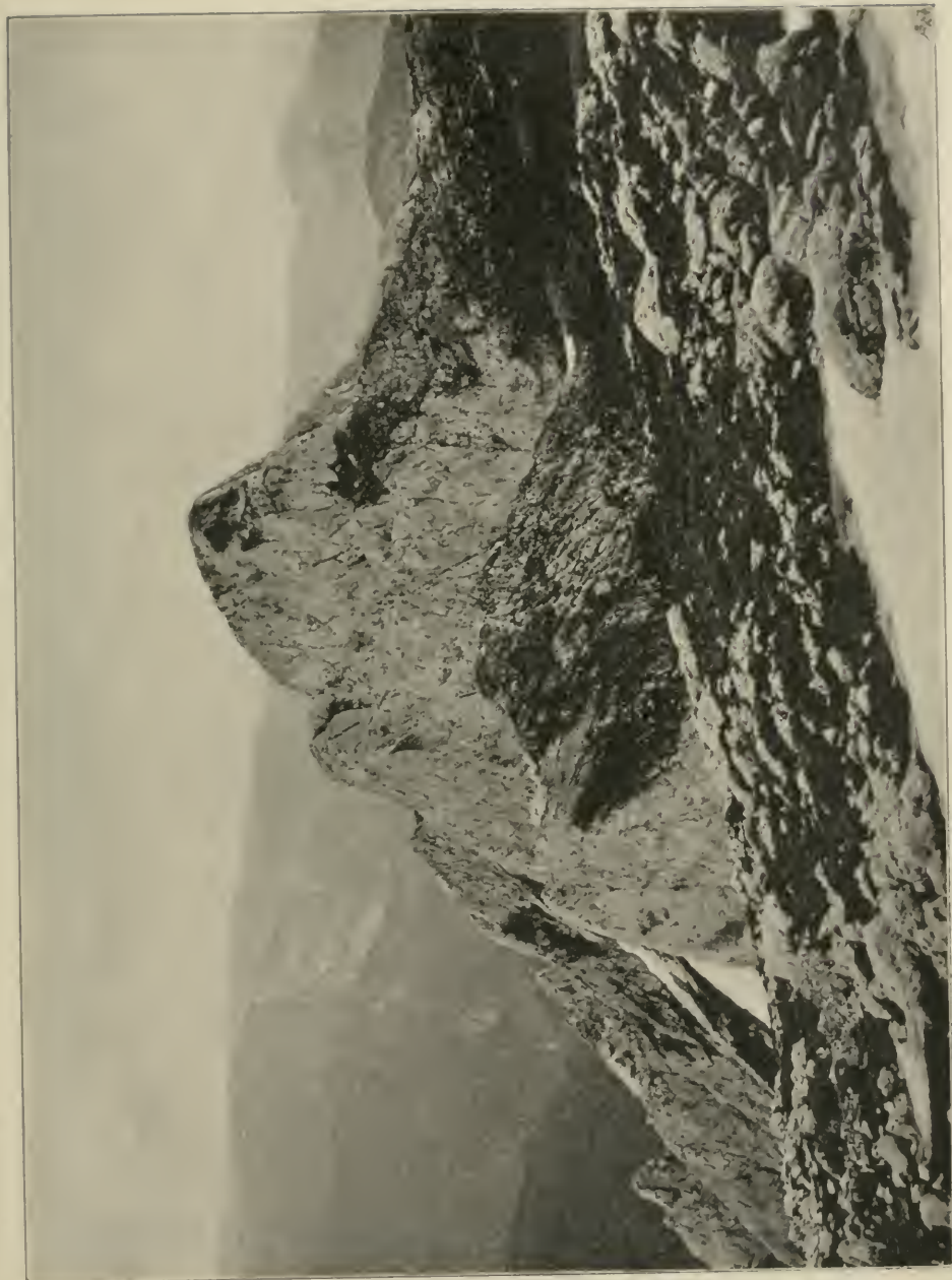
Der Gipfel des Maglić (2387 m), Bosniens höchste Bergspitze.