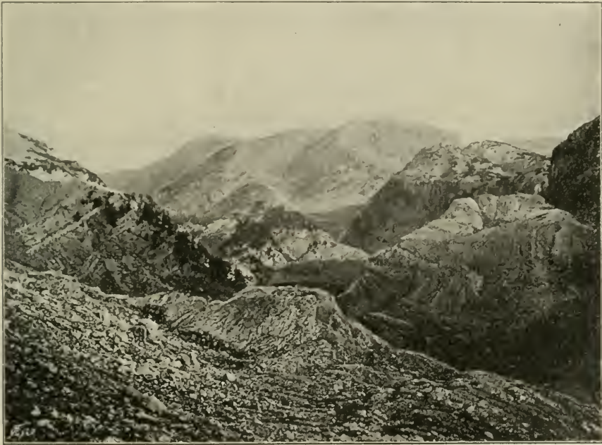
Fig. 16. Der Prenj-Gipfel (1916 m) in der Prenj-Planina von Südosten. Im Kar sowie auf den steinigen Triften und Felsen findet sich Felsenvegetation. Im Mittelgrunde Bestände von Pinus Mughus (u. var.) sowie von Pinus leucodermis .

Fast alle anderen Felspflanzen sind xerophytisch gebaut. Die Felsgräser zeigen borstig-pfriemliche Blätter mit mächtigen Bastbündeln und Einfaltungs- oder Einrollungs-Mechanismus; Gewächse mit stark entwickelter Cuticula, mit lederartigen, derben, kalk- und wachsüberzogenen Blättern sind besonders häufig, wie bei der Mehrzahl der Arten der Gattungen Saxifraga , Draba , Soldanella , Gentiana , Hedraeanthus u. a.