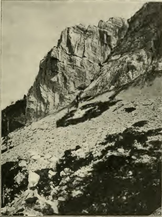
Fig. 13. Vegetation des Felschuttes unter den Felswänden des Troglav in Bosnien. 1400—1500 m ü. M. Vorn und in der Mitte Bestände von Juniperus nana , Pinus Mughus ( pumilio ), Spiraea oblongifolia und vereinzelt Fichten ( Picea vulgaris ) in aufsteigender, unter den Felswänden voralpine Ständen und Kräuter in absteigender Entwicklung.

Spalten und Risse aufweisen. Auffällig werden diese Föhrenpartien besonders dann, wenn sie die Spalten steil aufrichteter Schichtenköpfe und die solchermaßen geschichteten Felsabstürze mit dunklen Bändern besetzen, wie es überaus charakteristisch im Prenj 1) , Čvrstnica-, Dinara- und Troglav-Gebirge ausgeprägt ist.