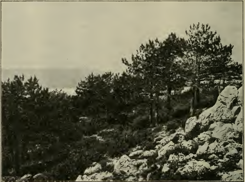
Fig. 1. Schwarzföhren ( Pinus nigra ) mit mediterranem Unterholz ( Juniperus Oxycedrus , Erica verticillata , Genista dalmatica ) auf dem Monte Vipera der Halbinsel Sabioncello. Vom Felsheide mit Büschen von Salvia officinalis .

Am augenfälligsten ist diese Vereinigung auf den Gebirgen der Halbinsel Sabioncello, dann auf dem culminierenden Höhenrücken der Insel Brazza, dem Monte St. Vito (778 m) und wahrscheinlich auch an den Abhängen des Biokovo bei Brela und Bast. An den beiden erstgenannten hatte der Verfasser Gelegenheit, die Formation eingehend zu studieren (vergl. BECK, 17, S. 40 f.). Auf dem Monte Vipera, dem höchsten Gipfel der Halbinsel Sabioncello (961 m), trifft man von etwa 700 m angefangen, im felsigen Kalkterrain, inmitten von tausenden Exemplaren der Salvia officinalis , die ersten zerstreut stehenden Schwarzföhren an. Höher hinauf vereinigen sie sich sodann zu schönen Gruppen, endlich zu ausgedehnteren Beständen, die bei ca. 900 m ihr Ende erreichen.