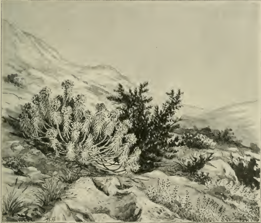
Fig. 3. Dalmatinische Felsheide bei Cattaro. Euphorbia Wulfeni mit einem Strauche von Punica Granatum . Vorn erodierte Kalkfelsen mit Brachypodium ramosum (links) und Salvia officinalis (rechts).

Gewässern zu lieben. Das erhellt aus der Thatsache, dass sie nicht nur alle Felsgehänge an der Meeresküste in unglaublichen Mengen besiedelt, sondern mit Vorliebe den lebenden Wasserläufen bis tief ins Innere des Festlandes folgt. Krka aufwärts geht sie massig bis in das Becken von Knin, wo sie noch beim Krkie-Wasserfalle nächst Topolje in größerer Menge die felsigen Thalgehänge besiedelt. Gleiches Vorkommen beobachtete ich in der Čikola-Schlucht bei Drnis, an der Zrmanja bei Obrovazzo und wiederholt sich an der Cetina und