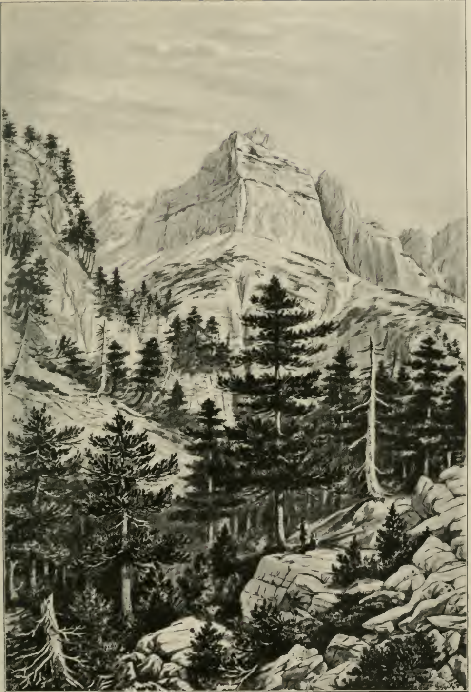
Panzerföhren- ( Pinus leucodermis -) Wald auf der Prenj-Planina (Hercegovina).

(Nach einer Originalzeichnung des Verfassers.)