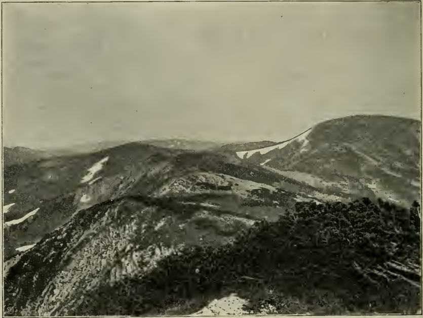
Fig. 14. Alpenmatten und Krummholzbestände ( Pinus pumilio ) auf der Vranica-Planina in Bosnien. Rechts die höchste Kuppe des Gebirges, Ločike (2107 m).

Geum montanum Potentilla aurea Trifolium badium Vaccinium Myrtillus V. Vitis idaea ! Primula glutinosa Gentiana punctata G. latifolia (excisa) G. verna Thymus alpestris Pedicularis scardica