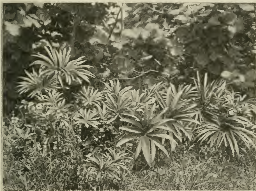
Fig. 6. Helleborus odoratus und dessen Var. multifidus in einer Karstheide bei Nevesinje (Heregovina). Im Hintergrunde ein Busch von Corylus Avellana . (Nach einer Originalaufnahme des Verfassers vom 22. Juni 1894.)

Ganz gleiche Verhältnisse trifft man in Südkroatien. Kaum hat man den Karstboden bei Dugaresa nächst Karlstadt betreten, so wechseln steinige Böden und wiesige Karstflächen mit Culturen und ausgedehnterem Buschwalde ab, dem sich erst an den Gehängen der höheren Berge mächtige und ausgedehnte Waldmassen anschließen. Aber schon auf den Abstürzen zum Quarnero, insbesondere aber auf den zur Küste steil abstürzenden Gehängen des Velebitzuges, dem sogenannten Seekarst, zeigen sich jene vegetationsarmen, kahlen, schaurig öden Steinheiden, welche in trostloser Einformigkeit das ganze dalmatinische Bergland, das bosnische Hinterland bis zur Wasserscheide der Adria und des Schwarzen Meeres sowie den größten Teil der Heregovina und