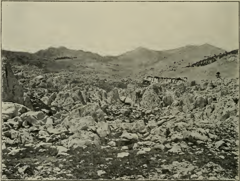
Fig. 17. Steinige Hochgebirgstriften mit Felsenvegetation auf der Plaša-Planin, gegen den Trinača-Gipfel (2045 m). Im Hintergrunde zerstückelte Bestände von Pinus leucodermisa in der Mitte eine Alpenhütte (stan).

Auf den Hercegoviner und montenegrinischen Bergen zeigen sich wieder andere, und zwar sehr auffällige voralpine Felspflanzen. Moltkia petraea ist mit ihren herrlich cyanblauen Blumen ein besonderer Schmuck steiler, öder Felsmassen. Ihre Polster sind zwar am schönsten in den Felsmauern der Voralpenregion entwickelt, aber sie scheuen selbst die Nähe des Meeres nicht