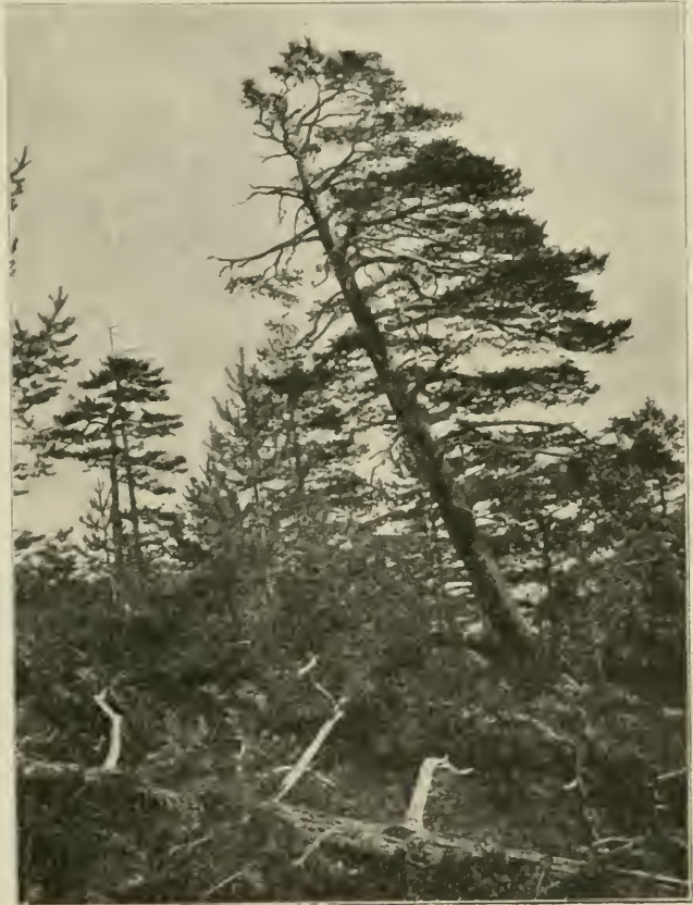
Fig. 5. Kiefern-Formation auf der Hohe des Smolin (1149 m), in Bosnien. Pinus nigra und P. sylvestris . Im Niederwuchse Daphne Blagayana , Erica carnea , Rosa alpina , Epimedium alpinum , Pteridium aquilinum .

An diesen Stellen, wo sich die pflanzengeographisch interessante Königsblume ( Daphne Blagayana ) der Erika als treue Gesellin anfügt und die Viola Beckiana an den freieren Stellen sich dazwischen ansiedelt, mag man bei der Frage in Zweifel geraten, ob sich hier nicht eine eigentümliche, nur nebenbei mit Schwarzföhren besetzte Strauchformation zur Selbständigkeit emporgeschwungen habe. Der reichliche Föhrennachwuchs, die die Föhren auch in tieferen Lagen der Serpentinberge stetig begleitende Erica 1) , das stets verschiedenartige Auftreten der Daphne Blagayana als Glied anderer Formationen ließen den Gedanken an einen besonderen Typus der Schwarzföhrenformation das Übergewicht gewinnen. In diesem aber verdient die Königsblume ( Daphne Blagayana , »smilje«, »jaglika«, »drijenak«, »borica«) besondere Aufmerksamkeit.