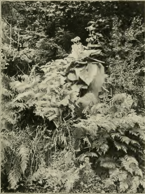
Fig. 9. Vegetation am Rande einer Rotbuchenwaldlichtung auf der Stožer-Planina. — In der Mitte Telekia speciosa ; rechts Aspidium spinulosum , A. lobatum , A. Filix mas ; links Phegopteris dryopteris , Rubus hirtus , Aspidium Filix mas .

den fast unbehinderten Lichtgenuss, in herrlichen Farben erblüht. Das weiße Windbuschröschen ( Anemone nemorosa ) und Zahnwurzarten ( Dentaria bulbifera , D. enneaphyllos und die dem nordischen Buchenwalde fremde D. trifolia ) werden sich wohl zuerst bemerkbar machen. An tiefer humösen, mehr durchfeuchteten Stellen trifft man, wie in den Alpen, Unmengen von Bärenlauch ( Allium ursinum ), Lerchensporn ( Corydalis cava ), Schneeglöckchen ( Galanthus