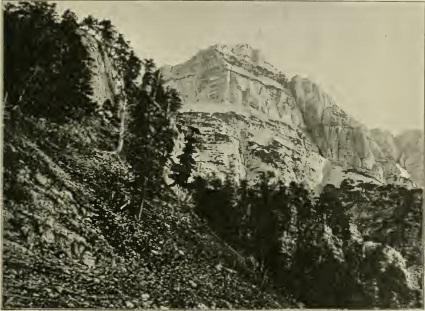
Fig. 12. Legföhren- ( Pinus pumilio -) Bestände am Herac (2019 m) bei Lučine in der Prenj-Planina. Im Mittelgrunde offene Bestände der Panzerföhre ( Pinus leucodermis ).

So wie bei allen das Hochgebirge bewohnenden Pflanzen verdient auch die untere Höhengrenze der Legföhre besondere Beachtung. Auf dem Krainer Schneeberge (1796 m), dessen Abhänge über unsere Gebietsgrenze reichen, ist nach A. VON KERNER (13, S. 116) Pinus Mughus mit Juniperus nana , Salix arbuscula und Rhododendron hirsutum noch in Höhen von 1530—1500 m angesiedelt. Sie zeigt sich aber auf den zwischen dem Krainer Schneeberge und Risnjak (1528 m) liegenden Höhen noch in viel tieferen Lagen, da sie sich nach HIRC (15) auch auf den Bergen Guslice und Med vrh in Gesellschaft von Rhododendron hirsutum , Lonicera coerulea , Salix grandifolia und Erica carnea