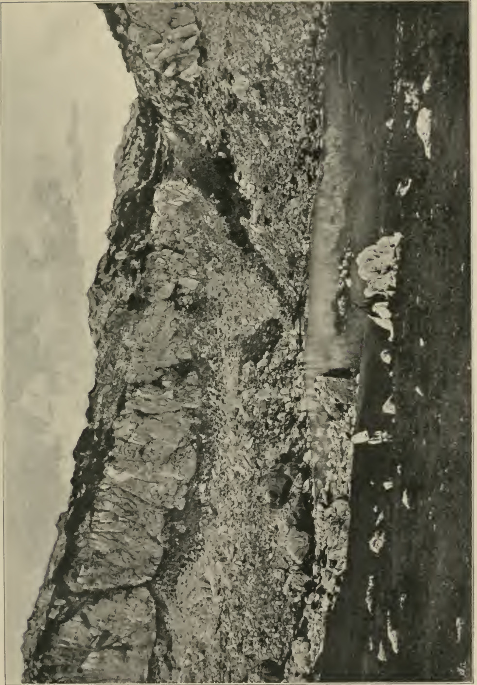
Der schwarze See (Crno jezero) in der Treskavica-Planina (1680 m).