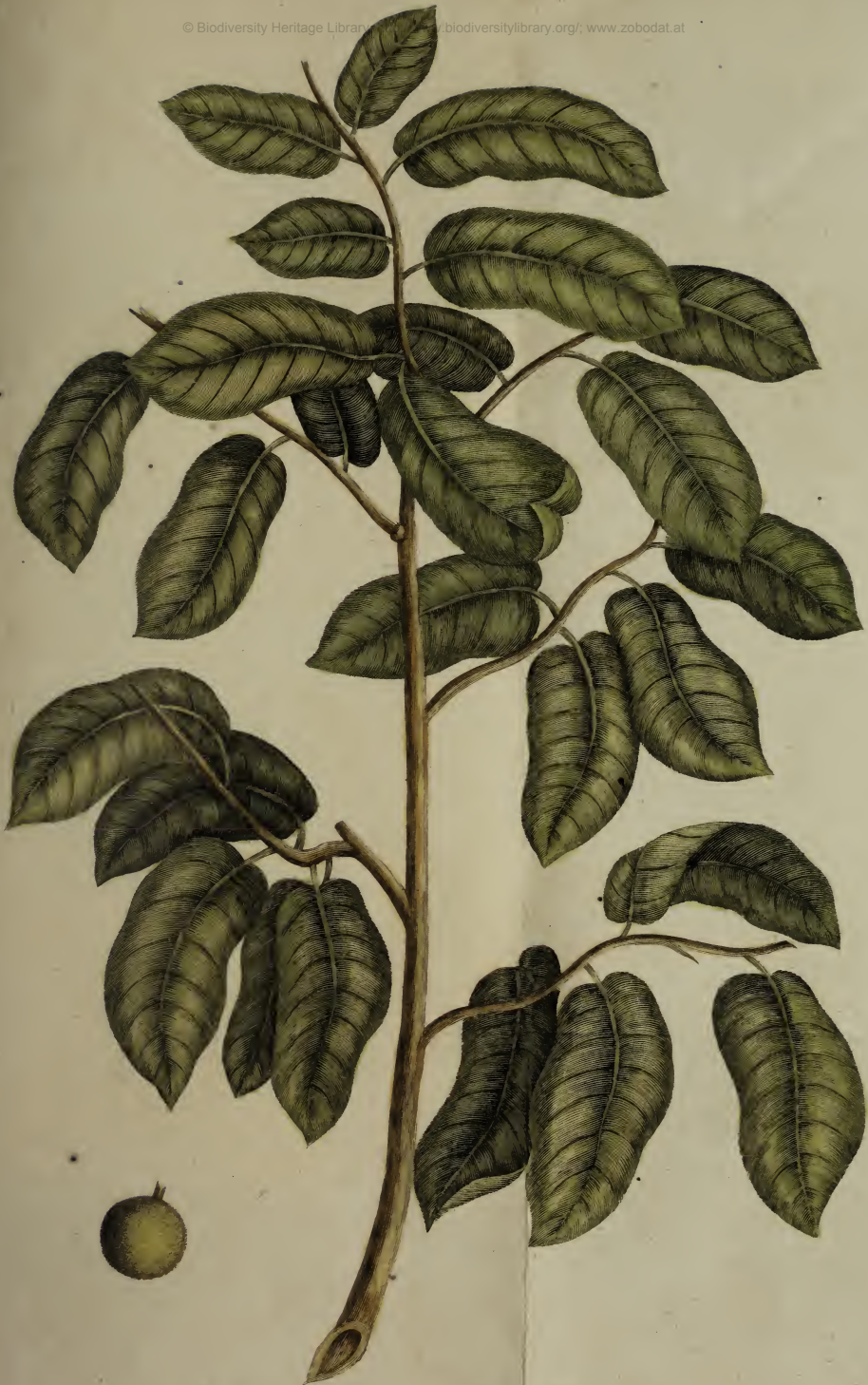
Arbor toxicaria Rumph.