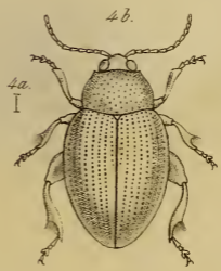
1a. b. Dibolia Cynoglossi E.H. - 2a. b. Psylliodes Dulcamarae E.H. 3a. b. Temodactyla Echii E.H. - 4a. b. Plectroscelis dentipes E.H.