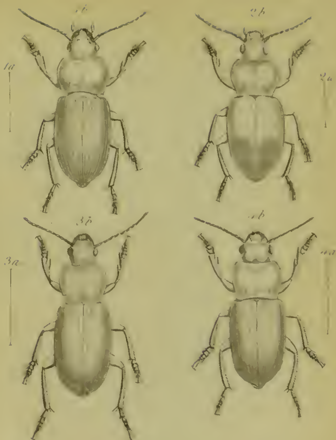
1a b Anisodactylus dimotatus F. 2a b Diachromus germanus Lin. 3a b Ophonus sabulicola Parz. 4a b Harpalus ruficornis F.