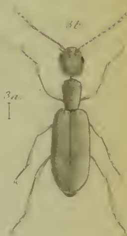
1a b Notorus monocerus Lin. 2a b Anthicus humilis Germ. 3a b Ochthenomus tenuis Oll. Koll.