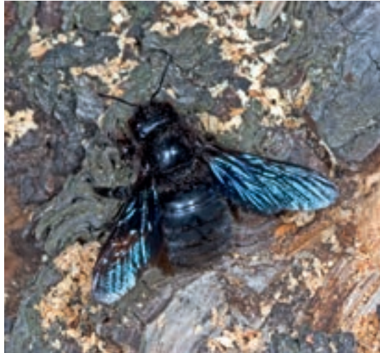
Holzbiene beim Nestbau