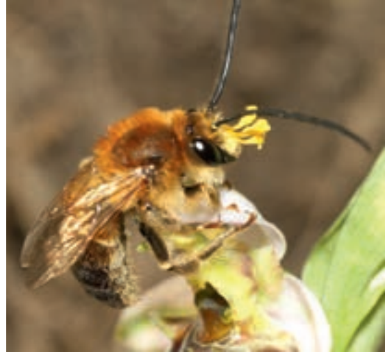
Männchen mit Pollinien