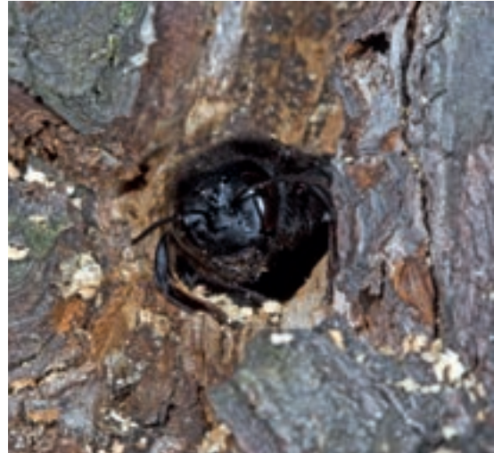
Holzbiene schlüpft aus dem Nest