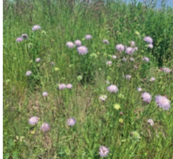
Magerwiese mit Acker-Witwenblumen