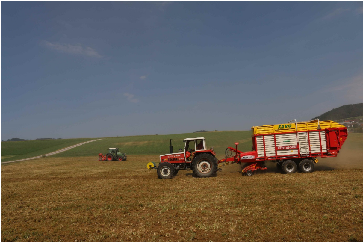
Bild 10: Hitze und Staub waren für Mensch und Technik eine Belastung.

Bild 9 und Bild 10: Der 2. Striegeldurchgang. Bei entsprechender Flächeneinteilung können die Arbeitsschritte parallel durchgeführt werden