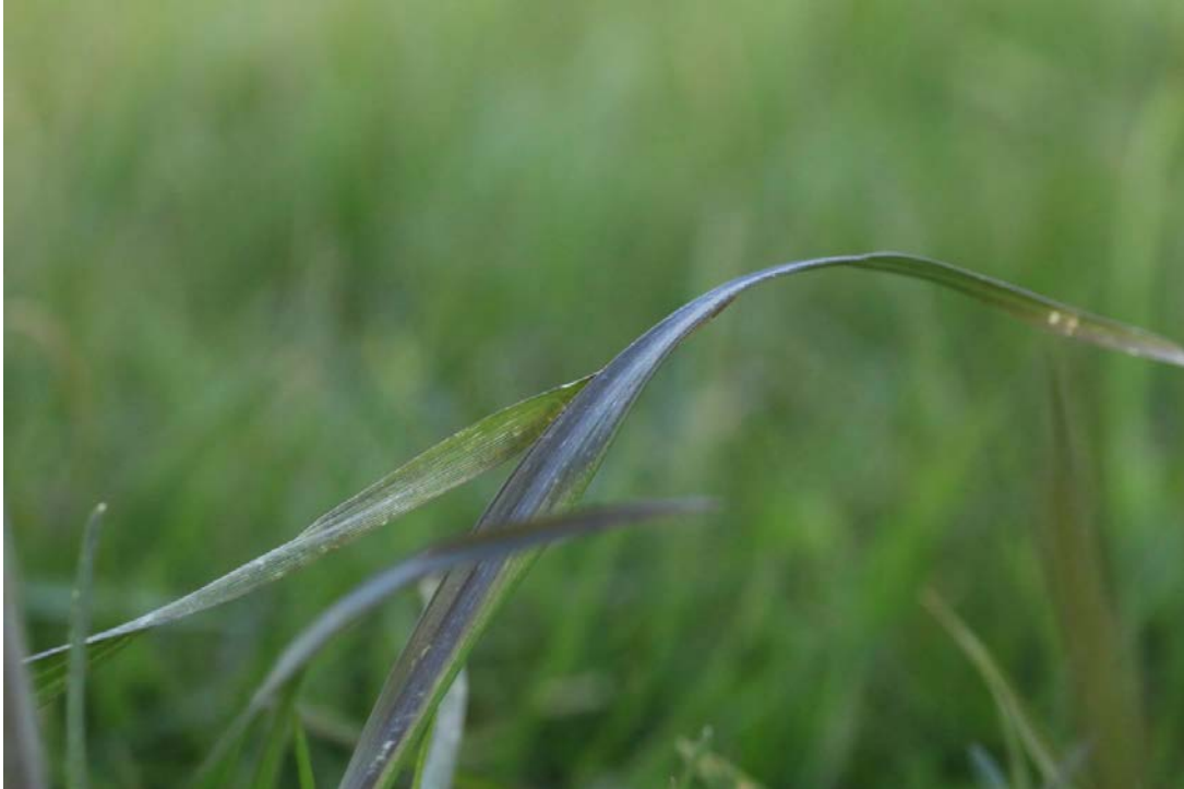
Bild 3 und 4: Die dunkle – meist ins Rot gehende – Verfärbung der Blätter mancher Grasarten wird durch längere Kälteperioden mit Frost (und heuer durch späten Schnee) verursacht.