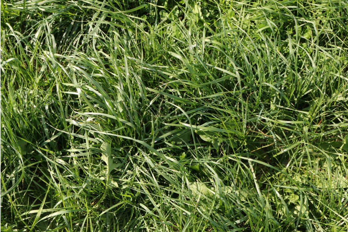
Bild 18: Unter diesem Altbestand steht die hervorragend entwickelte Nachsaat! Sie braucht dringend Licht!

Bild 17: 6 ½ Wochen nach der Sanierung: Das stehengebliebene Engl. Raygras, Knautgras und Bastardraygras konnten sich trotz Dürre und ohne Düngung hervorragend entwickeln, weil die Konkurrenz durch die Gem. Rispe weggefallen ist. Darunter steht die Nachsaat. Ein Reinigungsschnitt ist dringend notwendig!