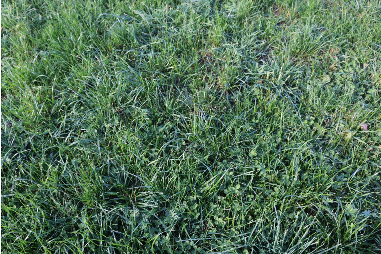
Bild 22: Die junge Nachsaat ist bereits sehr gut bestockt und damit winterfest.

Bild 21: Schöner geschlossener Bestand. Die Nachsaat hat sich dank des Reinigungsschnittes sehr gut entwickelt.