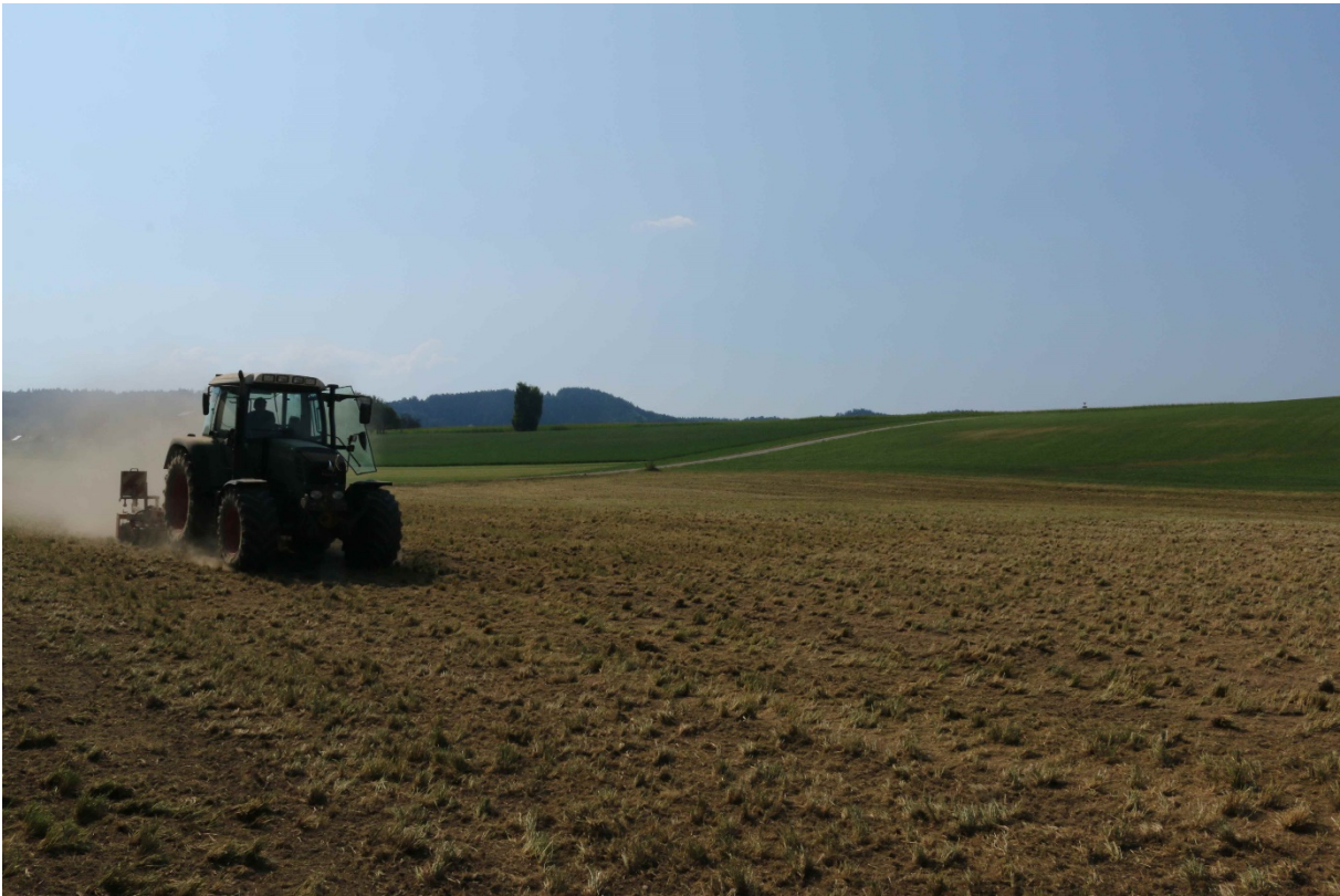
Bild 14: Die Erde und das Saatgut werden durch die voll aufliegende Güttlerwalze angedrückt.

Bild 13: Nach dem zweiten (letzten) Abräumen wird die Nachsaatmischung ausgebracht . Striegelzinken nachlaufend stellen. 30 kg/ha Saatmenge einstellen. Walze voll am Boden aufliegen lassen. Nicht zu rasch fahren, um Walzendruck sicher zu stellen.