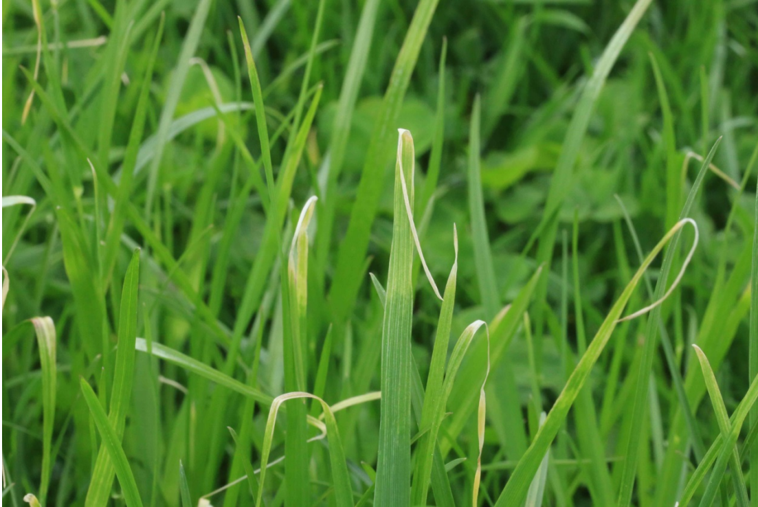
Bild 4 und 5: Siliert in der letzten Aprilwoche, bei allerdings bedenklicher Bodenfeuchte. Raum

Bild 3: Durch Spätfroste gelb verfärbte und abgestorbene Blattspitzen bei Engl. Raygras im Raum Pöndorf.