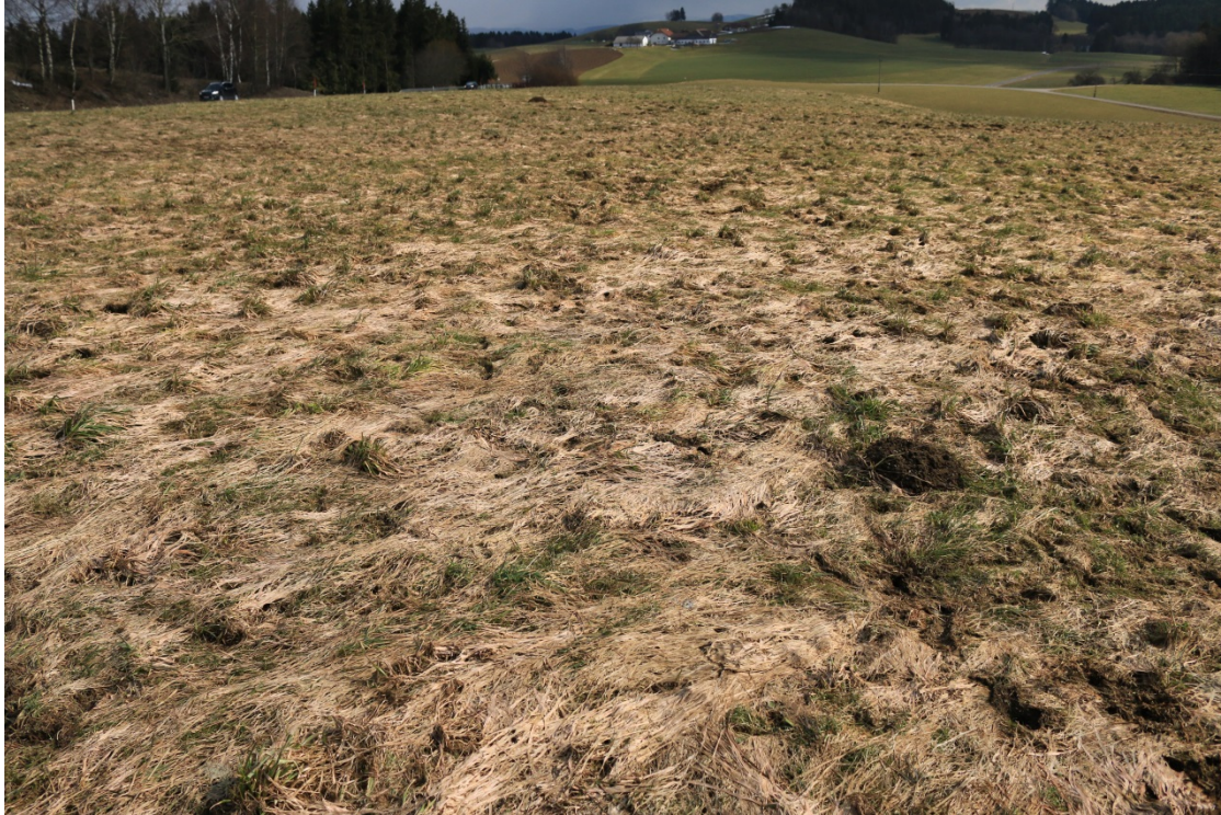
Bild 4: Der Druck des Schnees hat die Blattmasse niedergedrückt. Die abgestorbenen Blätter wurden von Pilzen befallen (Fusarien → rötliche Farbe; Schneeschimmel).

Bild 3: Auf dieser 4-Schnitt-Wiese wurde im Herbst 2014 der letzte Aufwuchs nicht mehr gemäht. Auf den ersten Blick schaut die Fläche abgestorben und ausgewintert aus.