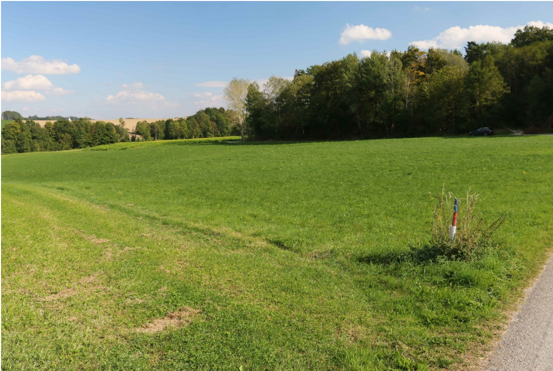
Bild 16: Das was man hier sieht, ist der Altbestand! Also der scheinbar kärgliche Rest nach dem Striegeln (siehe Bilder 11 und 12). Ohne Düngung! Trotz Hitze und Dürre zwischen 12. August und 30. September! Die nachgesäten Pflanzen sind noch sehr klein und stehen unter diesem (fast schon erdrückenden) Altbestand.

Bild 15: Sanierungsfläche bietet von weitem einen sehr guten Eindruck.