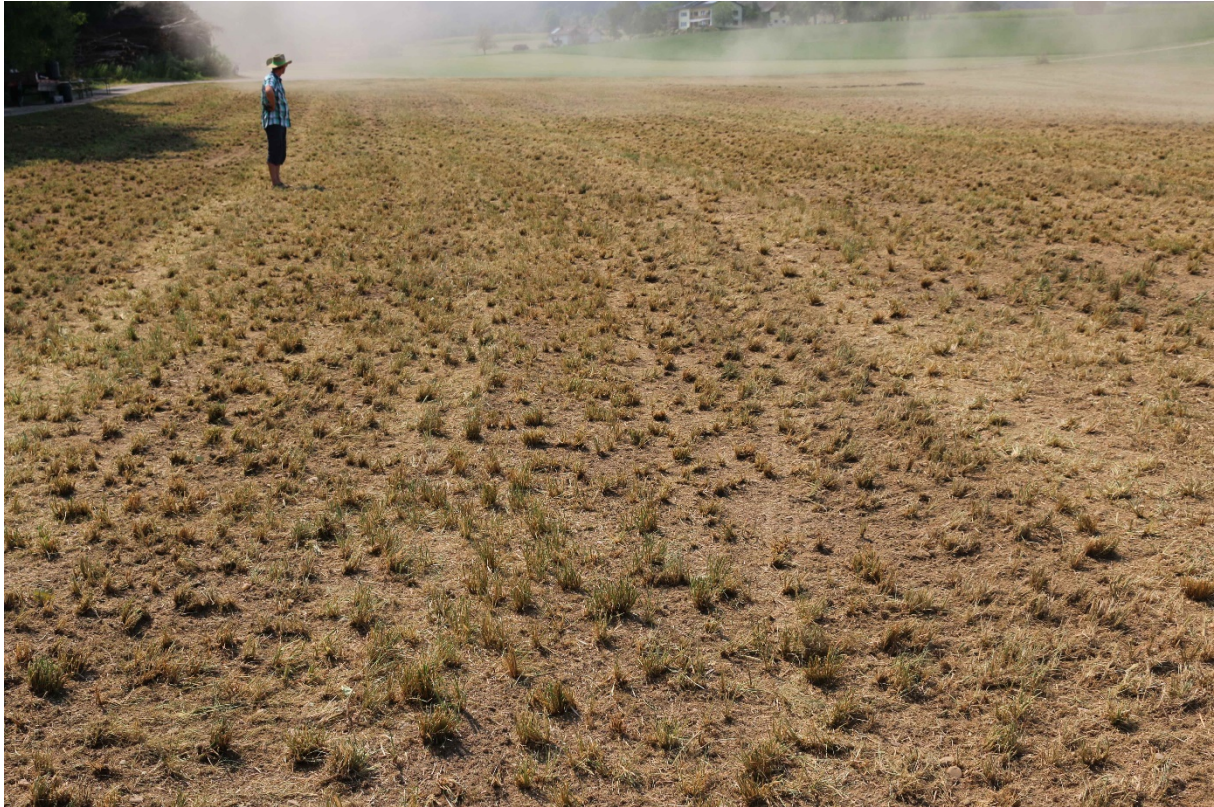
Bild 12: Optimales Striegelergebnis: Die hochwertigen Futterpflanzen sind erhalten. Die Gemeine Rispe sehr gut entfernt. Damit viel Standraum für die Nachsaatmischung

Bild 11: Kaum zu glauben, dass diese (wenigen) Pflanzen bisher fast den ganzen Ertrag des 2. bis 5. Schnittes geliefert haben. Dieses Bild gibt zu denken: Wieviel unproduktive Fläche wurde bisher mehr oder weniger sinnlos mit Gülle gedüngt? Die Gemeine Rispe bringt vom 2. bis 5. Schnitt kaum Ertrag und behindert die Aufnahme der Gülle in das Erdreich.