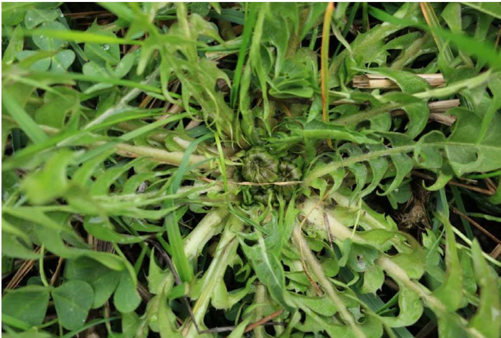
Bild 2: Der Scharfe Hahnenfuß streckt seine tief gefurchten Blätter in die Höhe.

Bild 1: Das richtige Entwicklungsstadium des Löwenzahns für die Bekämpfung mit Kalkstickstoff. Die Blätter sind flach ausgebreitet und die Knospen sitzen wie Knöpfe ganz unten in der Rosette.