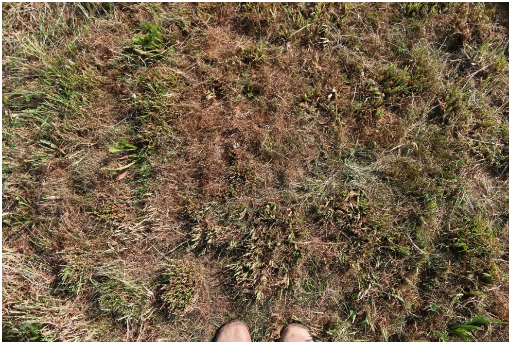
Bild 2: Der Rispenfilz ist extrem dicht, da gelangte keine Gülle auf den Boden!

Bild 1 bis Bild 3: . Ausgangssituation! Gemeine Risper dominiert. Engl. Raygras, Knaulgras und Bastardraygras sind gleichmäßig verteilt vorhanden und motivieren zur Sanierung.