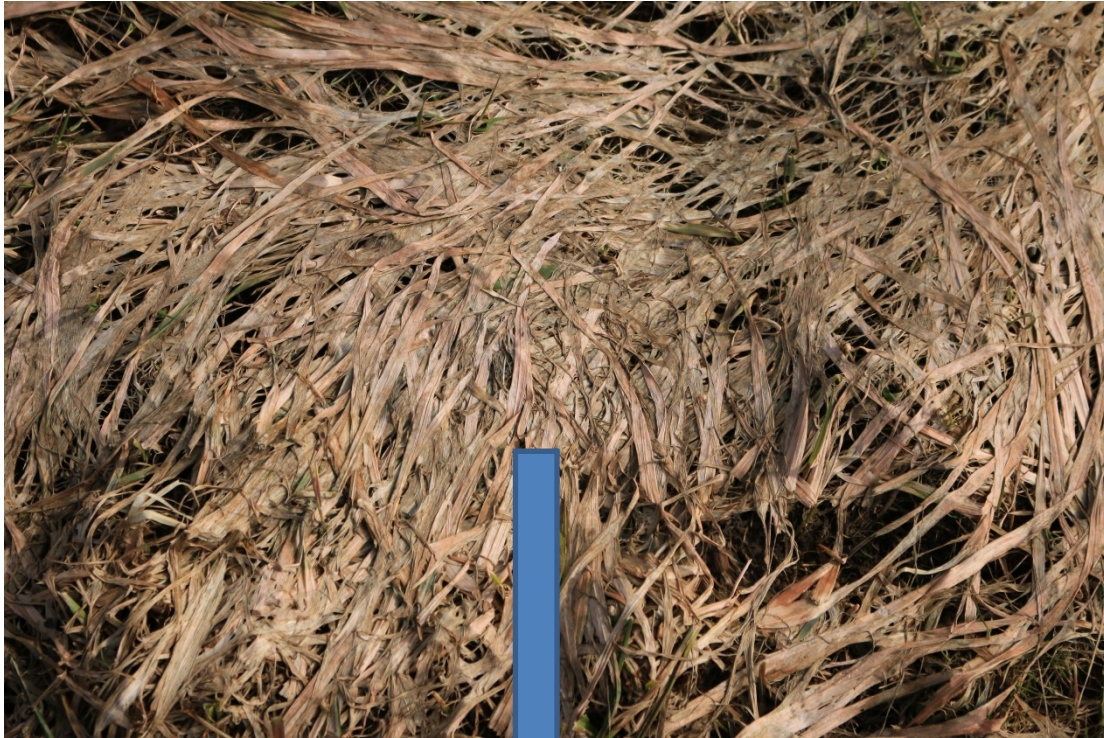
Bild 6: Wenn man diese Platten aufreißt, Graspflanze. Teilweise etwas gelblich-grün, Abschleppen solcher Flächen sind Striegel-Blattschicht am besten gleichmäßig

Bild 5: Die abgestorbenen Blätter kleben aneinander und verfestigen sich zu Platten, wenn sie abtrocknen. Diese Grashorste sind jedoch nur scheinbar abgestorben.