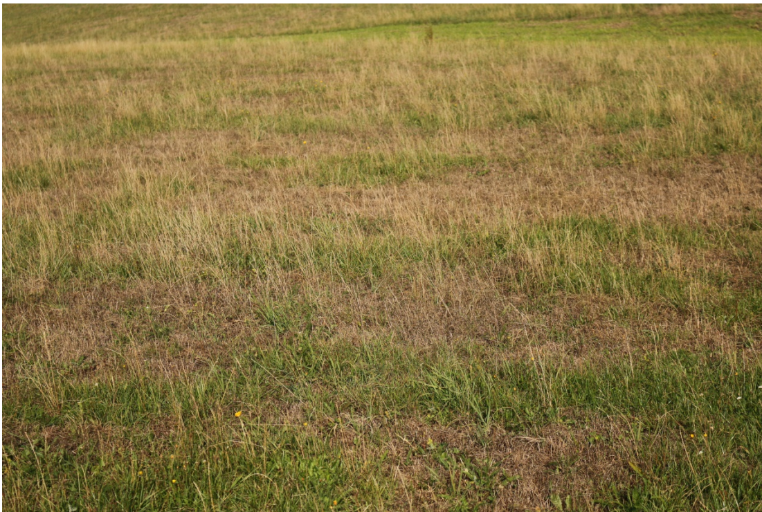
Bild 1 und Bild 2: . Weithin sichtbare Engerlingschäden. Die Fotos wurden aufgenommen am 10. September 2015.