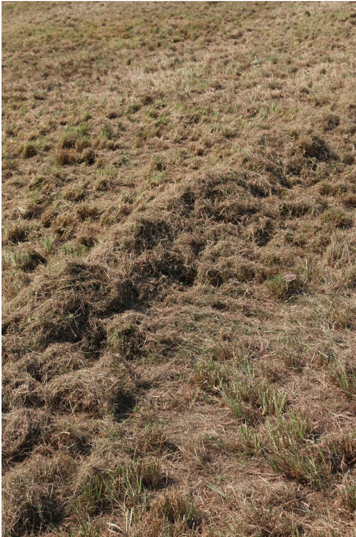
Bild 8: Nachdem dem ersten Striegeldurchgang und Abräumen ist ein erster Erfolg zu sehen. Hier beenden leider manche Betriebe die Sanierung. Aber die Gem. Rispe MUSS möglichst komplett herausgestriegelt werden. Ein zweiter Über-Kreuz-Striegeldurchgang ist immer notwendig!