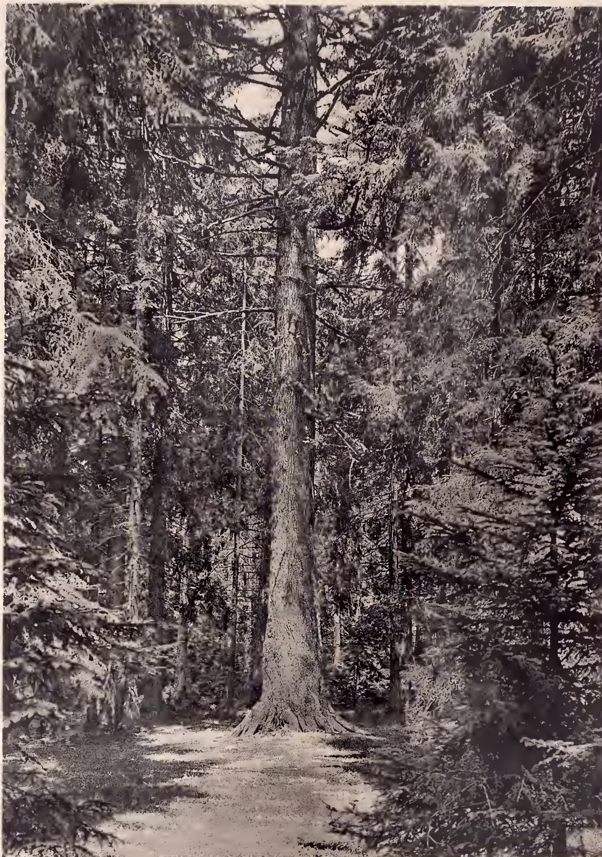
Lichtdruck: Polygraphisches Institut A.-G., Zürich