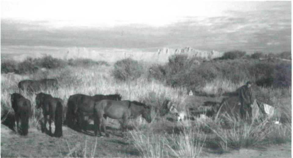
Grassland and horses in a country with 13 % special protected aereas in its territory. — Grasland und Pferde in einem Lande mit 13 % geschützten Gebieten. 2

The beginning of 1990s brought new challenges for conservation and protection with economic and political transitional approaches. Also new trends and concepts of conservation in terms of biology and sustainable development brought a whole new re-thinking of existing approaches. Thus, a special protected area network has been established throughout the country, taking in about 13 percent of its territory. Dozens of laws and regulations have been passed by the Parliament and hundreds of resolutions have been approved by the Government. The core of these laws include: Law on Environmental Protection, Law on Protected Areas, Law on Forest Resources, Law on Fauna, Law on Plants, and many others. The paper will inform about the conservation structure and implementation mechanisms now operating in Mongolia.