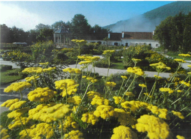
Abb. 166: Historischer Garten mit Blick auf das Gärtnerhaus aus dem 16. Jh.

HERBERSTEIN • TIER- UND NATURPARK SCHLOSS HERBERSTEIN OEG Buchberg 2, 8222 St. Johann/Herberstein Tel.: 03176/88250, Fax: 03176/877520 E-mail: office@herberstein.co.at