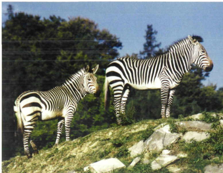
Abb. 163: Sehr oft halten Herdenmitglieder der Zebras auf einem Hügel Wache, während die restliche Gruppe frisst.