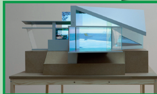
Karina Nimmerfall, The Glass House (Modern Contemporary) , 2010, Mixed Media Installation

Zu den interessantesten Neuerwerbungen der Landesgalerie Linz gehört die Installation Glass House (Modern Contemporary) der Künstlerin Karina Nimmerfall. Im Sinne eines Architekturmodells für eine imaginäre Filmproduktion konstruiert Nimmerfall aus verschiedenen Filmkulissen ein modernes Haus, das aus vielen gläsernen Elementen besteht und dessen labyrinthartig versetzten Räume den Protagonisten zum Verhängnis werden könnten. Die Formfragmente beziehen sich auf bekannte Gebäude wie die Sheats Goldstein Residence von John Lautners (Schauplatz für 3 Engel für Charlie – Volle Power und The Big Lebowski ) oder Zaha Haddids Science Center phäno (Im Film The International als die Zentrale eines Waffenkonzerns zu sehen). Zudem ist das Glass House mit kleinen Projektionsflächen ausgestattet, die Videoprojektionen und digital bearbeitete Filmstills von Ein- und Ausblicken aus den Häusern zeigen.