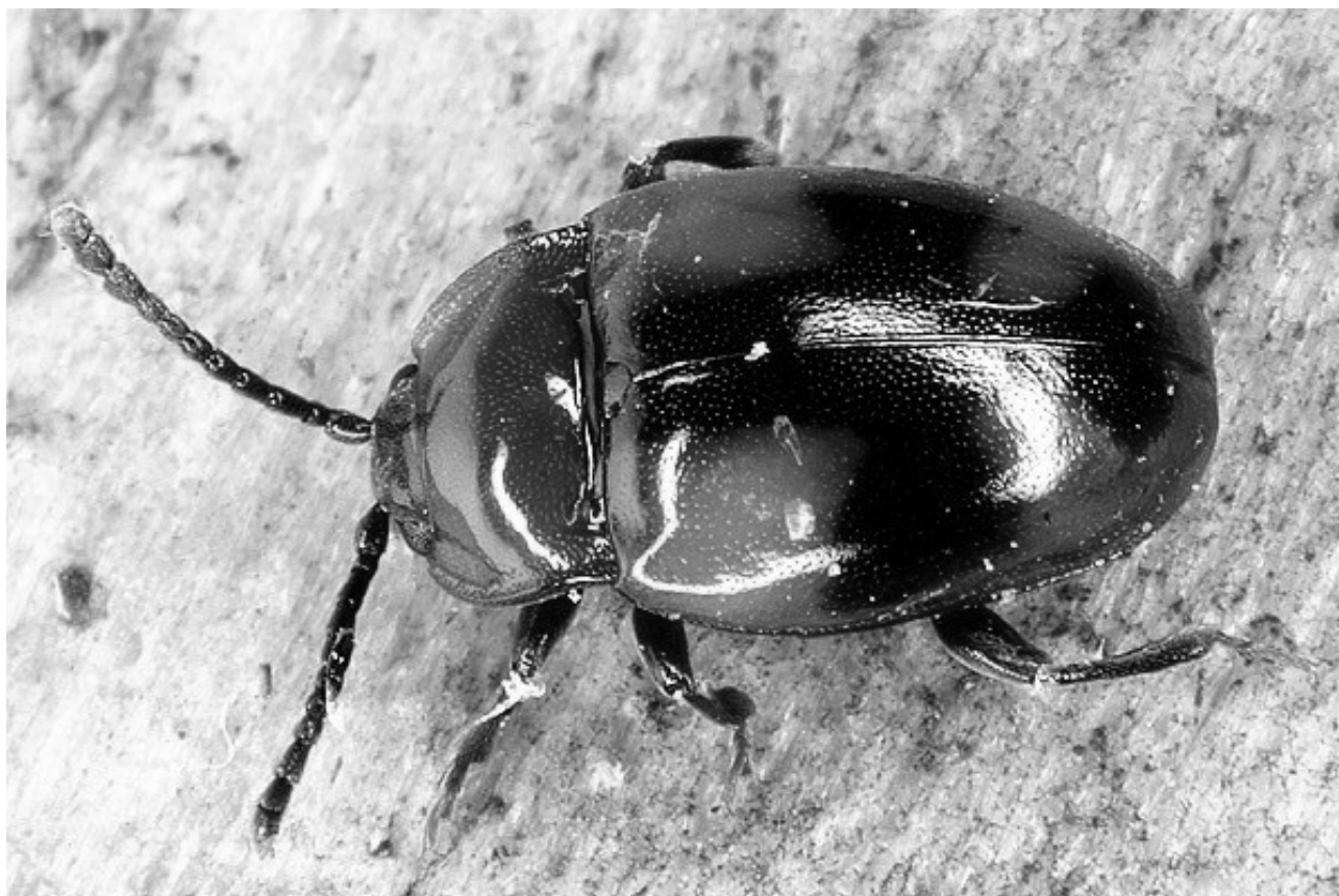
Mycetina cruciata (SCHALLER, 1783)