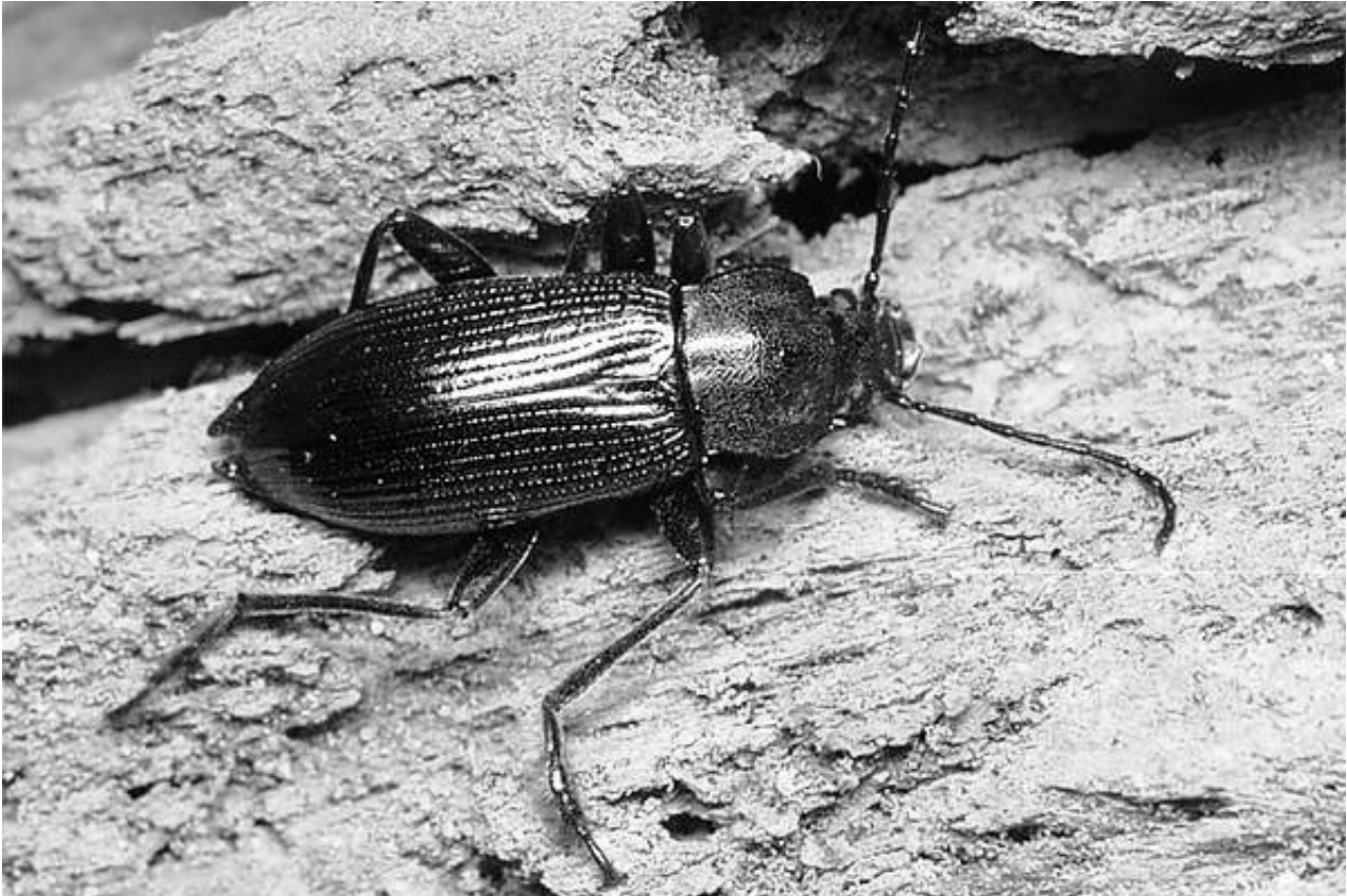
Stenomax aeneus (SCOPOLI, 1763)

Neben je einem Fundpunkt in Berlin-Steglitz (vermutlich schon erloschen) und in Potsdam (Großer Schragen, 20.04.1995, leg. et vid. Bellmann, Esser & Möller, mehrfach) konnte im NSG Forsthaus Prösa (bei Bad Liebenwerda) ein weiteres Vorkommen entdeckt werden (10.06.2006, leg. Esser, Simbruner & Heinig 6 Ex.). Die Tiere wurden von liegenden morschen Eichenästen geklopft, ein Ex. Von Birkengebüsch (Heinig). Einzelne Larven wurden im morschen Holz liegender Starkäste und Stämme entdeckt.