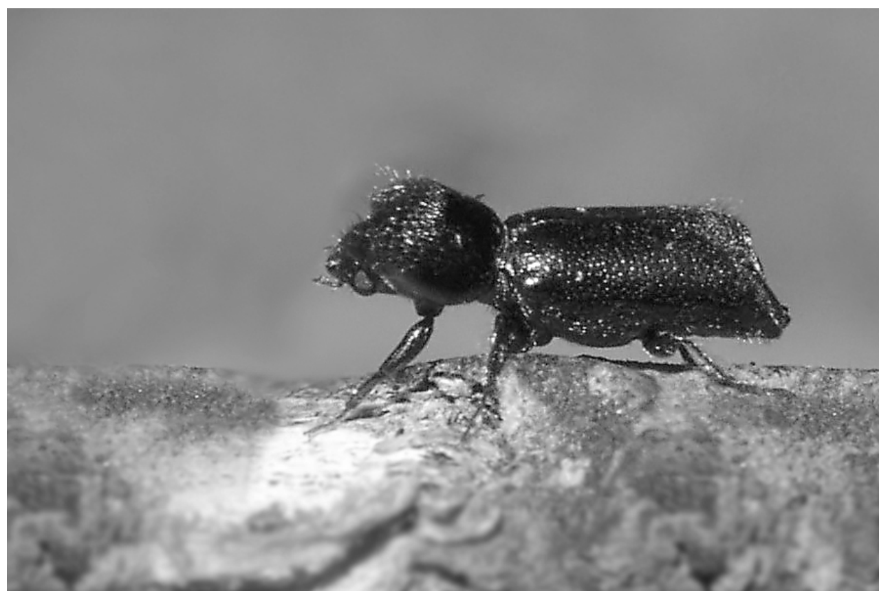
Xylopertha retusa (OLIVIER, 1790)