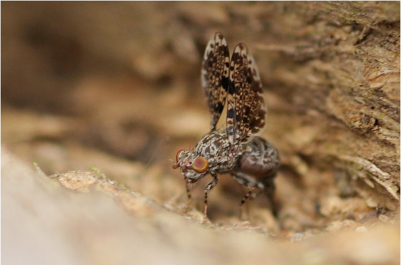
Abb. 1: Weibchen von Callopistromyia annulipes (MACQUART, 1855), 10.VI.2017, in Potsdam-Golm (Brandenburg).

Fasst man die bisherigen Meldungen der Pfauenfliege zusammen, kann von einer weiteren Ausbreitung der mittlerweile in Europa etablierten Art ausgegangen werden.