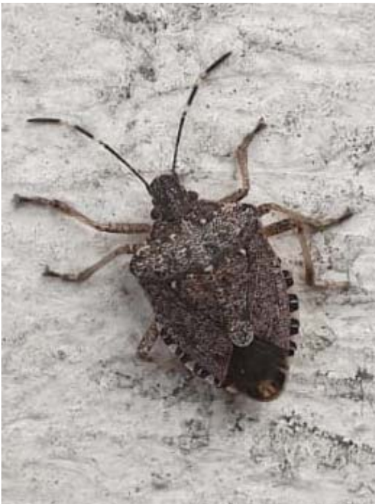
Abb. 1: Halyomorpha halys (STÅL, 1855)

Die ursprünglich aus Ostasien stammende Marmorierte Baumwanze Halyomorpha halys (STÅL, 1855) (Abb. 1) wurde Ende des 20. Jahrhunderts nach Nordamerika verschleppt (HOEBEKE & CARTER 2003). Die ersten europäischen Nachweise gelangen im Jahre 2004 in Liechtenstein (ARNOLD 2009) und in der Schweiz (WERMELINGER et al. 2008). In Deutschland trat sie erstmals im Jahre 2011 in Bremerhaven (FREERS 2012) und in Konstanz (HECKMANN 2012) auf, weitere Funde im westlichen Bodenseegebiet folgten (HECKMANN 2016). HAYE & ZIMMERMANN (2017) nennen neben weiteren Funden aus Baden-Württemberg auch die erste Beobachtung im südlichen Teil des Berliner Bezirks Tempelhof-Schöneberg (1 Imago, 26.12.2016, Wünsdorfer Straße). Während auch in Rheinland-Pfalz (HANSELMANN 2016), Hessen (MORKEL & DOROW 2017, MORKEL & RENKER 2019), Nordrhein-Westfalen (KOTT 2019a, KOTT 2019b) und Bayern (BRÄU 2019) Nachweise erfolgten, blieb der Fund aus Berlin vermutlich die einzige Beobachtung der Art in Ostdeutschland (DECKERT in litt.).