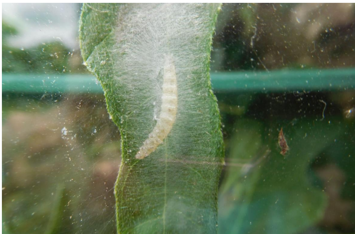
Abb. 9: spinnende Raupe unter dem Gespinst zur Herstellung des Blattwickels als Ort der Verpuppung.