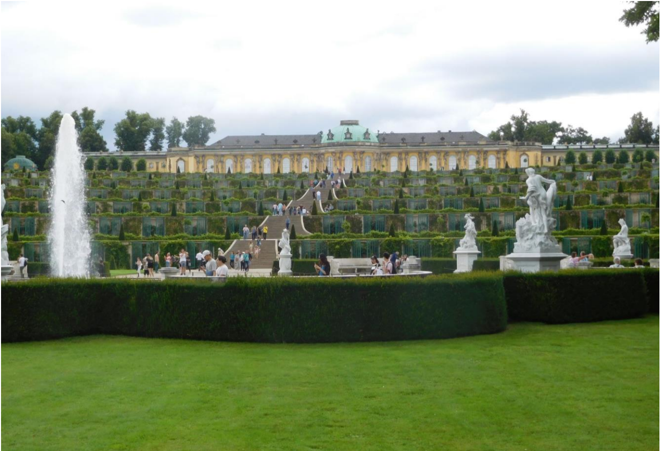
Abb. 5: Ansicht der Weinbergterrassen und des Schlosses Sanssouci von Süden.