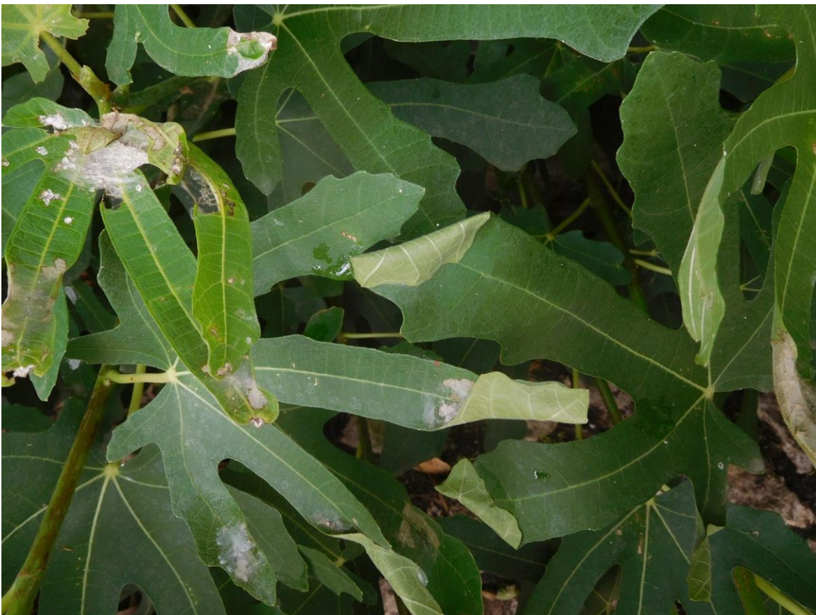
Abb. 11: Verpuppung in gefalteten Blattspitzen.