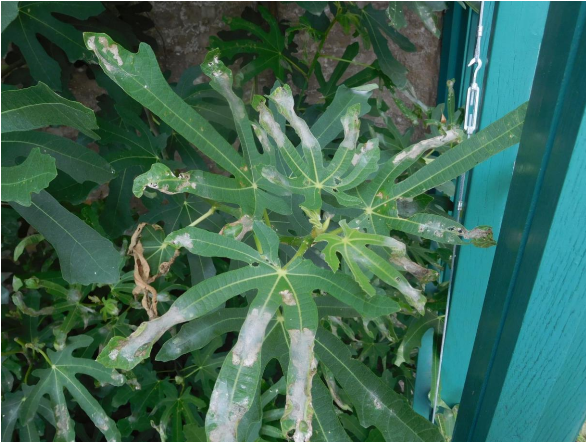
Abb. 10: Fraßschäden an den Blättern der Sorte „Rouge de Bordeaux“.