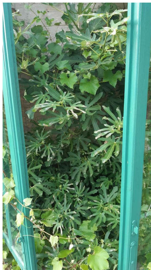
Abb. 7 (links): Ficus Nische mit geöffneten Fenstern.