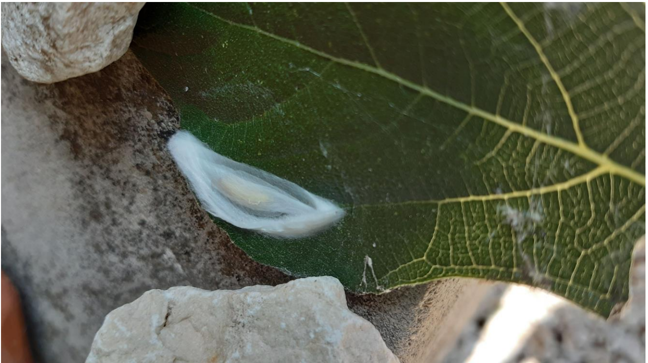
Abb. 12: Geöffneter Blattwickel mit frischer Puppe im weißen Kokon.