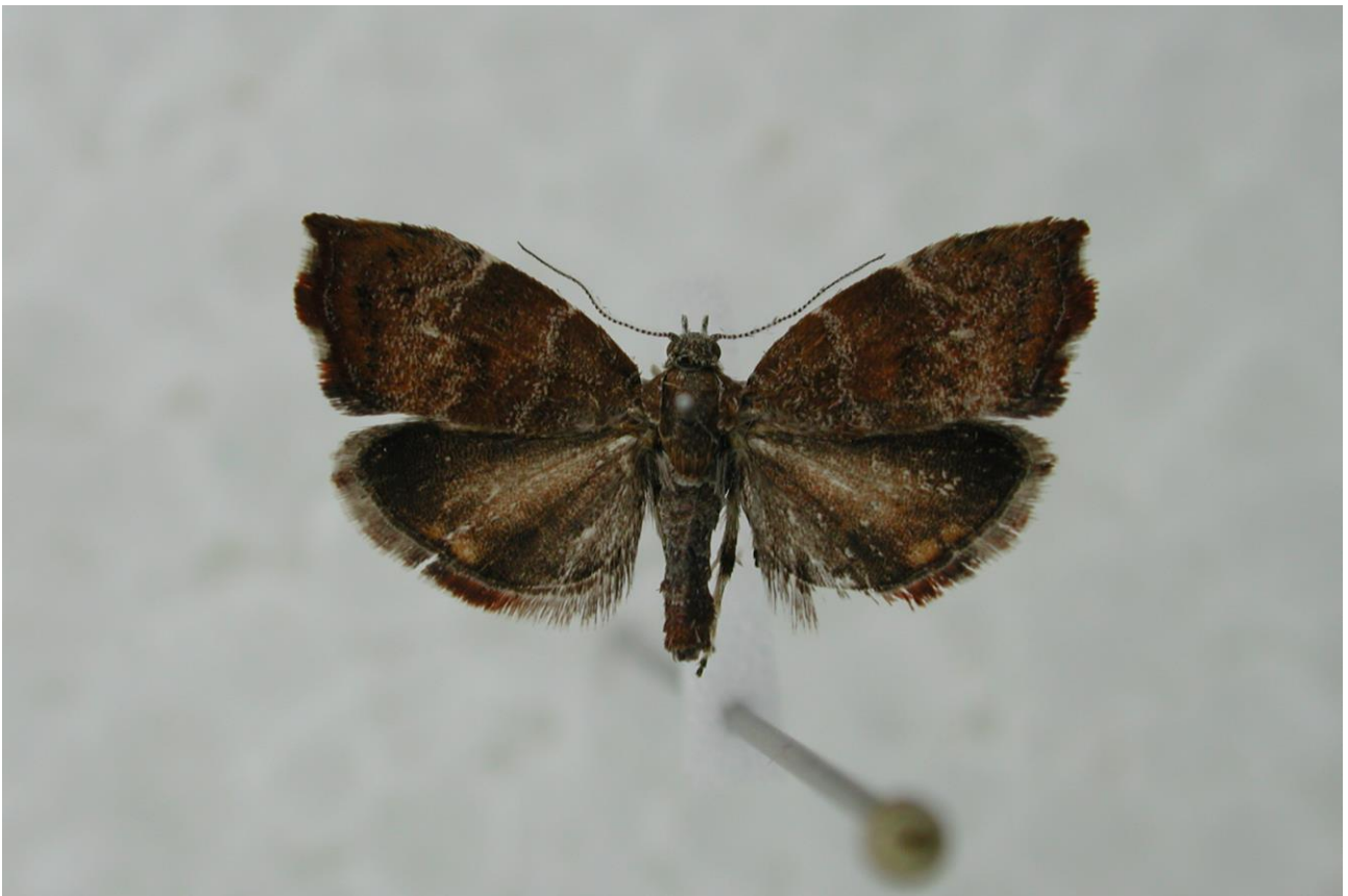
Abb. 3-4: Choreutis nemorana (HÜBNER, 1799), Potsdam, Sanssouci 3 (oben) - ♀, 13.8.2023, 4 (unten) - ♂, 13.8.2023.