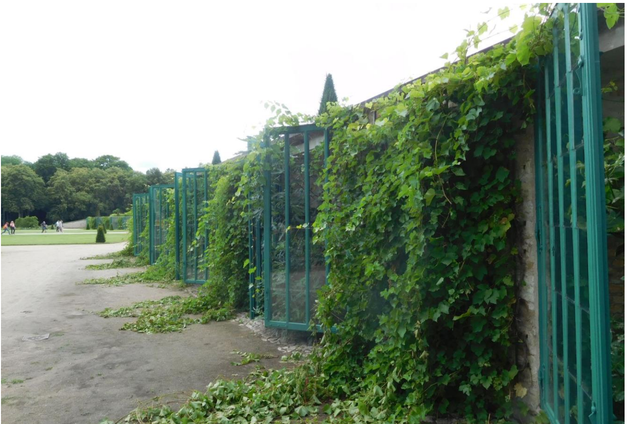
Abb. 6: Unterste Terrassenstufe mit Weinreben und Ficus Nischen in alternierender Reihenfolge.