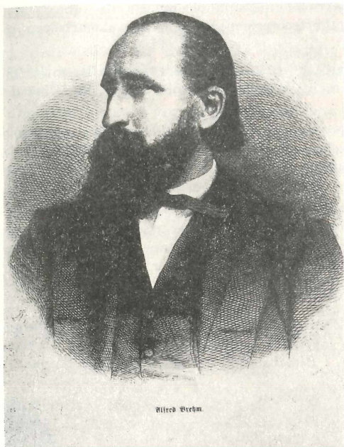
Abb. 4. Dr. A. E. BREHM (etwa 1869)