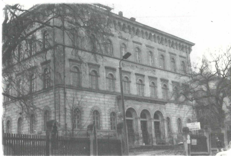
Abb. 3. Von 1908 bis 1953 war die Bibliothek der NGdO im Josephinum in der Nansenstraße untergebracht.

vielbändig waren. Er schätzte die Anzahl der am Mauritianum verbliebenen Bücher auf 1 500 [16].