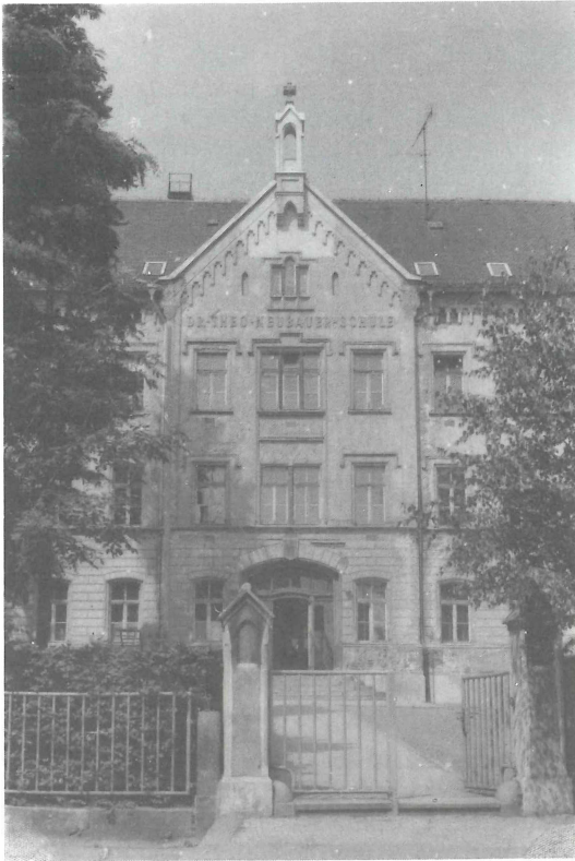
Abb. 2. Von 1905 bis 1908 befand sich die Bibliothek der NGdO im Alten Seminar in Altenburg (heute Theo-Neubauer-Schule).

verhindert werden, daß er wertvolle Bücher vor dem Abtransport nach Jena schützen konnte. In einem Brief an das Ministerium für Hochschulwesen der DDR führte E. KIRSTE Beschwerde gegen diese Vorgehensweise und erhob gleichzeitig Einspruch gegen die geplante Verlagerung der Bibliothek der ehemaligen NGdO an die UB Jena [12].