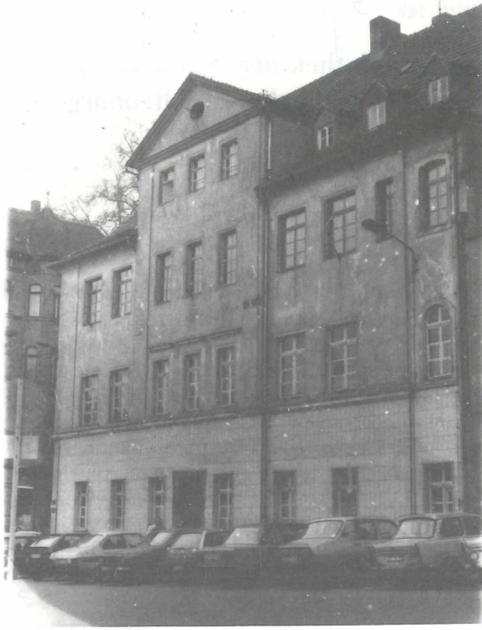
Abb. 1. Von 1900 bis 1905 war die Bibliothek der NGdO im Herzoglichen Gymnasium (heute Institut für Lehrerbildung, Brüdergasse) untergebracht.