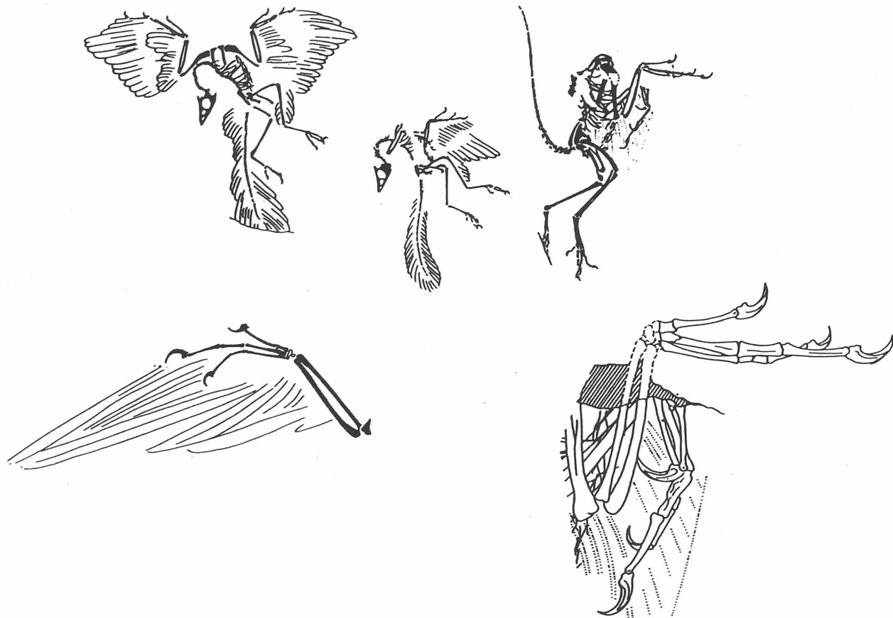
Abb. 1. Archaeopteryx . Ausrichtung der Spitzen der Fingerkrallen nach vorn oder nach hinten. Obere Reihe: Berliner Exemplar (links), Eichstätt Exemplar (Mitte), Solnhofener Exemplar (rechts). Untere Reihe: linker Flügel des Exemplars des Solnhofener Aktienvereins (links), linker und rechter Flügel des Solnhofener Exemplars (rechts). Aus WELLNHOFER 1988, 1993.