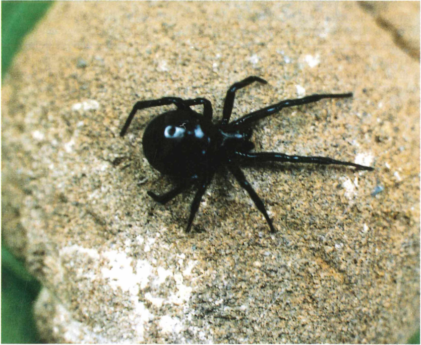
Abb. 5. Weibchen der Kugelspinne Steatoda paykulliana (WALCKENAER)