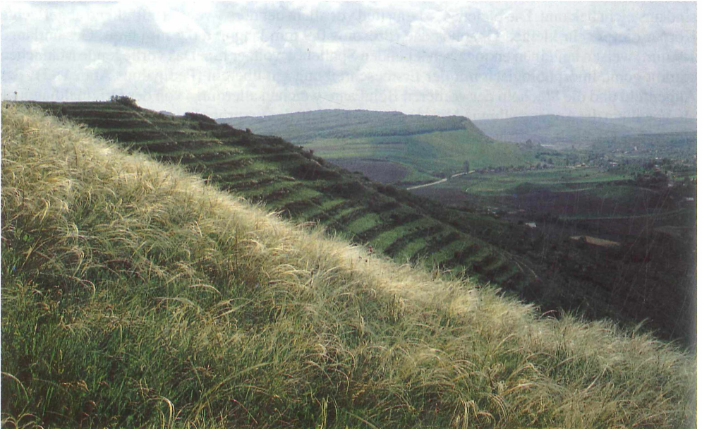
Abb. 6. Hangsteppe, Botanisches Reservat Suatu

Aus Rumänien liegen von dieser Springspinne der südlichen Paläarktis (Spanien bis Korea) bisher nur zwei Nachweise unter H. pouzdranensis von südsiebenbürgischen Steppenstandorten vor (NSG Zakelsberg und Șerbuța-Tal; WEISS 1987), die unter diesem Namen von FUHN & GHERASIM (1995) übernommen wurden. Weitere mitteleuropäische Funde sind von Steppenstandorten Mährens und der Slowakei (GAJDOS et al. 1984) bekannt. Die Beziehungen zu H. lineiventris -Populationen aus den Alpen (bis 2.800 m, auch genitalmorphologisch distinkt, THALER 1987) bleiben unklar. Im Verzeichnis der thermophilen Spinnen Süd-Mährens führt BUCAR (1997) H. pouzdranensis weiterhin als eigenständige Art auf.