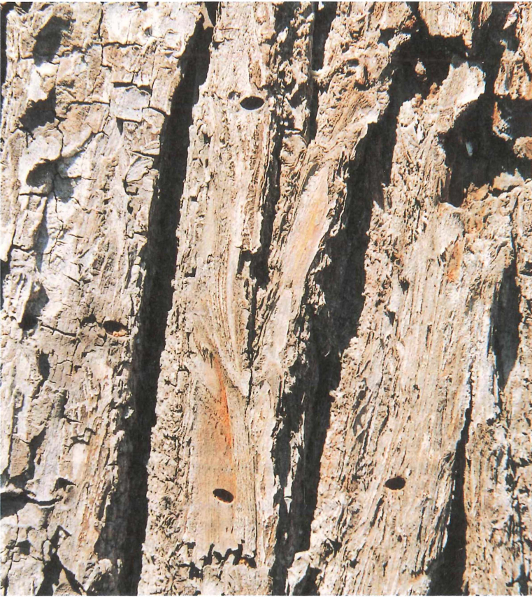
Abb. 1. Schlupflöcher des Großen Lindenprachtkäfers ( Scintillatrix rutilans ) in der Borke der befallenen Linde ( Tilia ) bei Posterstein. 12. Juni 2000

Nach den bisherigen Kenntnissen existieren in Ostthüringen neben den Vorkommen im Altenburger Gebiet zwei weitere in der Umgebung von Rudolstadt, die STUMPF (1997) veröffentlichte (vgl. KOPETZ & HARTMANN 1995), ein unpubliziertes bei Cossengrün nahe der Landesgrenze, das von A. WEIGEL 1997 aufgefunden wurde, und möglicherweise ein weiteres bei Ranis, auf das nur durch einen Totfund geschlossen werden kann (HARTMANN et al. 1996). Den Kenntnisstand über die Verbreitung der Art in ganz Thüringen vermittelt Abb. 2.