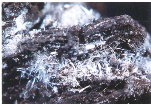
Tafel I: Sekundärmineralkrusten am Tagebaustoß des Bitterfelder Unterbegleiters (BIUB) im Tagebau Goitsche (Baufeld Niemeck).

Bild A: Die am Tagebaustoß makroskopisch sichtbare weiße „Mineralausblühung“ (Typ I) besteht aus Alunogen; die gelb-orange Kruste (Typ II) aus Magnesiocopiapit. Aufnahme F. W. JUNGE, 17. 11. 2004.