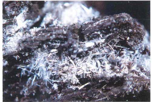
Tafel I: Sekundärmineralkrusten am Tagebaustoß des Bitterfelder Unterbegleiters (BIUB) im Tagebau Goitsche (Baufeld Niemegek).

Bild A: Die am Tagebaustoß makroskopisch sichtbare weiße „Mineralausblühung“ (Typ I) besteht aus Alunogenen; die gelb-orange Kruste (Typ II) aus Magnesiocopiapit. Aufnahme F. W. JUNGE, 17. 11. 2004.