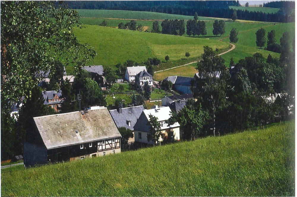
Abb. 3. Artenarme, gedüngte Fettwiese und Rinderweide in Gelenau (520 mNN) mit kleinen, randlichen Heuschrecken-Populationen. Juli 1994, Foto: G. Köhler.