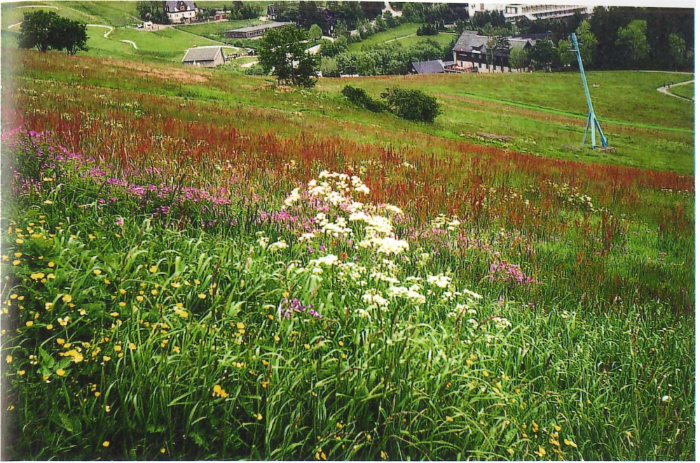
Abb. 7. Artenreiche Bergmähwiese am Hinteren Fichtelberg über Oberwiesenthal (1 040 mNN) mit Myrmeleotettix maculatus . Juni 1994, Foto: G. Köhler.