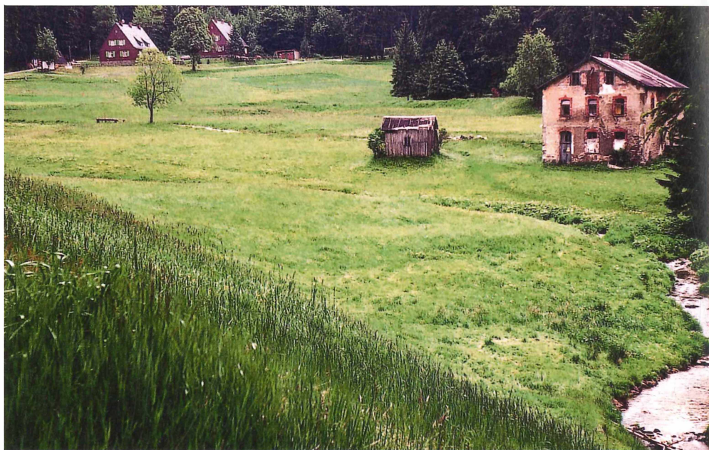
Abb. 6. Bachnahe Feuchtwiese bei Ehrenzipfel (665 mNN), mit Gomphocerippus rufus . Juni 1994, Foto: G. Köhler.