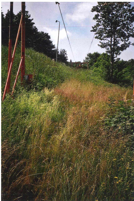
Abb. 5. Brachewiese mit Hochstauden und Jungbäumen unter einer Liftschneise am Bärenstein (845 mNN), Juli 1994, Foto: G. Köhler.