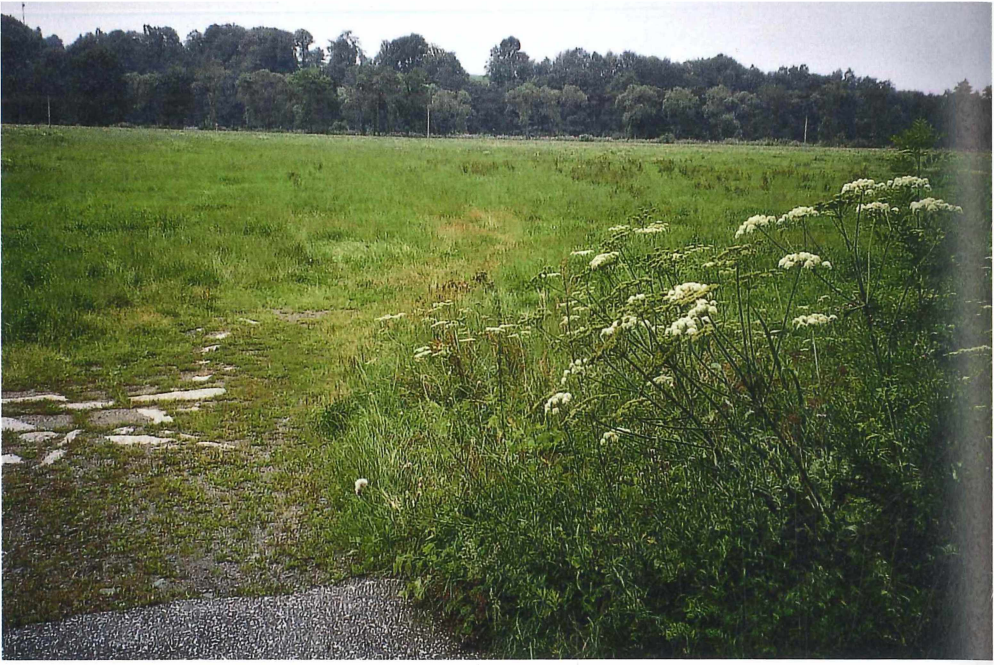
Abb. 2. Feuchtfrische Wiese mit Hochstauden bei Sachsenburg (250 mNN), mit Omocestus viridulus im Erzgebirgsvorland. August 1993, Foto: G. Köhler.