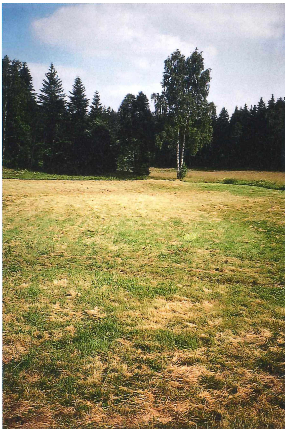
Abb. 4. Frischfeuchte Mähweide in Bachgrund bei Brünlas (585 mNN). Juli 1994, Foto: G. Köhler.

Die jeweilige Häufigkeit der Arten auf den Wirtschaftswiesen war wohl aufgrund des unterschiedlichen Bewirtschaftungsgrades ebenfalls sehr verschieden (Abb. 2–7). Am häufigsten kamen O. viridulus und M. roeselii vor, während Ch. albomarginatus und Ch. biguttulus schon deutlich weniger gefunden wurden. Alle anderen Arten blieben meist vereinzelt bis selten, was auf sehr kleine und verstreute Populationen hinweist (Tab. 3).