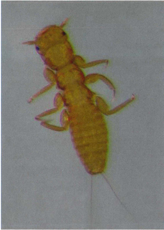
Abb. 6. Primärlarve von M. proscarabaeus (Dauerpräparat), leg. 29. 04. 2007, Fundort bei Dreiskau-Muckern. Die aus den Eiern schlüpfenden Larven besitzen am letzten Fußglied außer der Klaue noch zwei klauenartige Borsten, daher auch die Bezeichnung „Dreiklawer“ oder Triungulinus.

und „trockenen Magerbiotope“ nur Fänge an jeweils einem Standort aufwiesen (Verteilung der Fangzahlen auf diese drei Biotoptypen: 57 / 1 / 2 Individuen).