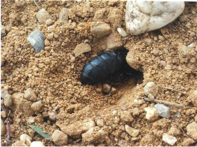
Abb. 3. Meloë -Weibchen legen ihre Eier an sonnigen, trockenen Plätzen in selbstgegrabenen Höhlungen in geringer Tiefe im Boden ab. (Aufnahme vom 01. 05. 2006, Tagebau Profen-Nord)