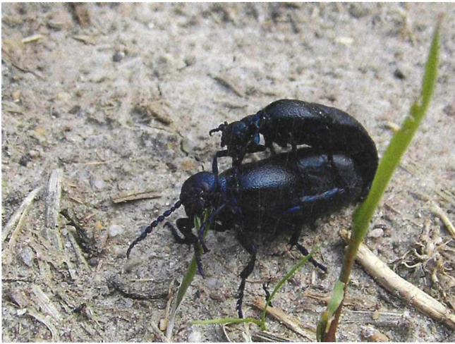
Abb. 2. Der „Schwarze Maiwurm“ ( M. proscarabaeus ) in Kopula. (Aufnahme vom 08. 05. 2006. Tagebau Profen-Nord)