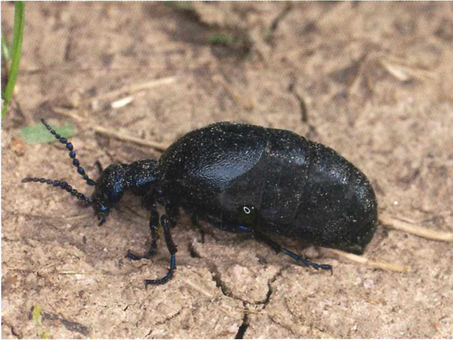
Abb. 1. Bei Beunruhigung sondern die Ölkäfer (hier: Meloë proscarabaeus ♀) an verschiedenen Körperstellen, vor allem aber an den Beingelenken gelbliche, cantharidinhaltige Hämolymphtropfen ab. (Aufnahme vom 01. 05. 2006. Tagebau Profen-Nord)