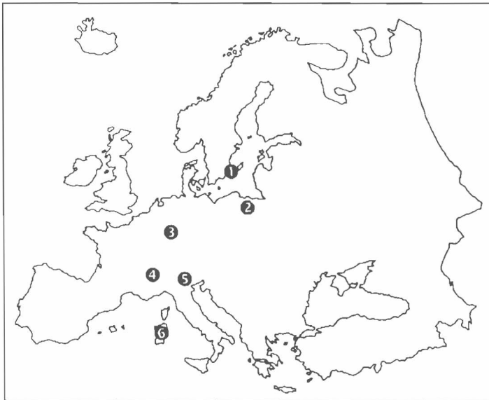
① Öland, ② Ostpreussen, ③ Mittelrhein, ④ Schweiz, ⑤ Bozen, ⑥ Sardinien