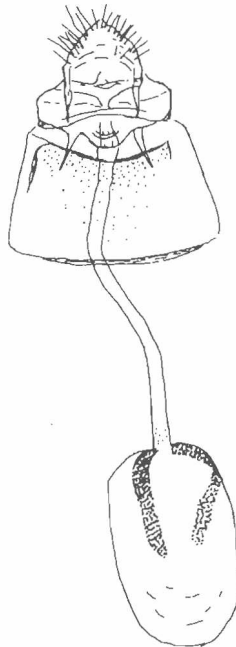
Abb. 2: Weibchen-Genital von Paromix atripalpella WAHLSTRÖM, 1979 (nach WAHLSTRÖM 1979, leicht verändert)