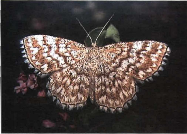
Falter von Scopula tessellaria (BOISDUVAL, 1840) Zucht ex ovo: Perl (Hammelsberg)