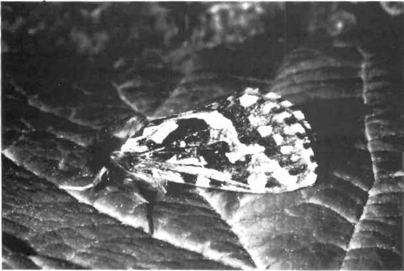
Abb. 1: H. fusconebulosa -♂ vom 12.6.89