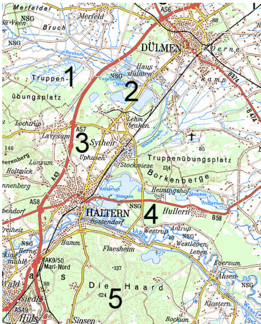
Karte 2: Die Untersuchungsgebiete im Bereich Dülmen - Haltern