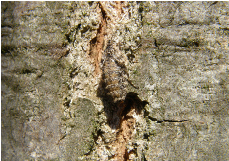
Weibchen von Dasystoma salicella (HÜBNER, 1796), Speyer, 29.03.2008