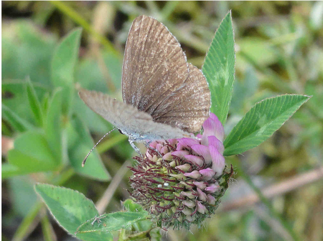
Abb 2: Cupido argiades (PALLAS, 1775)-♀ nach der Ablage von zwei Eiern in ein Rotklee-Blütenköpfchen. Wuppertal, ehem. Deponie Eskesberg, 10.09.2012