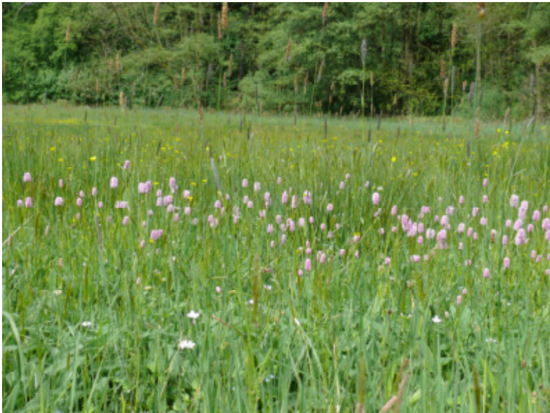
Abb. 3: Felderbachtal bei Velbert-Nierenhof, Wiese mit Schlangen-Knöterich-Beständen ( Polygonum bistorta ), 05.2009