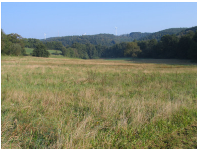
Abb. 2: Velbert-Langenberg, oberes Deilbachtal, NSG „Feuchtwiese“, 09.2014