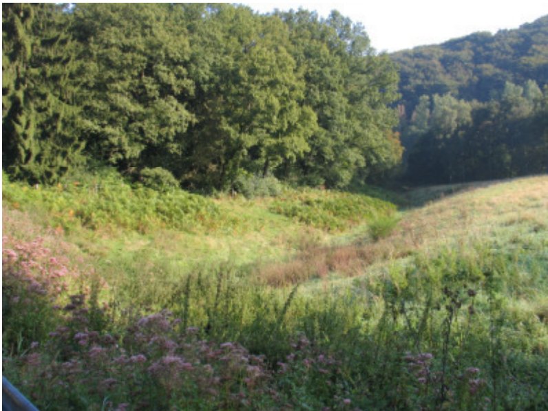
Abb. 4: Velbert-Langenberg, oberes Deilbachtal, Feuchtwiese, 09.2014