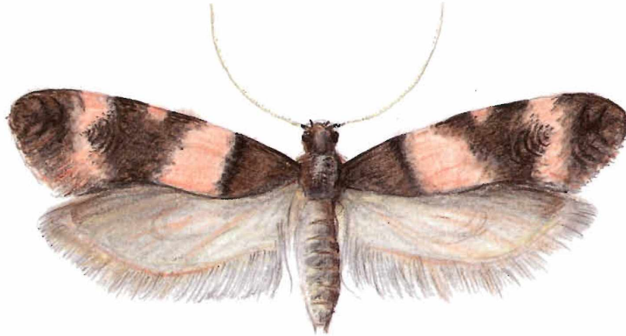
Teleiopsis rosabella (FOLOGNE, 1862) — Kattenes/Mosel (Rheinland-Pfalz), 2.7.1989, leg. WITTLAND