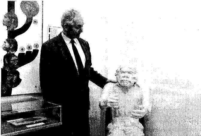
Ausstellungseröffnung im Fuhlrott-Museum mit Neanderthaler im März 1996.