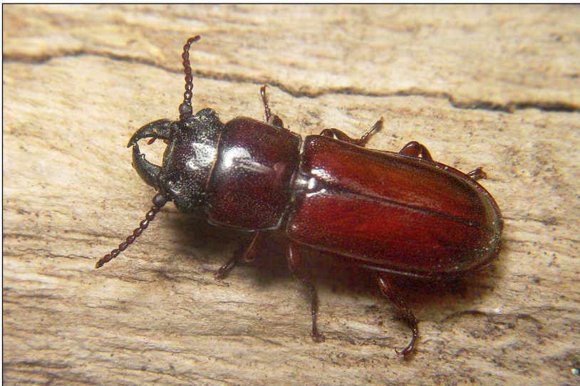
Abb. 2/3: Parandra brunnea (F.) - Weibchen.