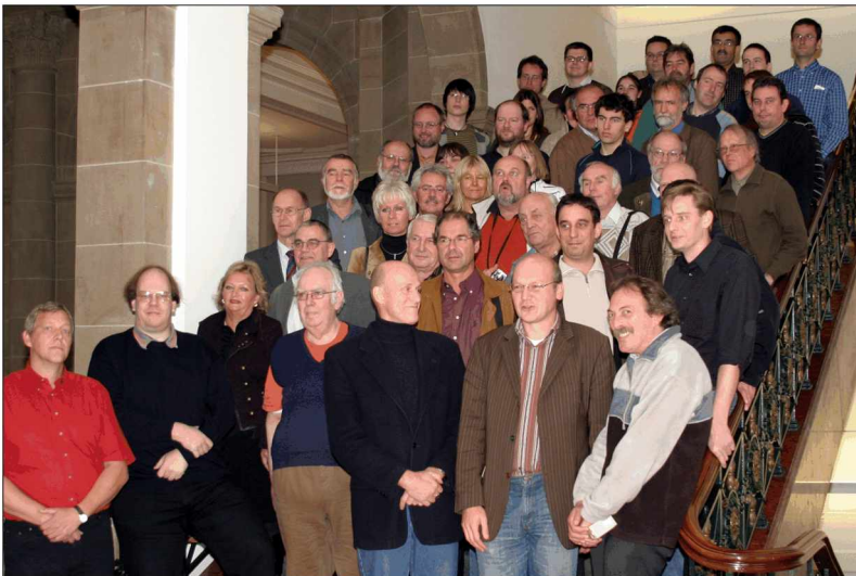
Abb. 2: Teilnehmer der Festtagung in Bonn am 10.11.2007.