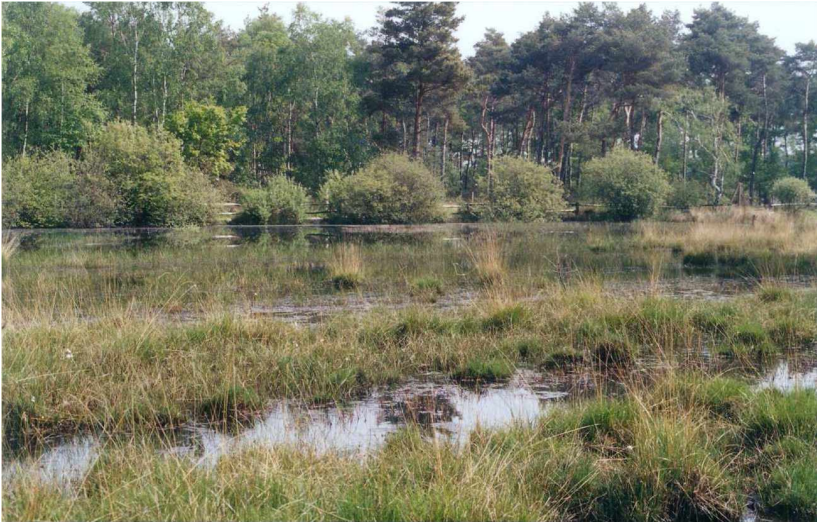
Abb. 1: Verlandungszone einer alten Sandabgrabung in der Teverener Heide.