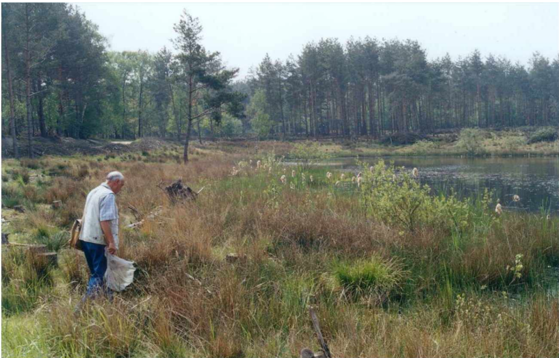
Abb. 2: Durch Biotoppflegemaßnahmen von Kiefern freigestellter Uferbereich.